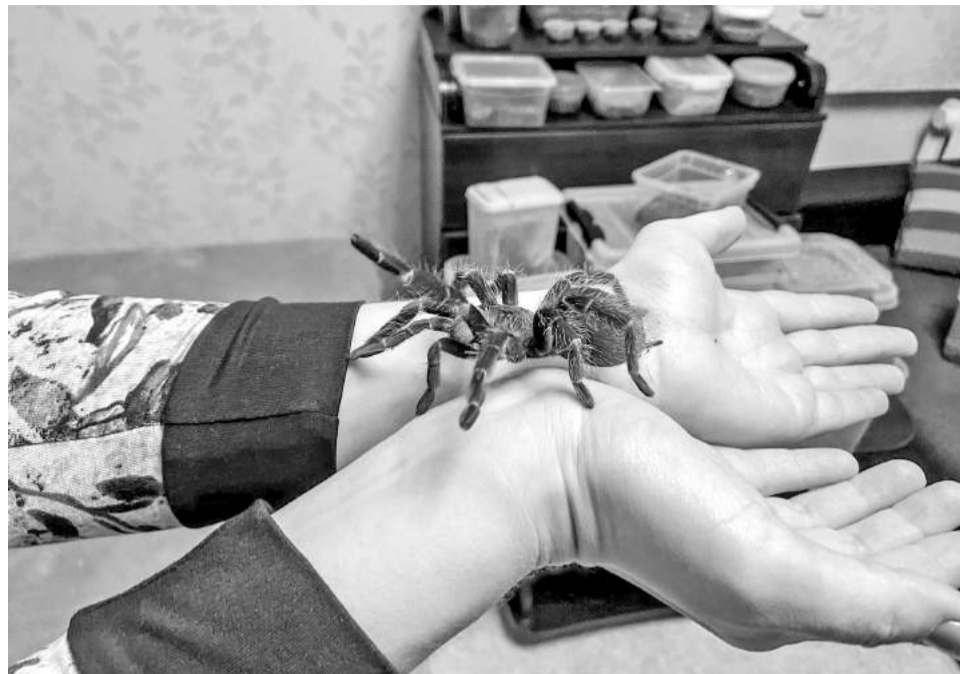
Брать на руки наземника Ласиодору Парахибану было боязно, даже зная, что он не ядовит.