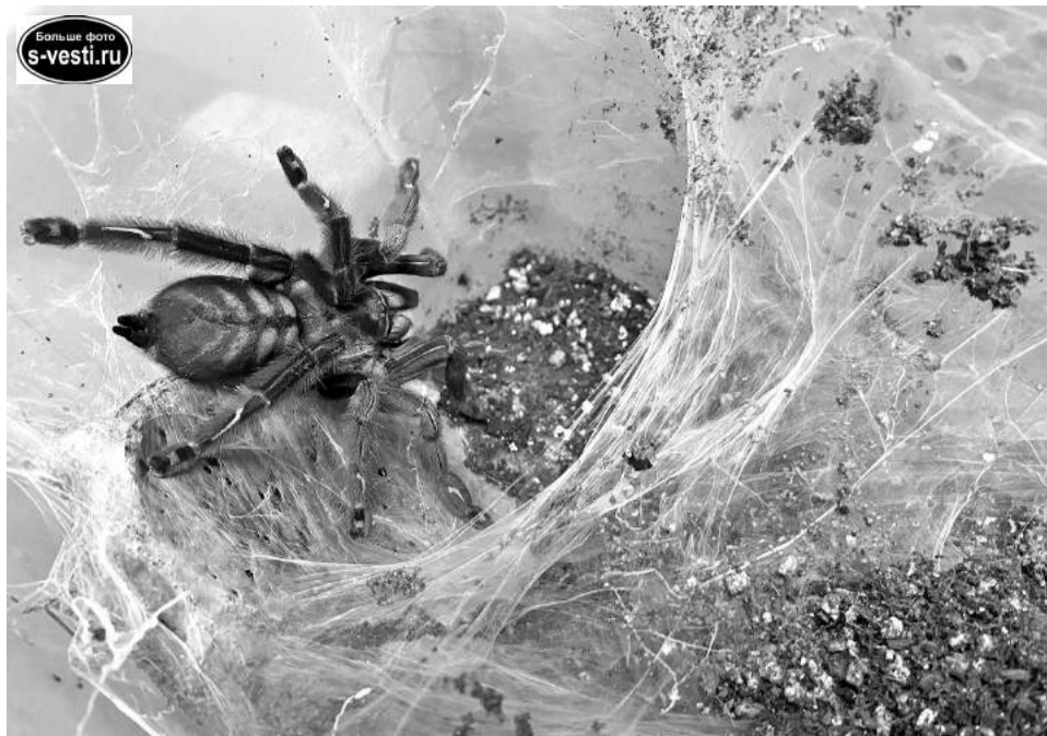
Древесник Псалмопеус Ирминия считается самым красивым пауком-птице-едом своего рода.