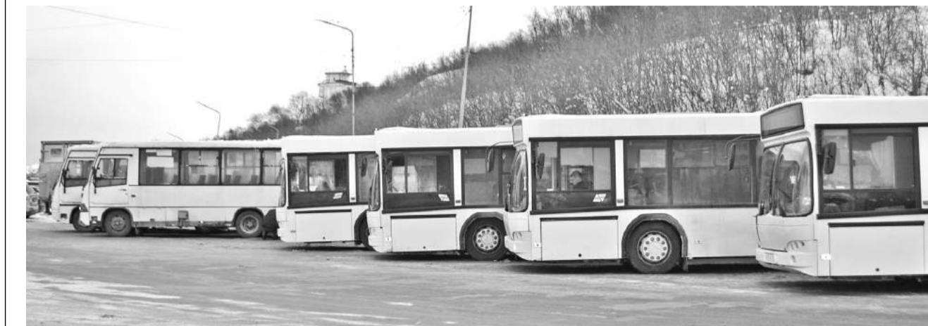
Автобусы есть – водителей не хватает.

Дома и дворы №14, 26 и 28 по ул.Душенова погода и природа регулярно проверяет на влажностойкость. Подземные воды, которые в морозы грунт «выдавливает» на поверхность, не найдя стока, скапливаются и замерзают, захватывая в ледяной плен припаркованные автомобили, дворовые подъезды. Если во дворе дома №14 решение проблемы лежит в правильной установке ливневых лотков, которые вода сдвинула, то во дворах домов №26 и 28 все не так просто. Вода стекает с высокой подпорной стенки прямо на асфальт, образуя каток в морозы и лужи в отте-