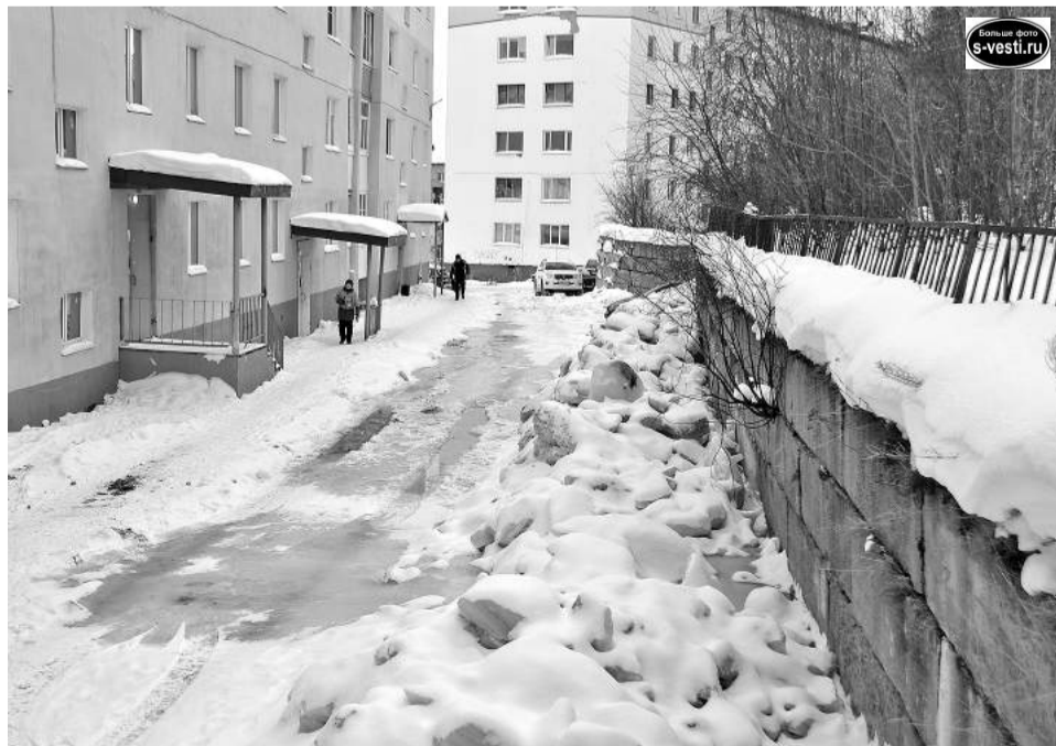
Во дворе дома №28 по ул.Душенова управляющая компания создала снежно-ледяной бруствер, мешающий воде широко разливаясь по поверхности.