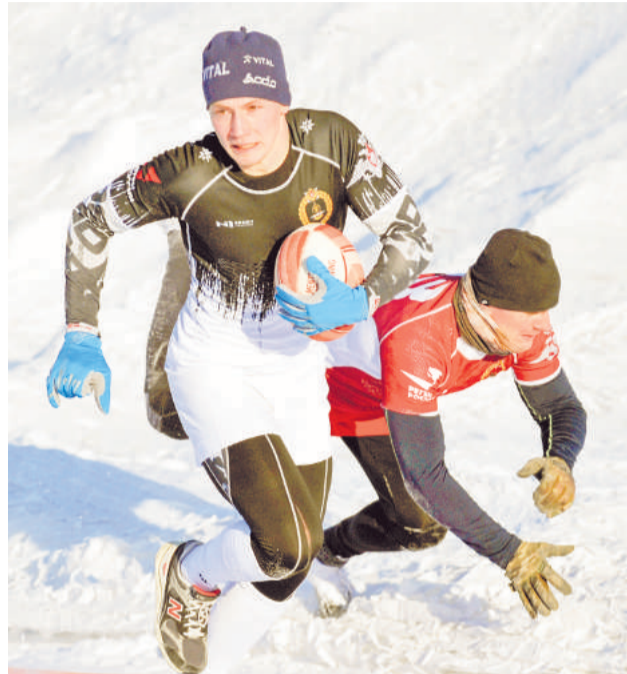
«Армата» - «Тайфун». Регбист из Гаджиево рвется к зачетному полю.

впервые. Но когда ребята в деле, разгоряченные, думаю, холод не так ощущается. Тяжело дышать – это да. Снега с поля было убрано чересчур много, поэтому площадка вышла скользкой. Его нужно чуть больше оставлять, чтобы была рыхлость. А иначе силы команд выравняются, не случайно «Армата» сегодня не смогла одолеть «Грозу» 2:2. «Армата» – морпехи из п. Спутник – выиграли все четыре тура, что неудивительно. За команду выступает много сборников, опытных игроков, которые играли в регби, еще участвовали в вузах. Именно на ее основе два года назад была создана сборная Северного флота, в которую входят 12 человек. Но для того, чтобы она стала сильной, нужны внутренние соревнования, игровая