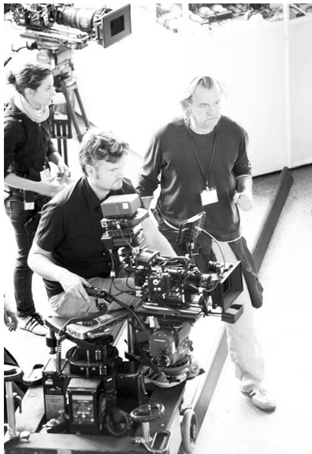
Уставшему от спецэффектов зрителю Ральф Хюттнер предлагает глубину мыслей и чувств.

Мурманская область вновь стала центром внимания для киношников. На этот раз Заполярье приглянулось как место для съемок немецкому режиссеру Ральфу Хюттнеру. Он знаком российскому зрителю по лентам «Тариф на лунный свет», «В поисках сокровищ нибелунгов», «Винсент хочет к морю».