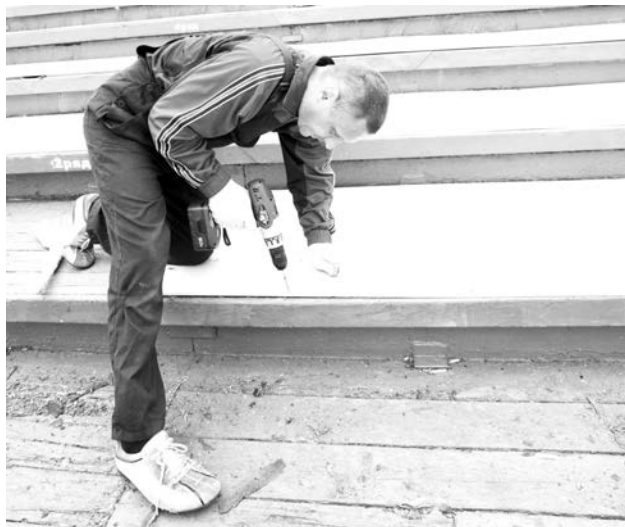
Слухи о том, что над скамейками появится единая крыша, коммунальщики опровергли.