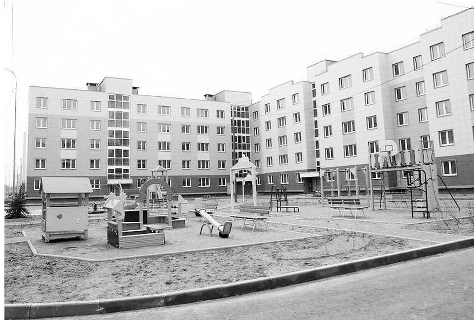
Жилой комплекс в Шушарах.