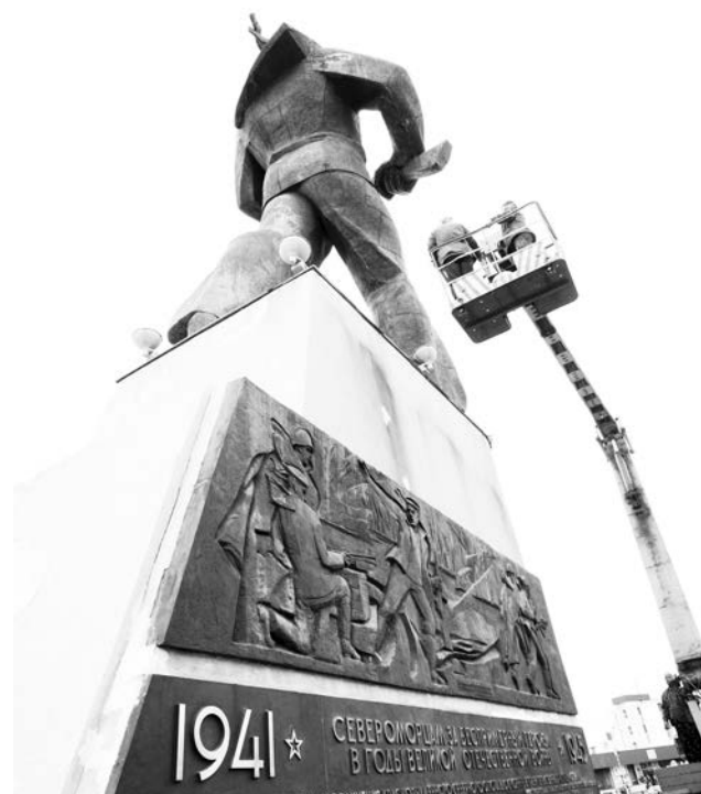
Прежде чем покрасить, гигантскую фигуру матроса пришлось долго отмывать.