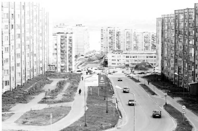
«А из нашего окна «стена китайская» видна!» — восклицают жители улиц Падорина и Сизова.

19 стали самой длинной «китайской стеной» Североморска, а ее строительство длилось всего лишь с 1983 по 1986 годы.