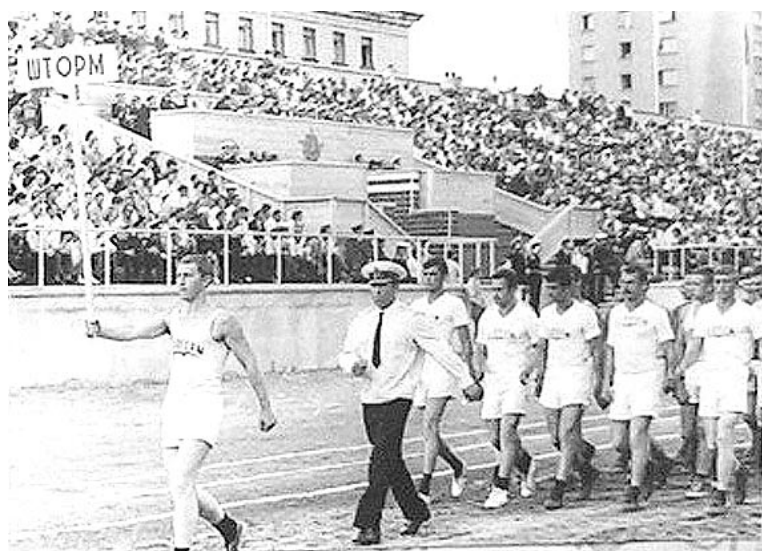
В этот день победа в спортивных состязаниях для каждой из команд военнослужащих была особенно значимой.

Не только музыкой был насыщен этот праздник. Во второй половине дня трибуны стадиона заполняли любители спорта. А все потому, что разыгрывался Кубок командующего Северным флотом по футболу. Футбол вызывал наибольший интерес, хотя Кубок командующего разыгрывался и в других видах спорта, а так-