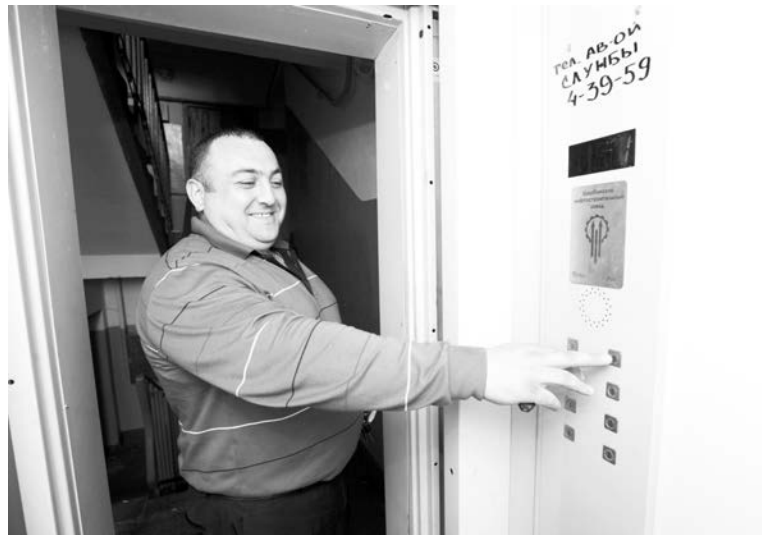
На Душенова, 8/11 прошлым летом заменили лифт. Жильцы «обновкой» довольны.

лючены контракты по котировкам, занимается капитальным ремонтом лифтового оборудования на улицах Северная Застава, Гвардейская, Инженерная, Полярная, Сизова, Гаджиева, Советская, Чабаненко, Падорина, Колышкина, Комсомольская, - дополнила Любовь Третьякова. - И проходит экспертизу проект, по которому в домах №2, 3, 5 на улице Гаджиева будут установлены новые лифты.