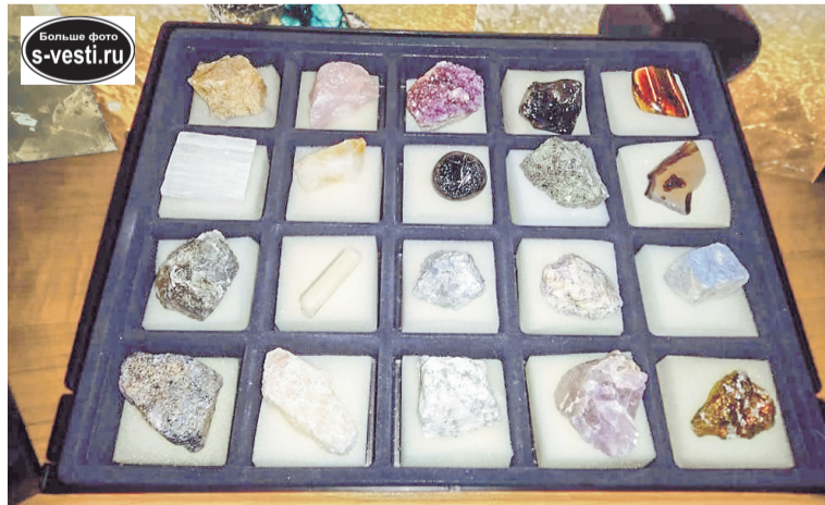
Такие разные коллекции объединяет любовь авторов к истории вещей.