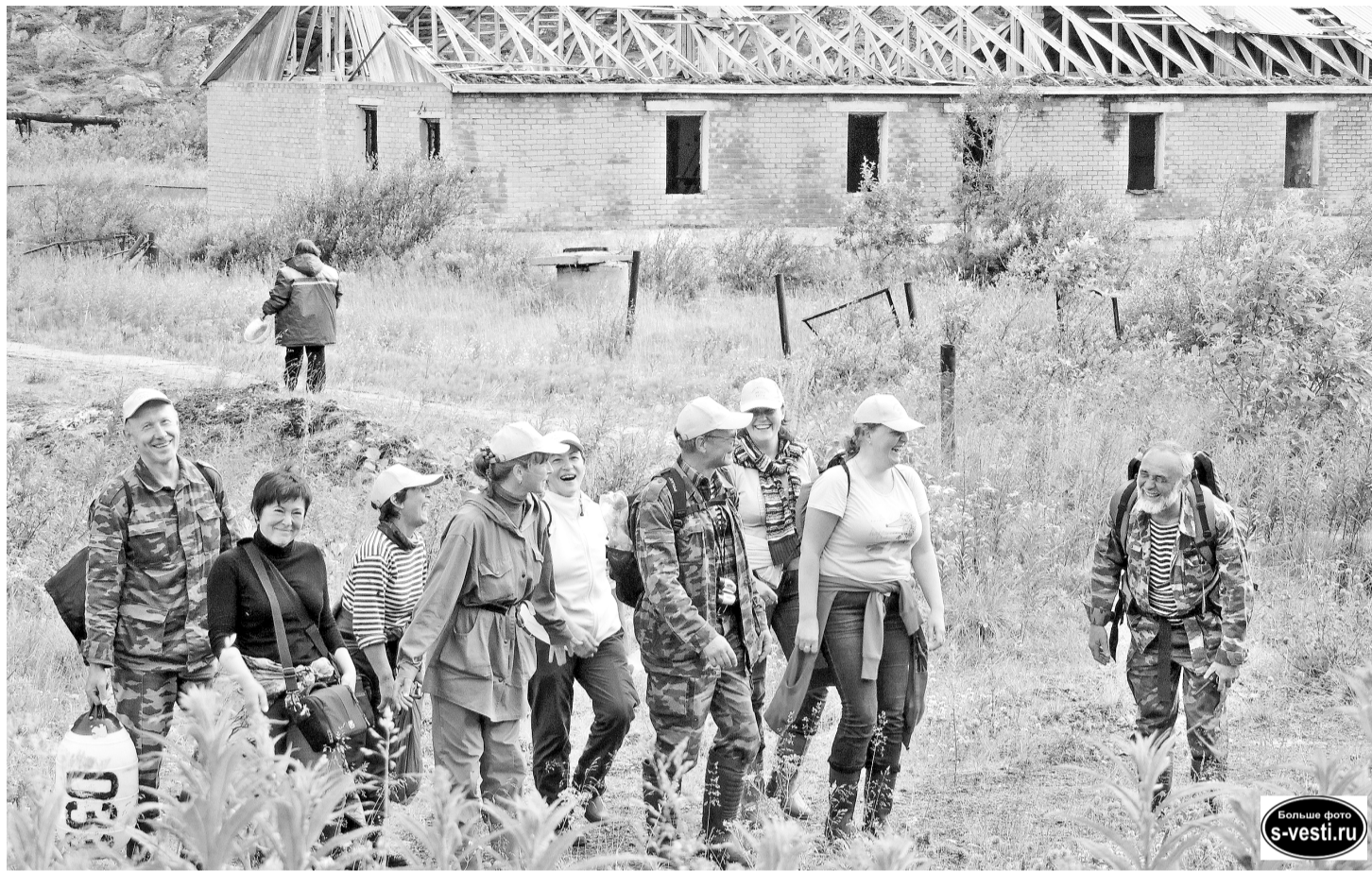
На фото один из походов 2014-го года. Возвращение в лагерь с мыса Толстик - самой северной точки острова Шалим.

Подготовила Ирина КУЗЬМИНА.