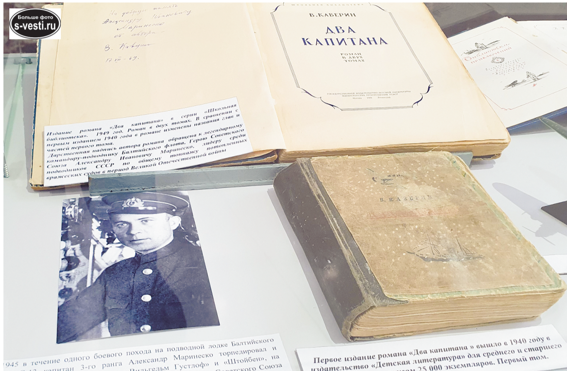
«Бороться и искать, найти и не сдаваться» - кредо двух капитанов, главных героев романа Александра Григорьева и Ивана Татаринова.

Кстати, среди экспонатов выставки есть бинокль, шлемофон, летные очки летчика-торпедоносца, фуражка морского летчика, которые могли бы принадлежать главному герою романа. Также на выставке можно увидеть китель подполковника морской авиации, участника парада Победы в 1945 году, модели самолетов, гравюры и фото военных лет.