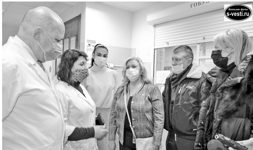
В ЦРБ ЗАТО Североморск надеются, что благотворительная акция, организованная «Единой Россией», будет продолжена.