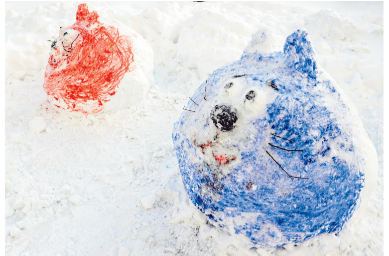
В пилотках кошки позировали недолго. Но и без головных уборов они выглядят очень мило.