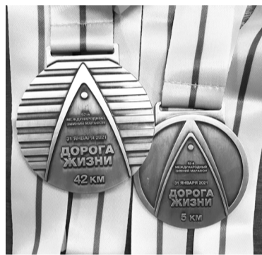
Памятные медали участникам пробега.

– В этом году марафон «Дорога жизни» был посвящен работе Ладожского флота, в том числе сторожевого корабля «Пурга». Я оказалась единственным представителем города Североморска – столи-