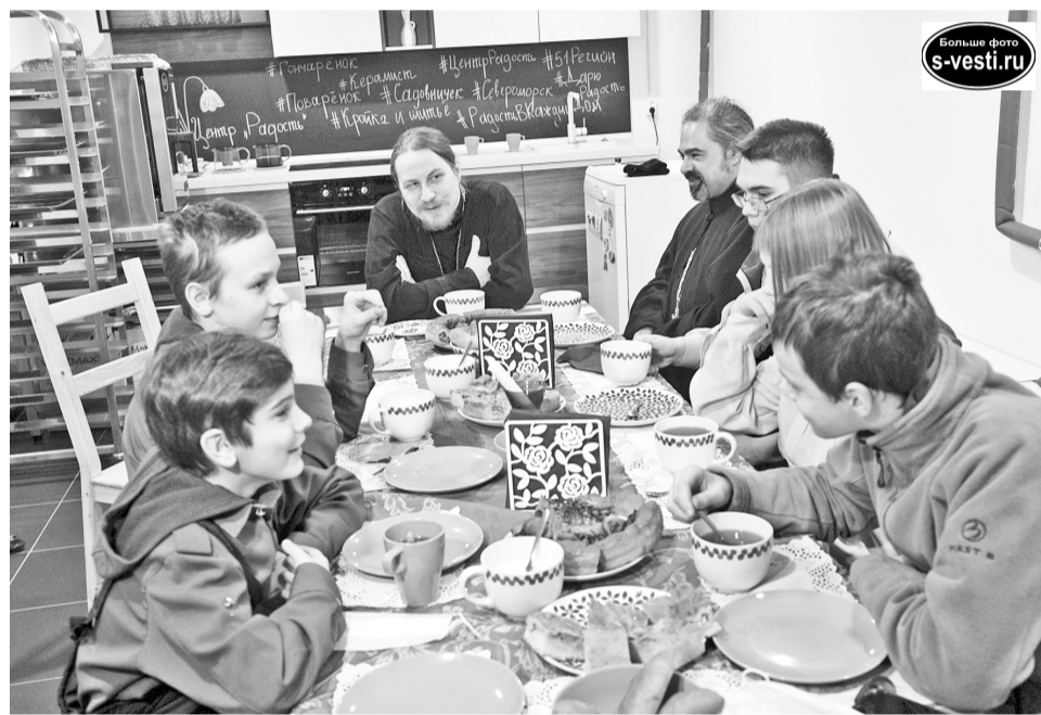
Скауты получили возможность в неформальной обстановке пообщаться с епископом.

11 февраля – Всемирный день больного человека