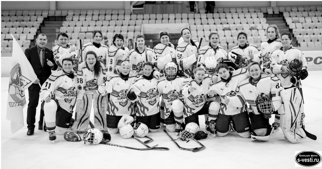
Симпатичные и неуступчивые амазонки после победного матча с петрозаводской «Вегой».

Хоккейный сезон в разгаре, матчи идут один за другим. 6-8 февраля прошла целая серия игр на самом разном уровне.