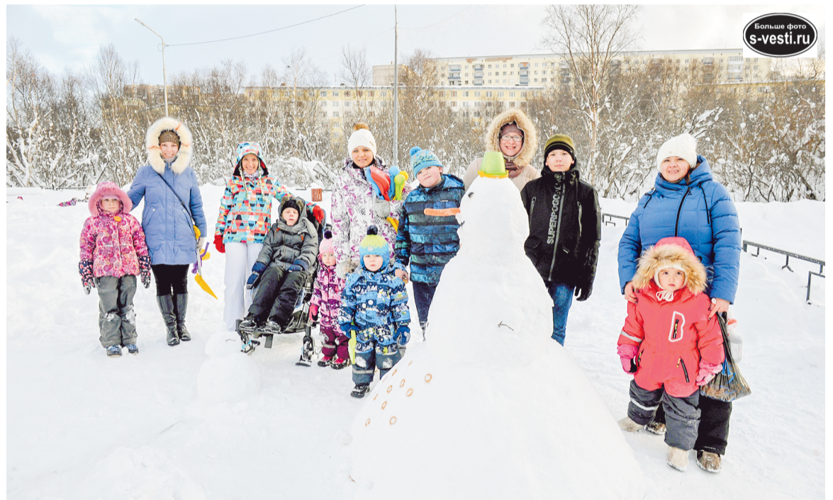
Дружная команда МРБОМСИ «Радуга» не пропускает повода собраться и повеселиться. Чем украсить снеговика? Конечно, сушками! «Вот такие у нас стразы», - шутили многодетные мамы.