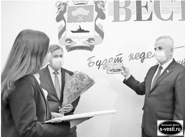
Вручение подарков - всегда приятный момент.

13 января все, кто связан с печатным делом, отмечают День российской печати.