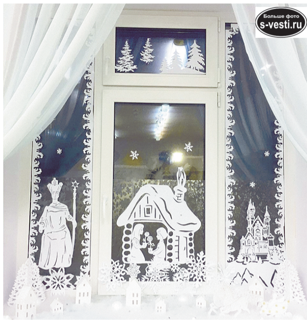
«Снежная королева» группы «Теремок» детского сада №11.