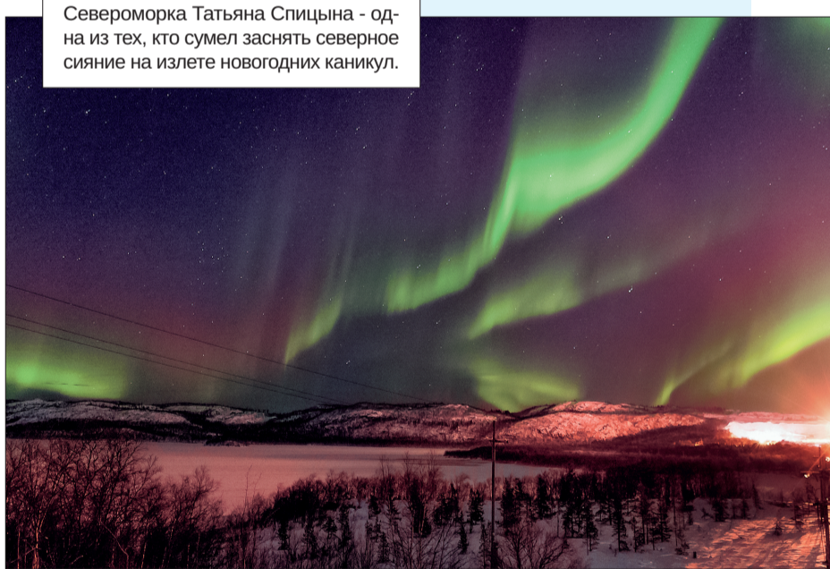
Североморка Татьяна Спицына - одна из тех, кто сумел заснять северное сияние на излете новогодних каникул.