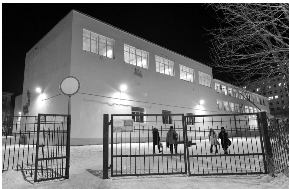
На территории школы №12 стало светлее.