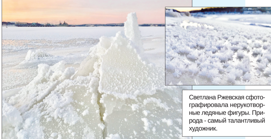
Светлана Ржевская сфотографировала нерукотворные ледяные фигуры. Природа - самый талантливый художник.