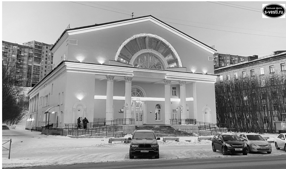
Здание ЦДМ постройки 50-х годов прошлого века приобрело новый облик благодаря современным технологиям.