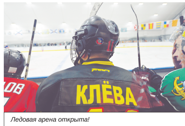
Ледовая арена открыта!