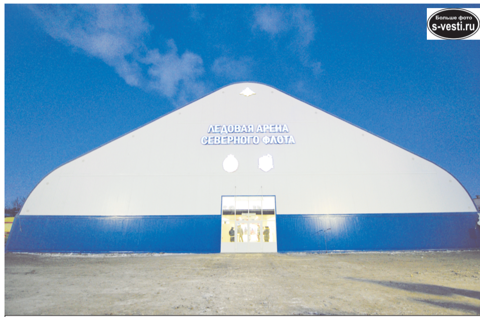
Яркий и внушительный фасад Ледового спорткомплекса вызывает интерес у жителей города.