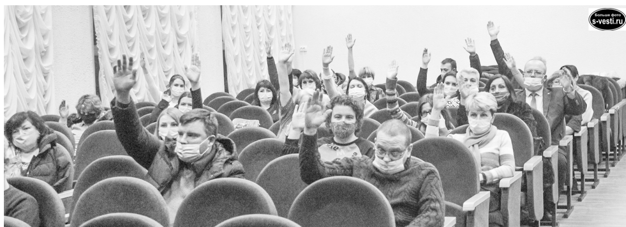
Подавляющее большинство североморцев, пришедших на публичные слушания, высказались за реализацию проекта благоустройства сквера, расположенного у храма на ул.Советской.