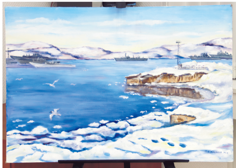
Лидия Кошкина, «Зимний пейзаж».