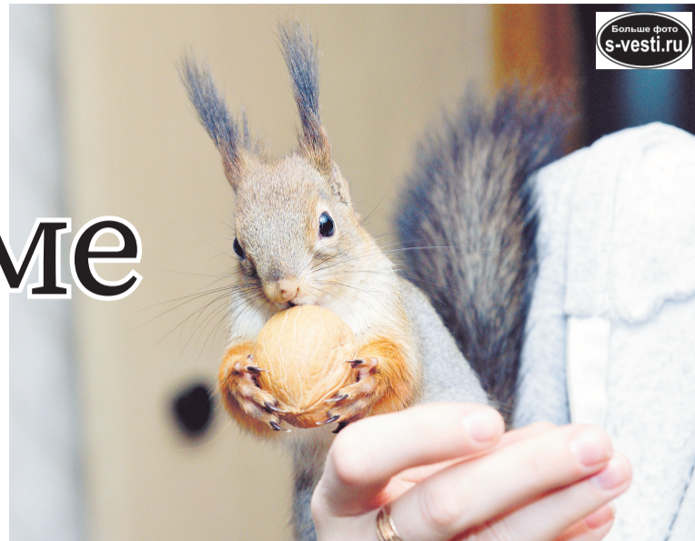
Белки любят грецкие орехи, но баловать этим лакомством грызунов часто нельзя из-за высокого содержания жиров.

разнообразен. Основа, конечно, орехи: фундук, кедровые, еловые. Правда, тот же грецкий из-за высокого содержания жиров – по ореху в неделю.