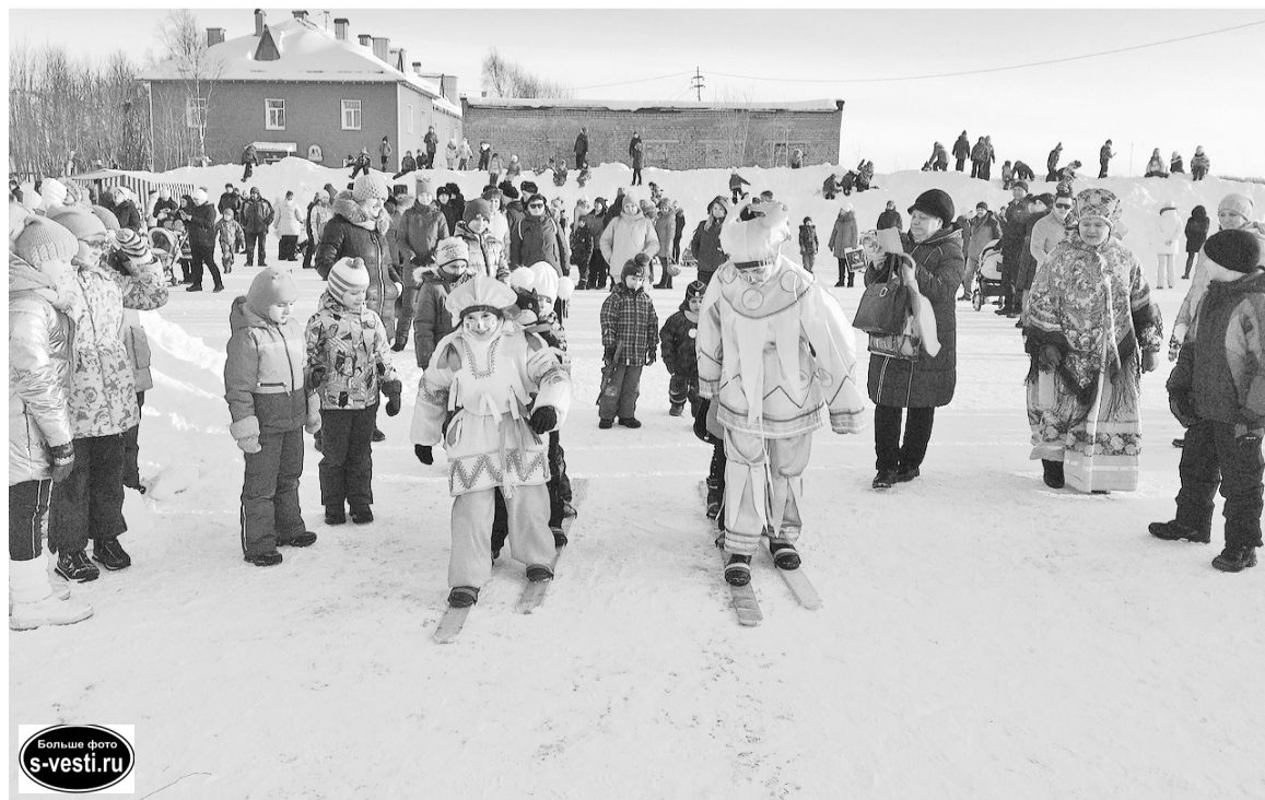
Народное гуляние «Широкая моя Масленица».

Л.П.ПИКУЛИНА, методист 1 категории МБУК ДКсд.