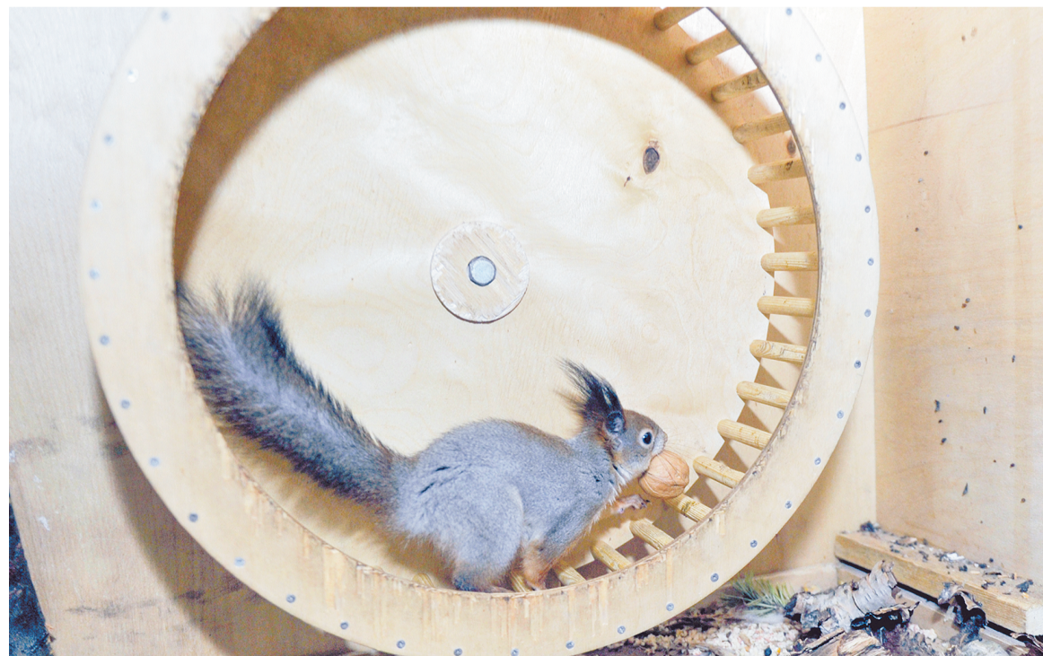
В природе белки очень много и быстро двигаются. Компенсировать это в неволе помогает бег в колесе.