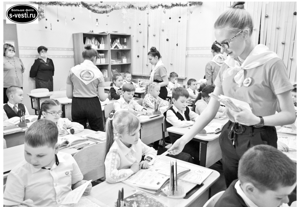
Ребята из 1 «А» класса первыми получили из рук волонтеров светоотражающие браслеты.