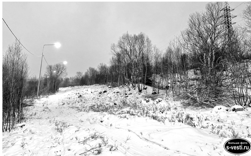
Пока снега совсем мало, сложно представить, что здесь проходит лыжня. Североморцы ждут снегопадов.

Освещение, как сообщил директор Городского центра