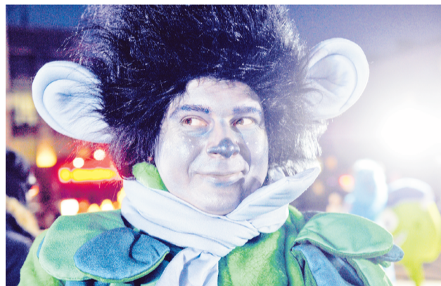
Даже грустный тролль Цветан к концу представления проникся атмосферой праздника.

Новогоднее настроение создавали артисты Центра досуга молодежи. Хиханька и Хаханька, Дед Мороз и Снегурочка, веселые тролли и другие сказочные персонажи шутили, смешили, танцевали и пели — все на радость североморцам. Ну и, конечно, финалом праздника стало зажжение огней на главной ёлке.