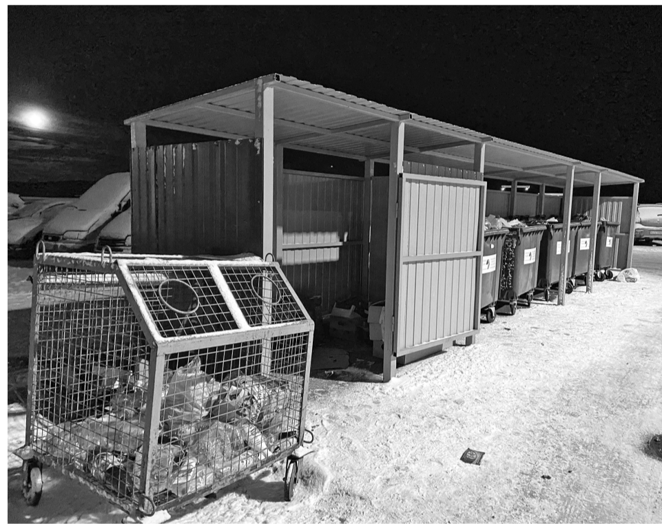
На прошлой неделе контейнеры-сетки были установлены во всех частях города. Североморцы постепенно приучаются к разделному сбору мусора.

Илья ВЛАДИМИРСКИЙ.