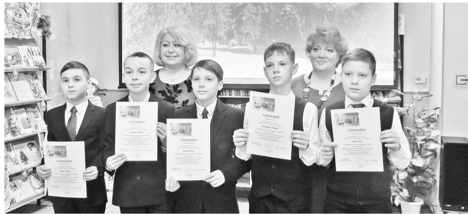
Рубцовские чтения в Центральной детской библиотеке.