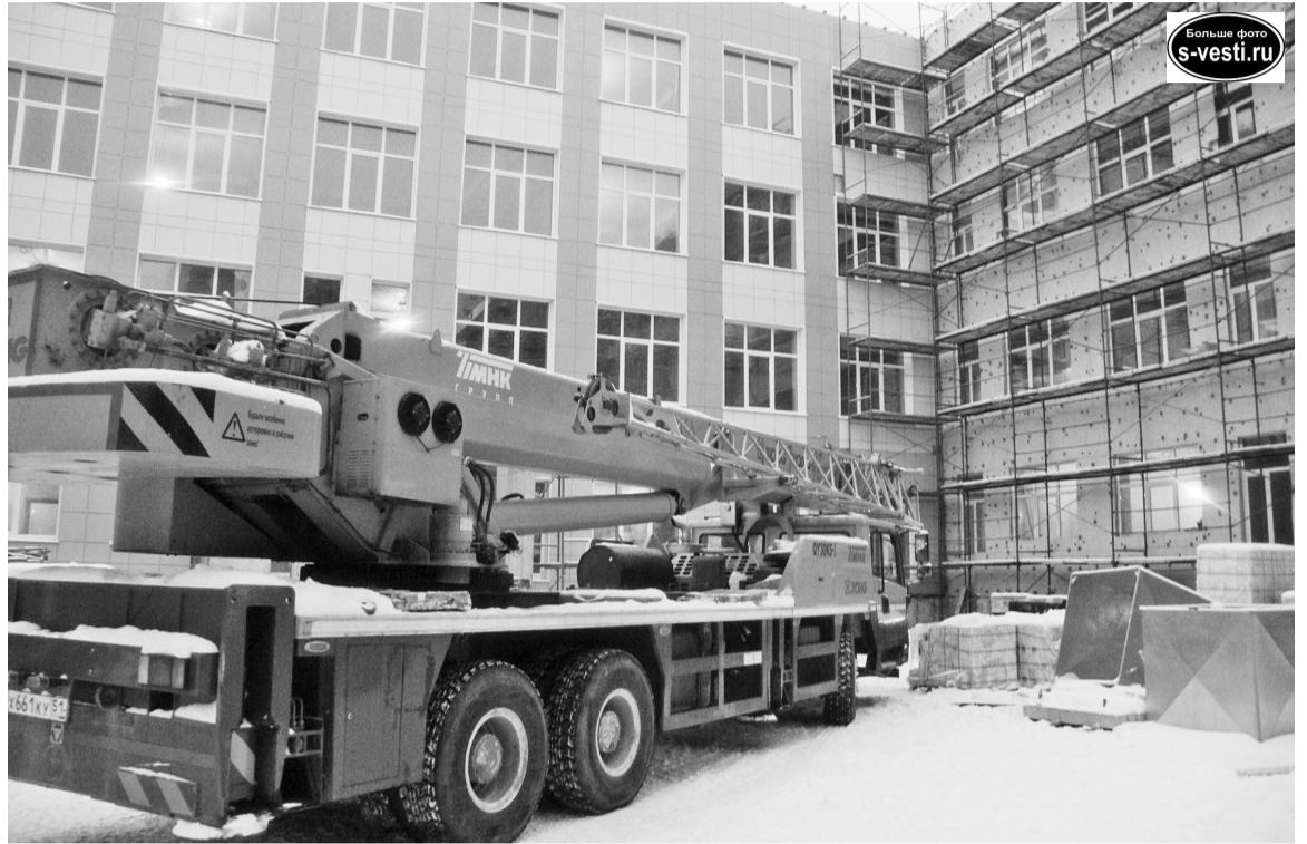
Подрядная организация планирует к новому году на 80% завершить облицовку фасадов новой школы.

– В новой школе будут оборудованы профильные классы, планируем организовать цифровые лаборатории по химии, физике,