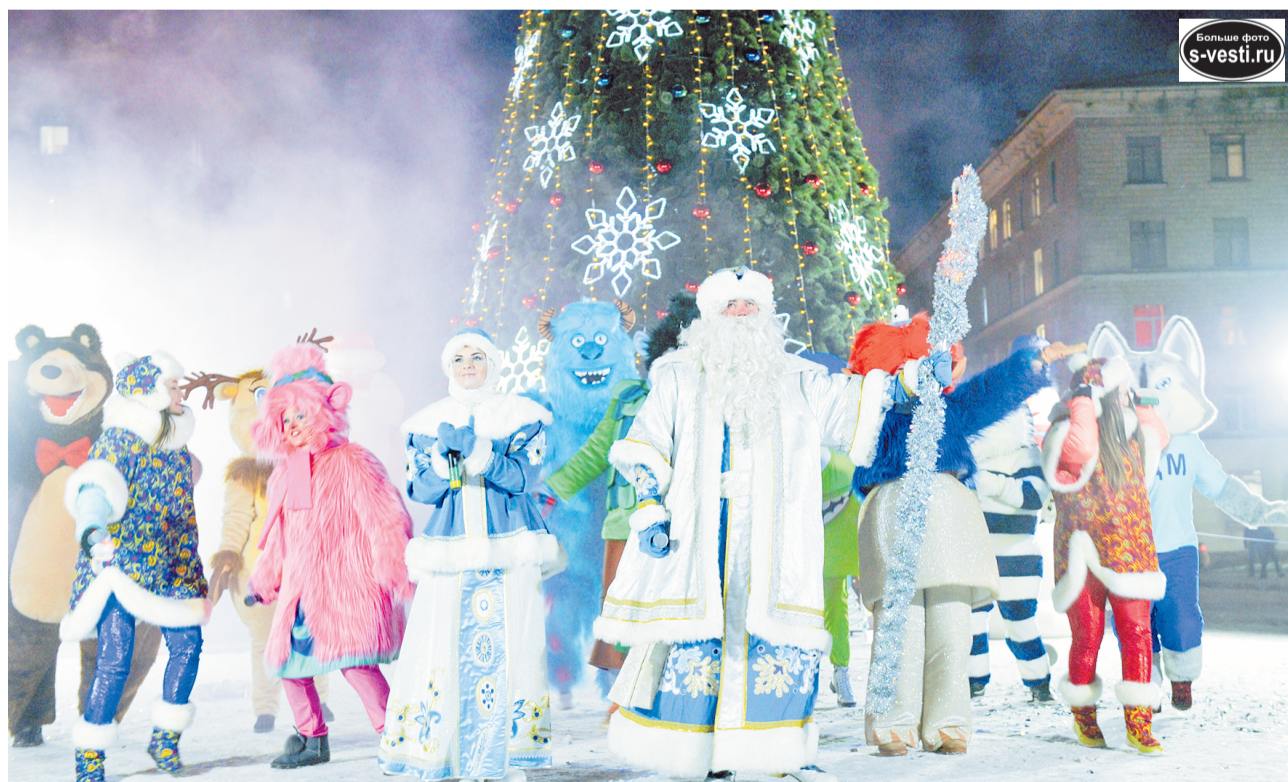
Никакой коронавирус не отнимет у североморцев Новый год. Огни на главной городской ёлке зажжены. Обратный отсчет пошел.