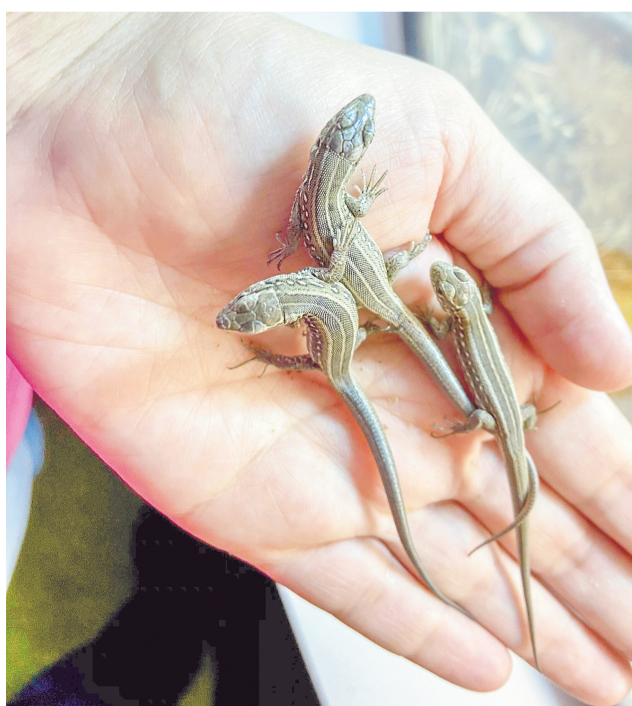
Малыши прыткой ящерицы.