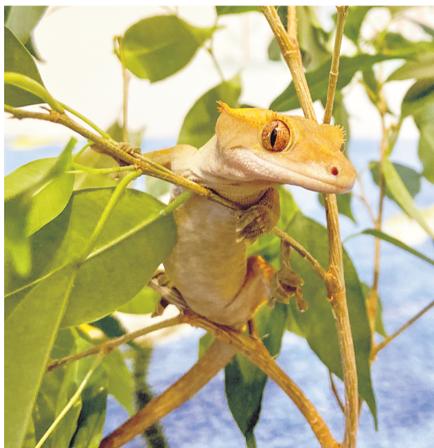
Реснитчатый геккон бананоед - улыбка.