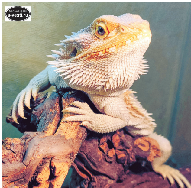
Бородатая агама страшно красивая!