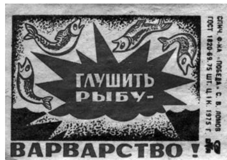
В 1975 году о правилах рыболовства напоминали даже спичечные коробки.

Обращаем внимание, что на территории Карелии возбраняется производить вылов молоди атлантического лосося (семги), кумжи (форели) и палии. Рыбаки не вправе использовать орудия