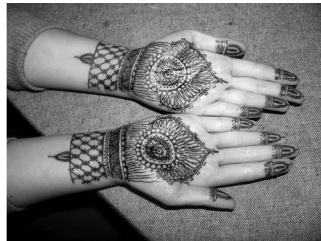
Пока мастер рисует мехенди, возникает проблема: как бы не засмеяться, потому что очень щекотно.

Сегодня интерес к Востоку очень вырос. Одежда в стиле этно, аутентичные и привезенные из Индии украшения – все это пользуется популярностью и действительно выглядит очень привлекательно. Мехенди, которое известно сейчас как временные татуировки и относится к боди-арту, стало еще одной изюминкой Востока, полюбившейся, в том числе, и северным модницам. А раз уж речь зашла о тату, поясняем: мехенди абсолютно безопасно, так как не предполагает травмирования кожного покрова. Кружевные рисунки наносят разведенной пастой хны с добавлением эфирных масел. Раньше при этом использовали кисточки. Сегодня в крупных городах хна продается разных цветов в удобных тюбиках с тонким носиком, которым рисовать намного удобнее. В любом случае рука мастера должна быть твердой, потому что эту краску в случае огрешности смыть будет проблематично. Перед нанесени-