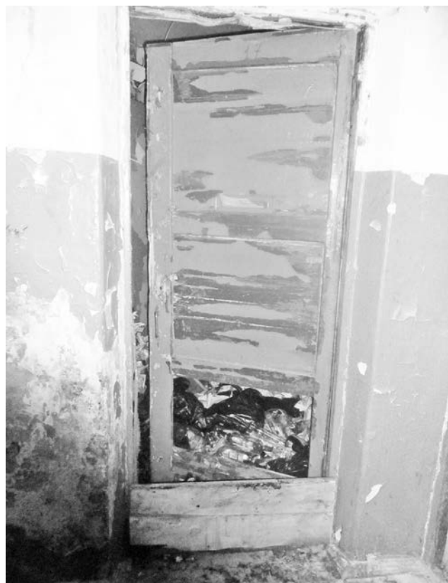
Если ваш подъезд тоже инсталляция на тему «Люди - свиньи!», присылайте фото в редакцию «СВ».

Если бы объявили конкурс на звание самого грязного и зловонного подъезда или жилища, то нижеописанная квартира сразу бы взяла Гран-при. Правда, конкурсной комиссии для оценки данного подъезда и квартиры пришлось бы запастись прищепками на нос... Знала бы заранее – точно взяла бы с собой такую, никогда не думала, что потом в транспорте буду радоваться таким «ароматам», как запах бензина.