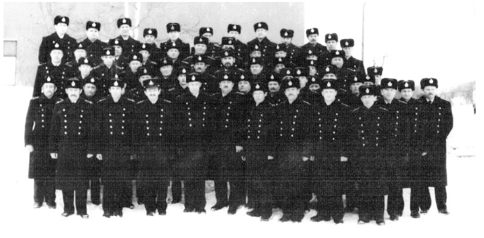
Управление 987 МРАП, начало 90-х.

Уровень своего мастерства летный и технический состав полка с честью подтверждал в ходе инспекторских проверок Министерства