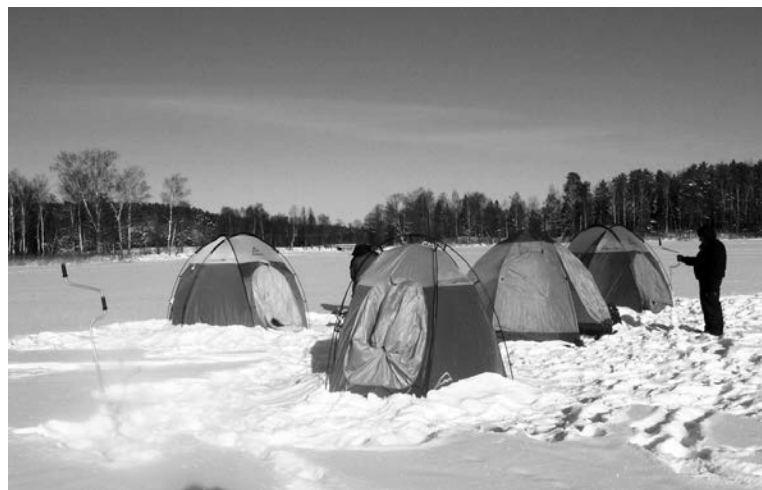
Палатка для подледного лова должна быть компактной, несложной в сборке и непродуваемой.

Сберечь тепло – одна из основных задач вашего лесного дома. Лучше, если палатка будет состоять из двух частей: внутренней и внешней. Внешняя ставится на каркасе из фибerglassа или алюминия, внутренняя – как бы подвешивается внутри внешней. Воздушная прослойка удержит тепло, и от разницы температур ваше жилище не отсыреет. Если боитесь простудиться, то в особо морозные ночи можно по старинке под