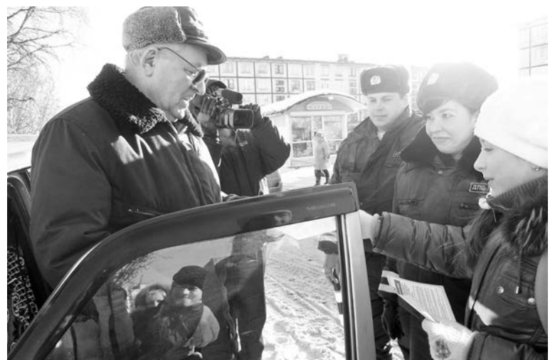
Даже водители с опытом прислушивались к наказам юных инспекторов.