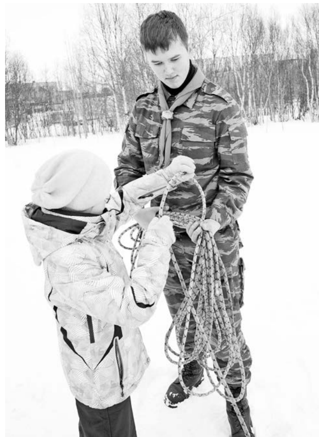
После прохождения веревочного курса скауты сумеют развязать любой узел.