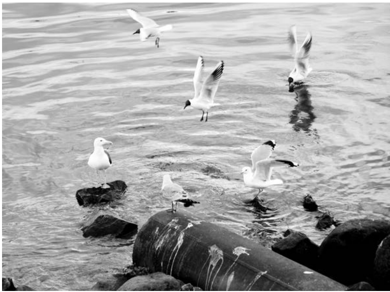
На территории ЗАТО одиннадцать выпусков сточных вод. И только один оборудован очистными сооружениями.

Ирина ПАЛАМАРЧУК.