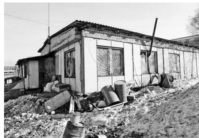
Та самая горе-ферма, на которой погибли животные.

Заместитель губернатора Олег Тигунов 6 апреля провел совещание с главой муниципального образования