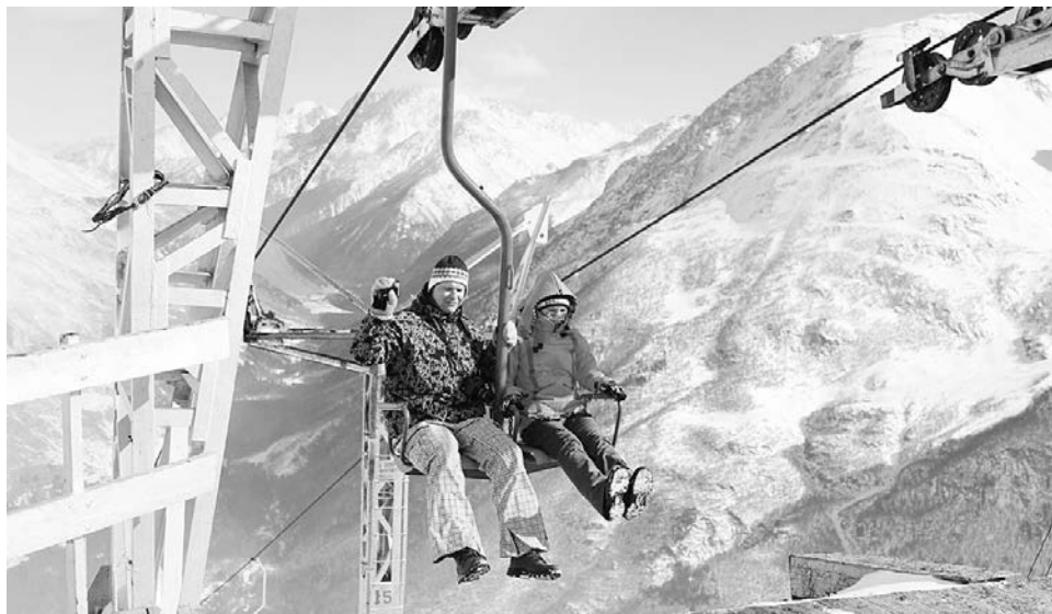
Одни на канатке считают минуты до подъема, другие наслаждаются ощущением полета.