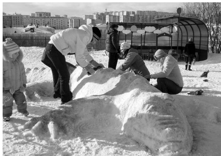
Родители малышей из группы «Сказка» д/с №47 от ребят не отстают – с удовольствием предаются зимним забавам.