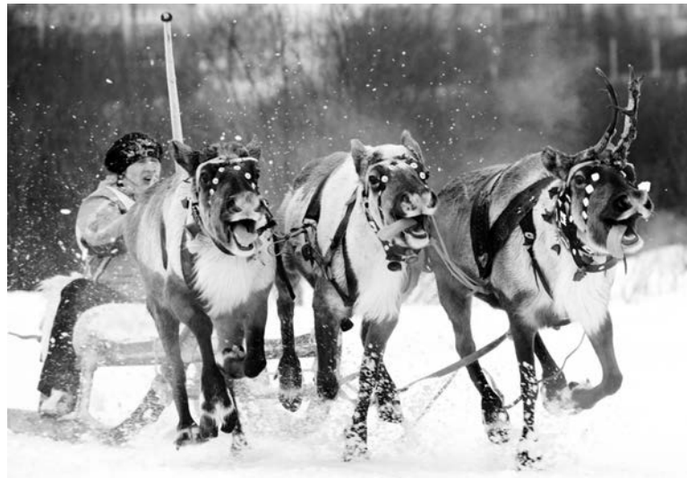
Кроме марафона, в заключительный день Праздника Севера прошли соревнования оленеводов. Спортсмены состязались в управлении упряжками, буксировке лыжника за оленем, метании аркана на хорей.