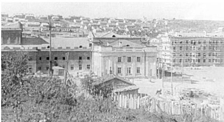
Строительство Дома офицеров флота. Начало 50-х годов.