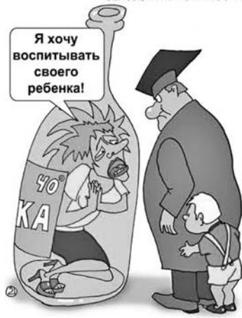
Некоторые горе-мамочки слишком поздно осознают потерю.