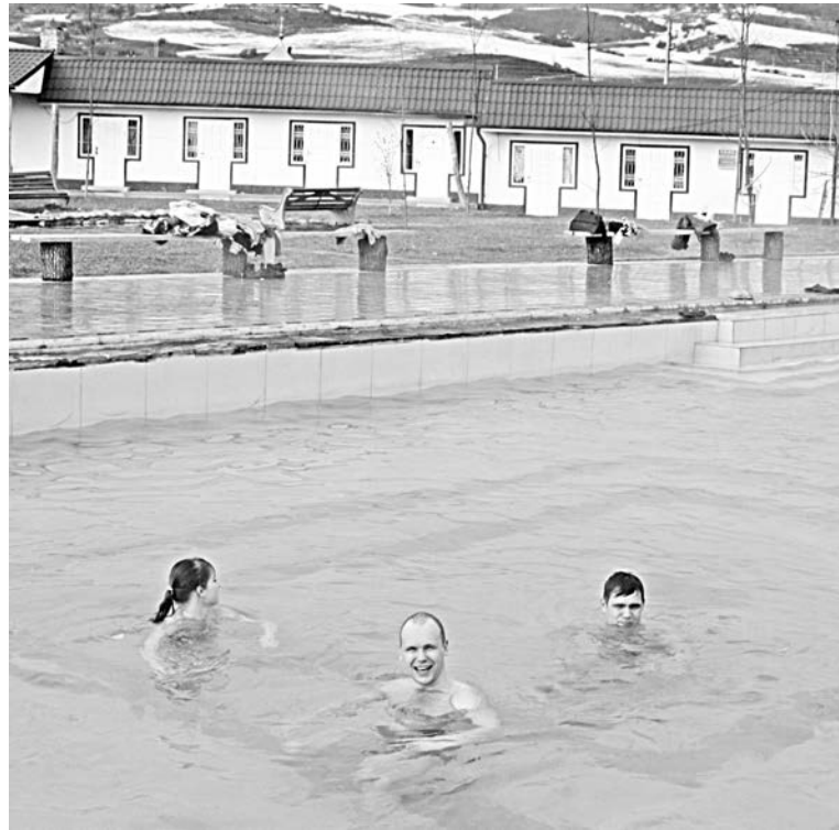
На склонах гор снег - у подножия горячий источник.

Записала Ирина ПАЛАМАРЧУК.