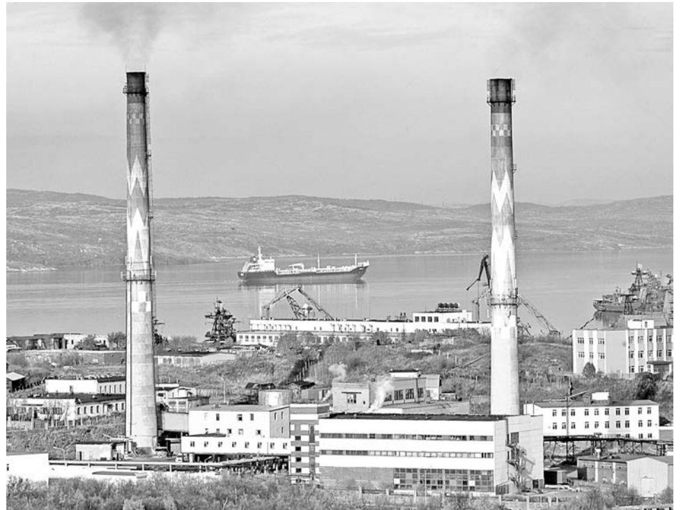
В Северной Европе декоративно покрашенные трубы - норма. В России - исключение из правил.

- Помню, я уезжал в отпуск, когда начинались работы на трубах. Их тогда загрунтовали, покрасили серо-голубой краской, - с улыбкой рассказывает ветеран предприятия с 24-летним стажем начальник 2 района 46 ТЭЦ