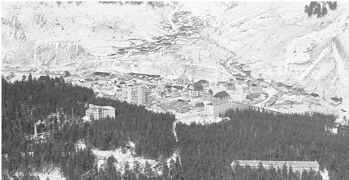
Терскол - самый высокогорный в Баксанском ущелье поселок. Он расположился на высоте 2133 метра.

Для подъема на самый верх трассы предусмотрены канатные дороги: в Приэльбрусье – маятниковая канатная дорога, далее – канатно-кресельная. В 2006 и 2009 годах в дополнение были введены в строй гондольные дороги 1 и 2 очереди – до 3000 и 3500 метров. Это так называемые французенки. До их открытия своей очереди на посадку приходилось ждать до полутора часов. Теперь – пару минут. Одна гондola вмещает до