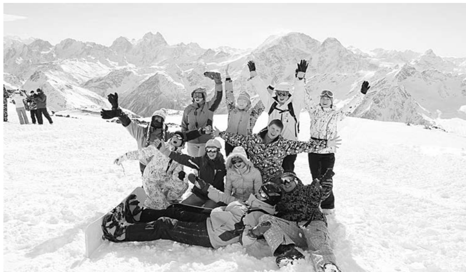
Прекрасней гор могут быть только горы! Фото с видом на вершины - обязательный ритуал.