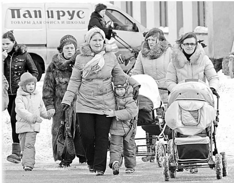
Многие мамочки вынуждены брать малышей с собой в присутственные места: дома их оставить не с кем, в детский сад не попасть.

Во всех вариантах ключевой момент – цена вопроса. Няни по объявлению берут в среднем 70 рублей в час (в праздники цена может и подрасти), посещение частного центра обойдется от 150 до 750 рублей в день. Родительская плата в муниципальном детском саду Североморска – 1470 руб. в ме-