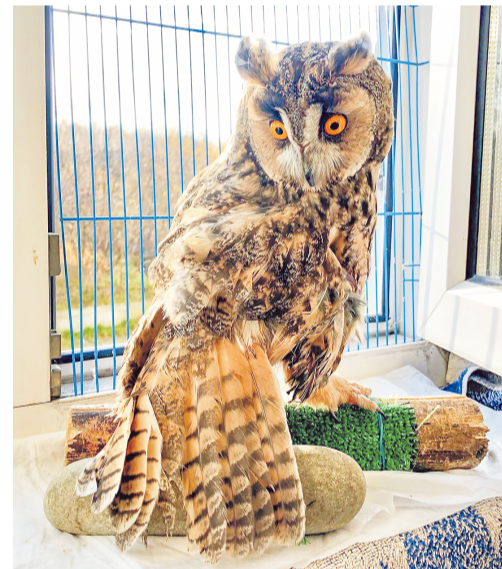
Ушастая сова по кличке Ушан.

шамы всегда наблюдают их родители, они их на земле кормят и защищают. Таких птенцов не надо трогать, если только они не на тропинке или дороге, тогда отнесите их на пару метров в сторону. Не беспокойтесь, у птиц нюха нет – и взрослым все равно, чем пахнет их птенец, они его не бросят.