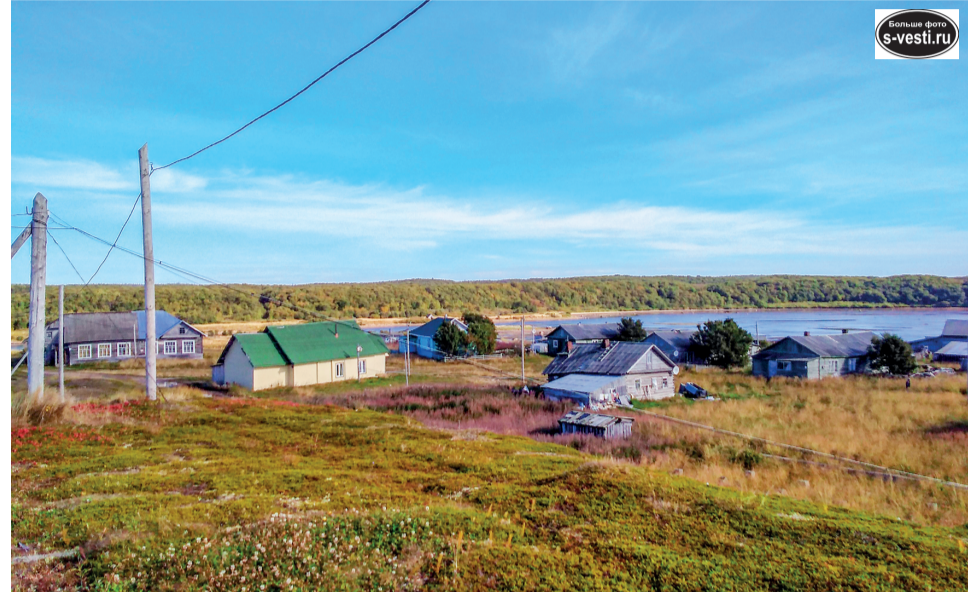
Село Чапома на беломорском побережье.

В деревне все гораздо веселее! Для начала надо нагреть воду. Поэтому стирку и устраи-