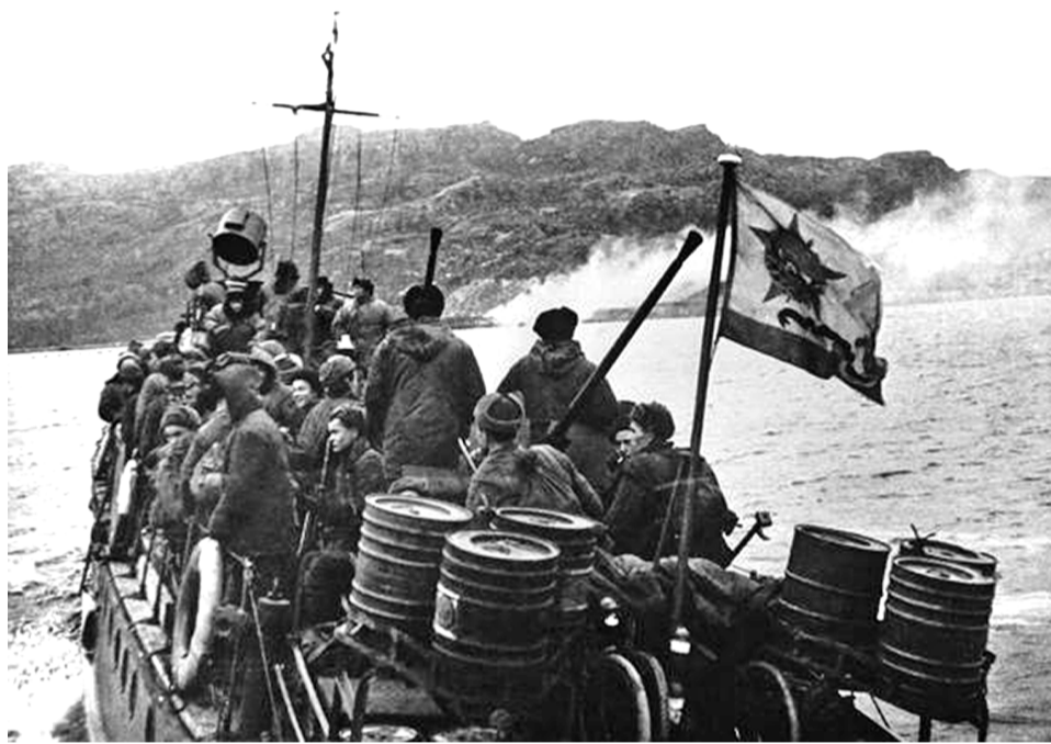
Высадка десанта. Октябрь 1944 года.

свою роль в недалеком общем крахе гитлеризма.