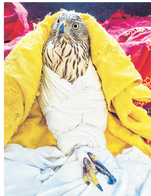
Только спеленав, ястребице можно провести обработку ран на лапах.

– Не пугайте взрослых птиц и птенцов, у последних есть пух на голове, на гузке, на лапках, и, если они ходят по земле, это не значит, что они выпали из гнезда, – поясняет Наталья. – Это очередной этап взросления – они еще не умеют летать, но уже не сидят в гнезде, за малы-