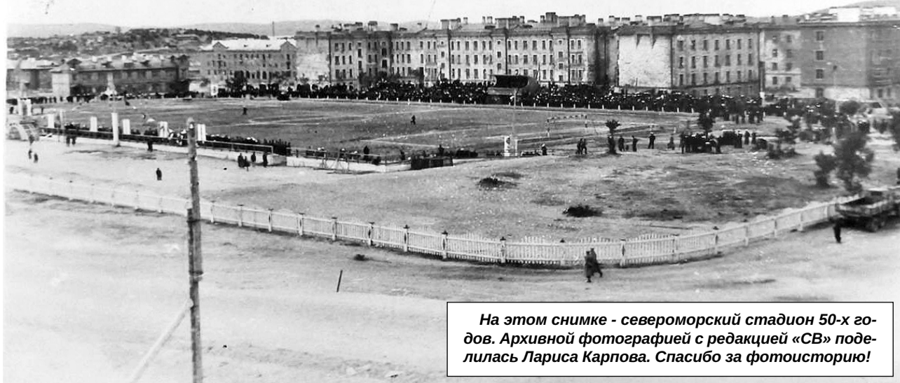
На этом снимке - североморский стадион 50-х годов. Архивной фотографией с редакцией «СВ» поделилась Лариса Карпова. Спасибо за фотосторию!

Присылайте старые фотографии на нашу электронную почту mail@s-vesti.ru или загружайте в альбом «Североморску – 70» в нашей группе «ВКонтакте» ( vk.com/album-12595762_275260382 ). Снимки нужно сопроводить информацией о дате съемки (хотя бы примерной) и о том, что изображено в кадре.