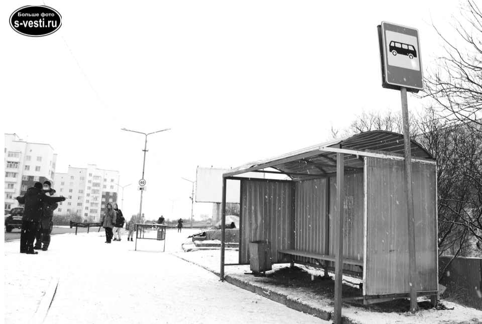
Уже по расположению остановки - в стороне от места, где стоял прежний павильон, - можно понять, что мера временная.