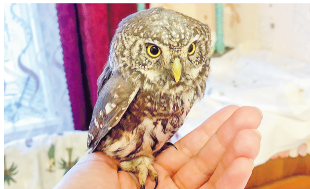
Один из подопечных - воробьиный сычик.

ке происходит весной в начале лета и в конце лета-осенью, когда идет миграция, а также после гнездования, когда у взрослой пары или птенцов возникают болезни, связанные с падением иммунитета.