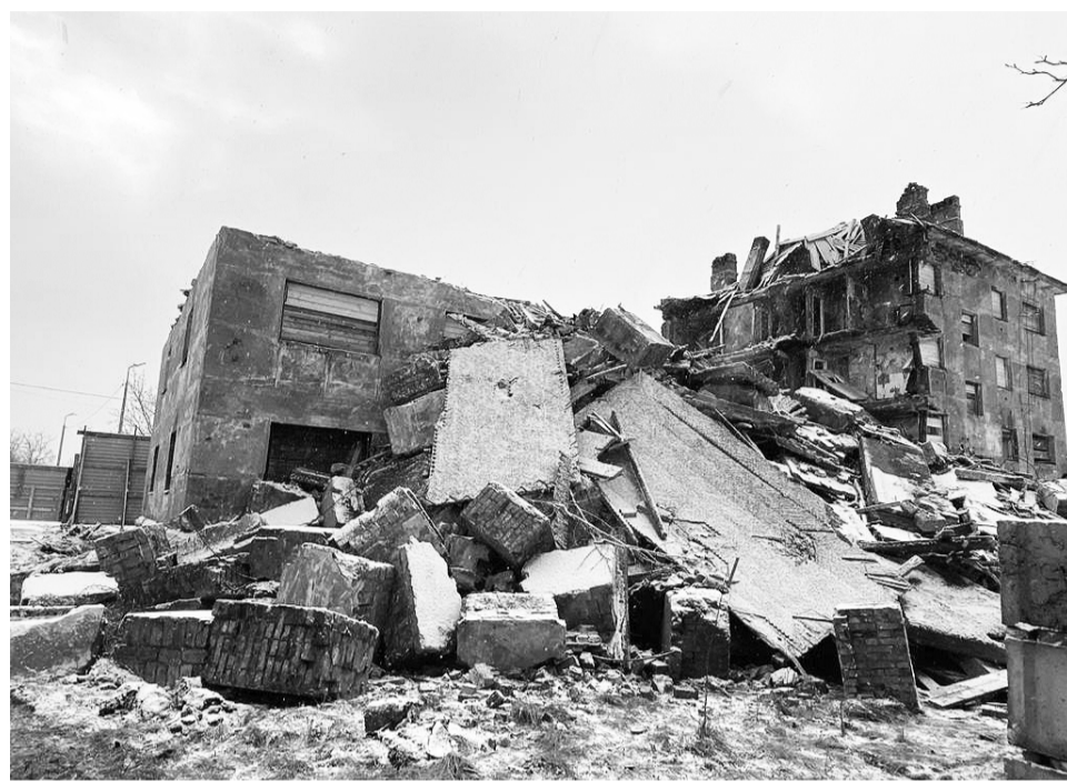
Помимо сноса здания, контрактом предусмотрены вывоз строительного мусора и восстановление почвенно-растительного слоя.