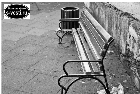
Как ни печально, но это - часть новой детской площадки на ул.Адм.Сизова.