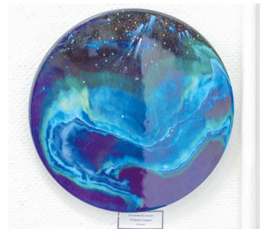
«Сияние Севера» (резин-арт).