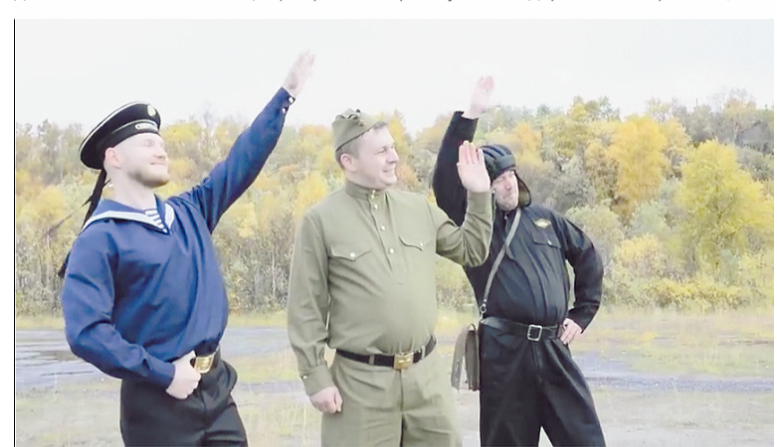
Вторая часть онлайн журнала 4 940 просмотров

формации вы найдете в группе «Библиографы в теме» ( vk.com/club187439176 ). Громкое название своего сообщества библиографы оправдывают с лихвой. Подробнее о виртуальной жизни североморских библиотек – на sevcsbs.ru и в группе ЦБС: vk.com/club159086889 .