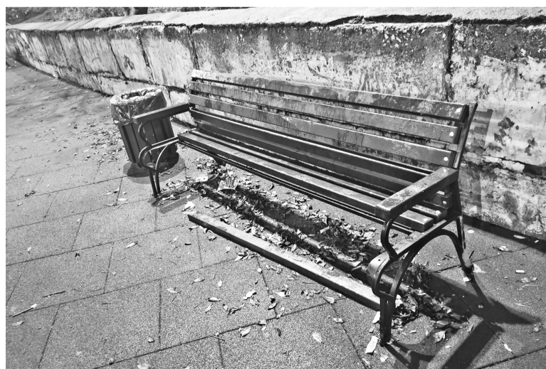
Сила есть – ума не надо. Скамейка на детской площадке на ул. Сизова не прожила и нескольких месяцев.

Иванна МИКИТЕНКО.