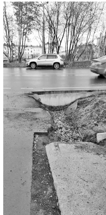
Ливневку на ул.Душенова, 10, отремонтируют в ближайшее время.

– Мы планируем, что в Сафоново и Сафоново-1, а также на оставшихся улицах Североморска новые контейнеры начнут эксплуатироваться после 1 ноября. Закупка необходимого оборудования состоялась, идет процесс доставки. Параллельно мы занимаемся дооборудованием необходимых 58 контейнерных площадок, – подробно пояснил глава ЗАТО Североморск. – К сожалению, обследование контейнерных площадок в Североморске-3 и Щукозеро показало, что там баки располагаются на таких площадках, где на сегодняшний день мы не готовы вырывать плиты и где нет возможности сделать скаты. Там надо модернизировать площадки целиком, как мы это делали на ул.Гаджиева и ул.Кирова. Поэтому принято решение, что эти поселки до следующего года остаются с теми баками, которые есть. В качестве компенсации современные площадки нового образца для новых контейнеров в следующем году появ-