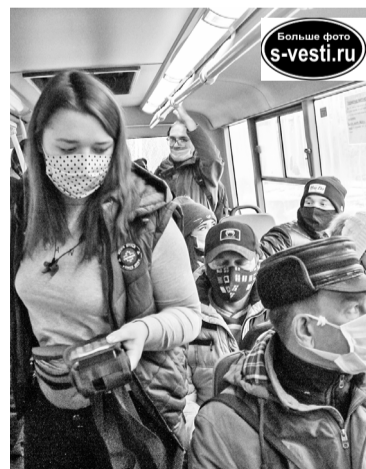
Надевайте маски - берегите здоровье друг друга!

Продолжают болеть школьники. И если на позапрошлой неделе предписания перевода на дистанционное обучение никому не выдавались, то на прошлой – сразу четыре класса в двух школах отправлены на 14 дней на дистант. Необходимые документы направлены также в поликлинику, за детьми будет установлено наблюдение, взяты мазки. Классы откроются только после того, как у всех детей будут отрицательные результаты. Есть определенные надежды на каникулы, во время которых произойдет разобщение детских коллективов.