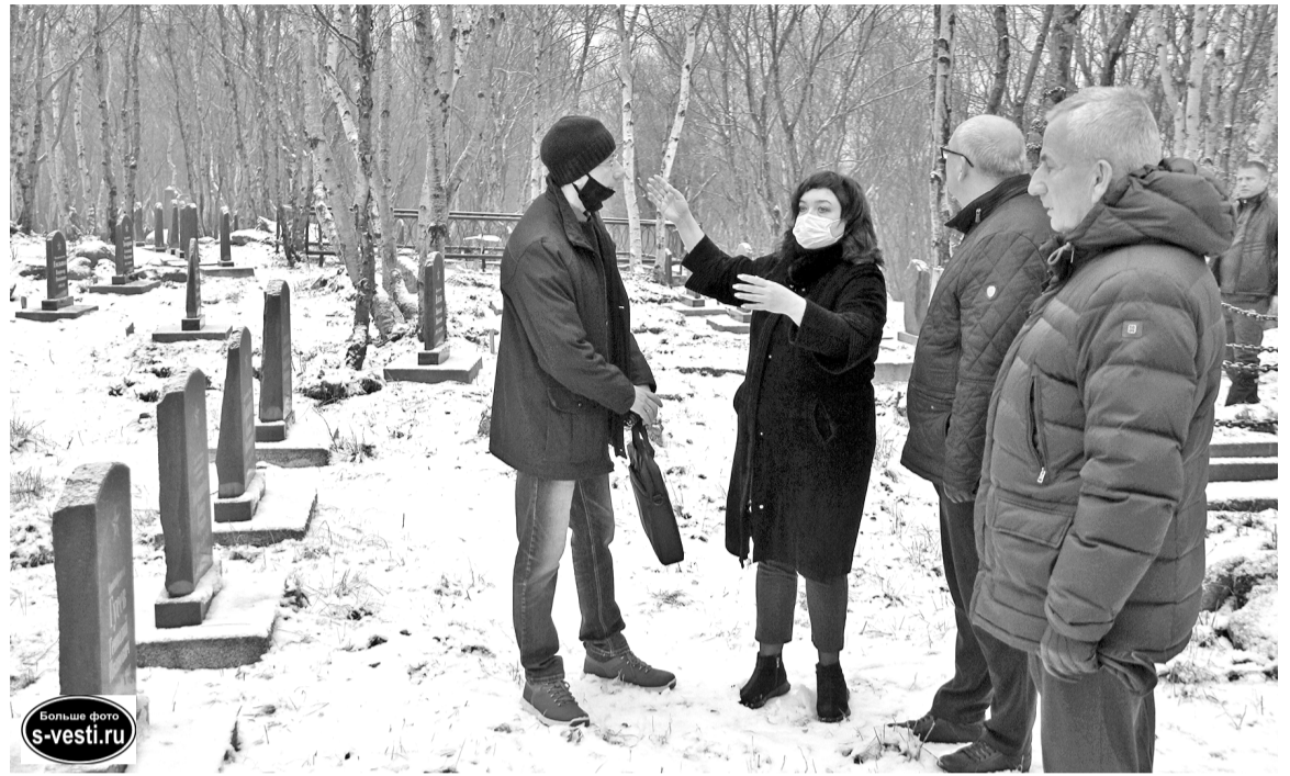
Прежде чем на кладбище закипела работа, неравнодушными людьми было проведено масштабное восстановление архивных данных. Здесь более 500 захоронений.

В Североморске не первый год уделяют внимание содержанию и благоустройству мемориального кладбища, расположенного по ул.Корабельной.