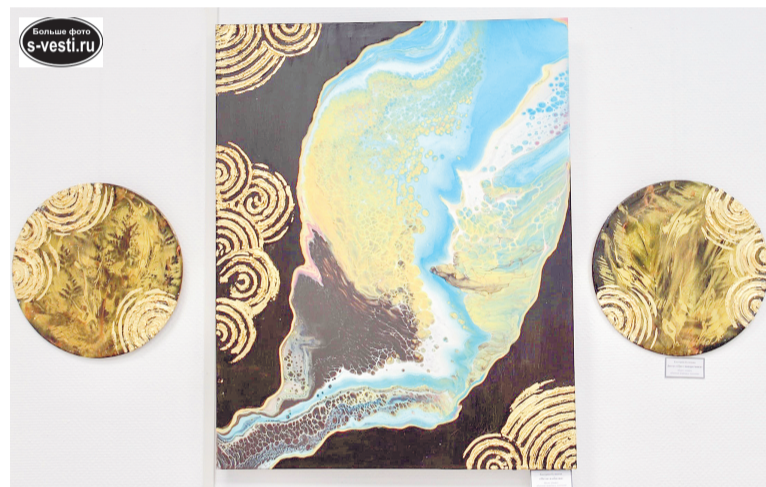
«Поток изобилия» (в центре) и диптих «Цвет папоротника».

Ирина КУЗЬМИНА. Фото автора и из альбома Е. Кузнецовой.