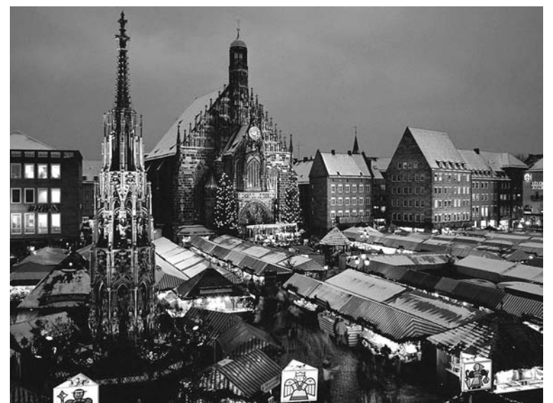
главный город – Нюрнберг – прим. авт.)

Ночь Сильвестра – с 31-го на 1-е – примечательна тем, что это единственное время в году, когда закон разрешает пользоваться пиротехникой без специальной лицензии. В результате во всех уголках города рвутся петарды и польхают фейерверки. Городские власти салют не устраивают, поэтому расщепленное красками небо над Нюрнбергом – целиком заслуга инициативных граждан. Даже слово «петарда» по-немецки звучит как «Silvester Kapoep» - «сильвестрова пушка». Самая удобная для наблюдений точка – средневековая крепость на горе. С крепостного вала и башен превосходно видны яркие вспышки в разных концах франконской столицы (Франкония – историческая область, присоединенная в XIX в. к Баварии, ее