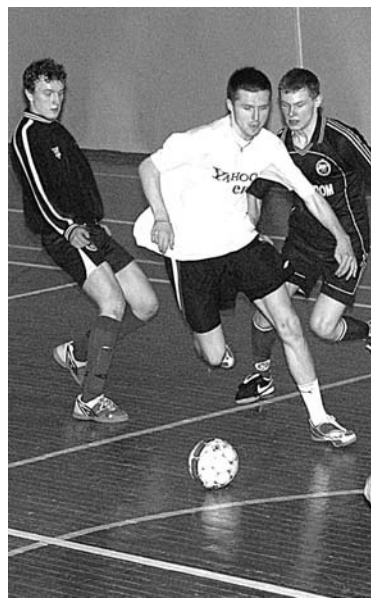
Уступив «Сампдории» в первом матче, в товарищеском «Ветераны» взяли реванш.