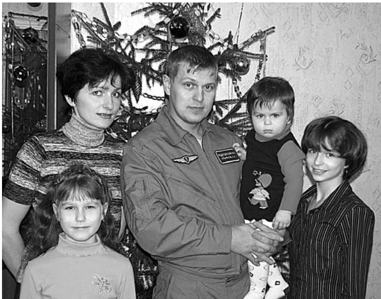
Дружная семья на земле - залог успехов в небе.