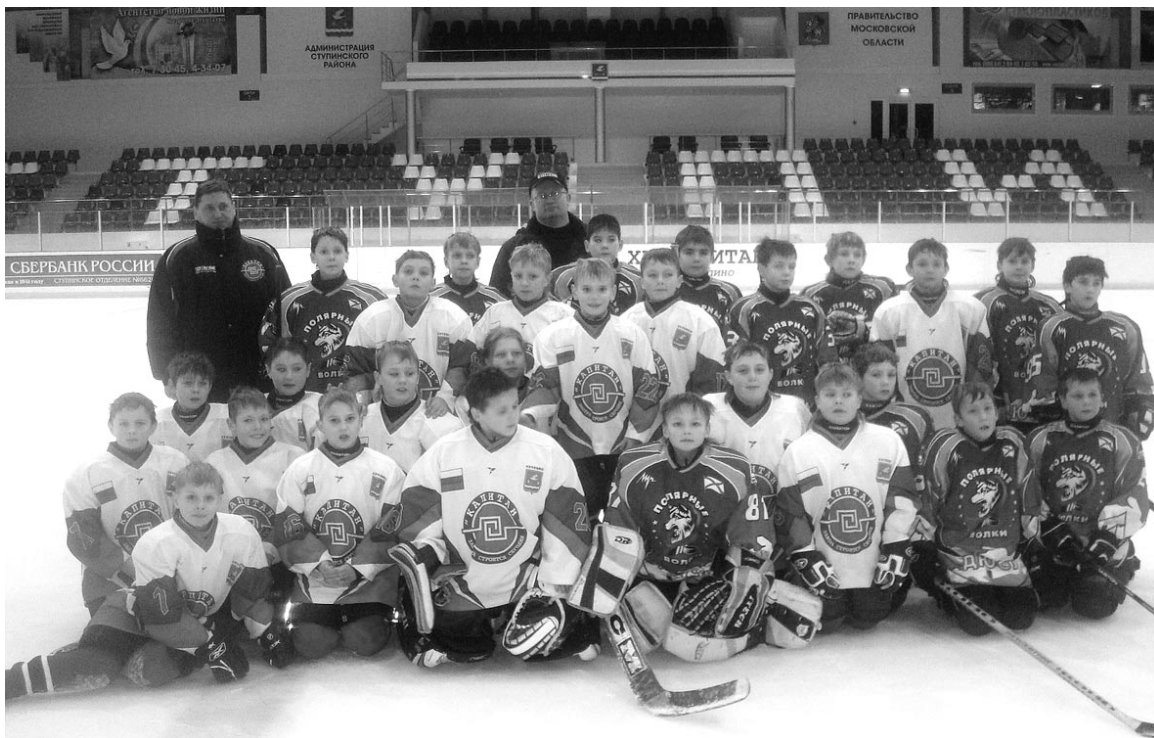
Матч с колпинским «Капитаном» североморцы проиграли, но знакомством с клубом высшей лиги остались довольны.