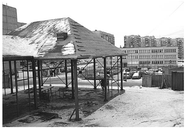
Пока игры детей обходились без серьезных травм. Но не лучше ли подстраховаться?

Сами предприниматели не признают за собой никаких нарушений. В разговоре с одним из них мы узнали, что ООО «Еврострой» практически вынудили покинуть строительный рынок Северноморска. В офисе этой компании, который находится в г.Кола, нам сообщили, что фир-