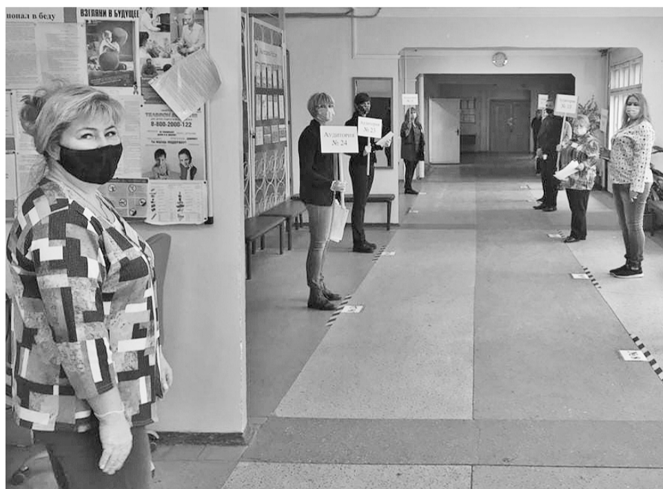
Итоги ЕГЭ будут размещены на информационном портале check.ege.edu.ru .

Подготовила Любовь ЧЕБАНУ.