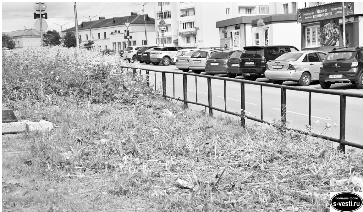
Покос травы и подравнивание кустарников - обычные летние хлопоты коммунальщиков. И на Севере лето должно быть красивым и опрятным.