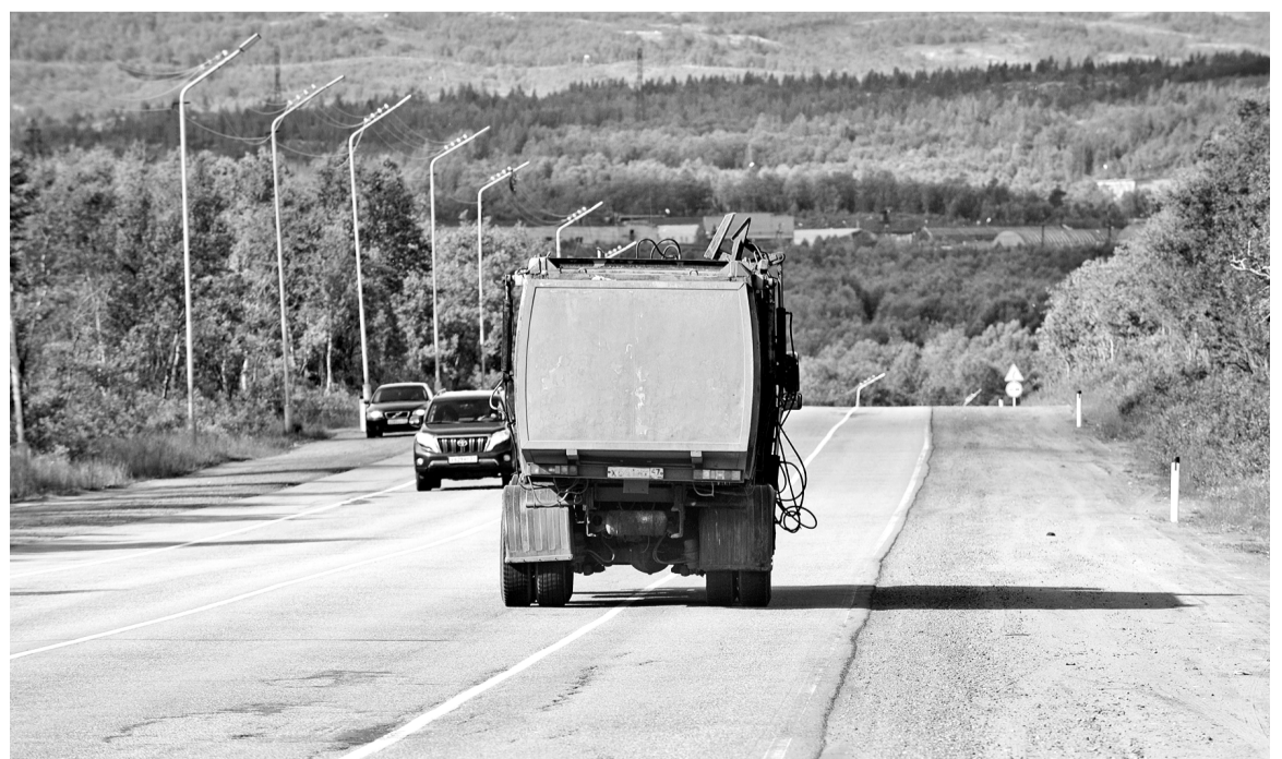
Участок дороги федерального значения протяженностью 13,517 км обслуживает ФКУ Упрдор «Кола».