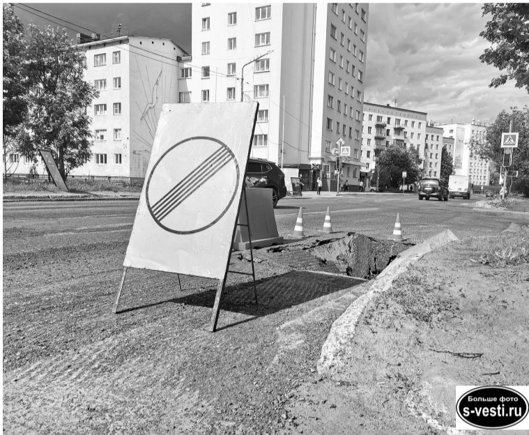
Провал на повороте с ул. Душенова на ул. Головки - результат проводимых работ.