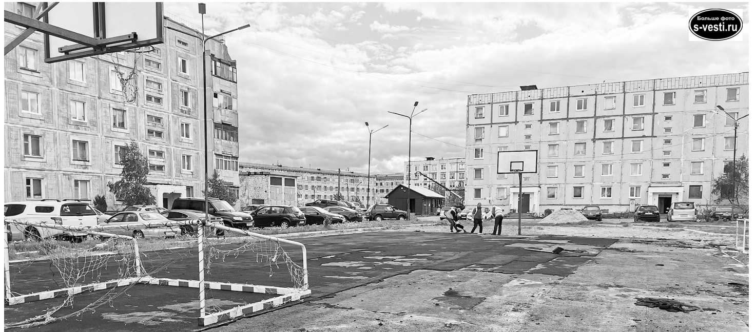
Детский городок, предназначенный для разных возрастов, будет иметь покрытие спортивной площадки. Его размеры составят 800 м 2 (15х25 метров).

Ремонт кровли в этом же доме займется управляющая компания ООО «СЖКХ». К