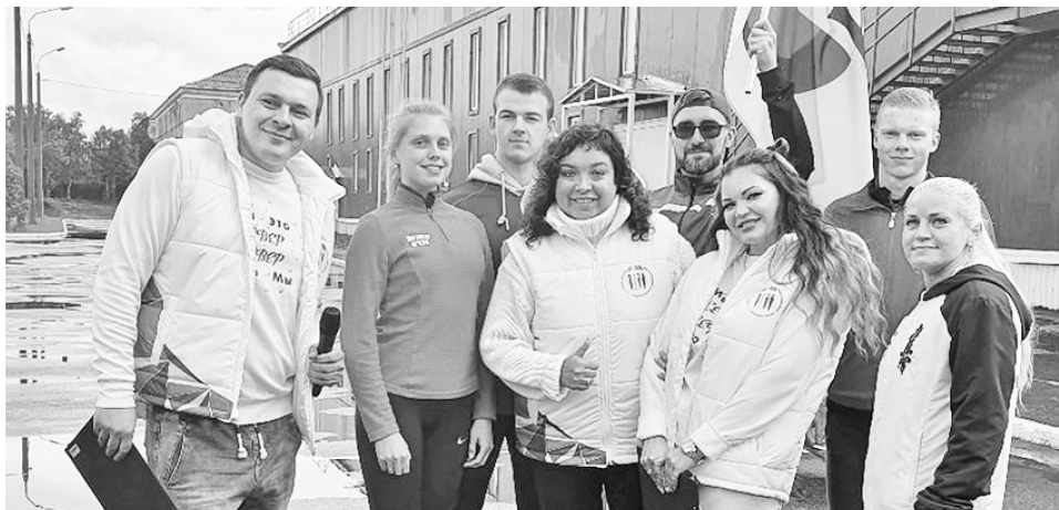
Первая пятерка спортсменов начала свой пробег от СК «Старт» и финишировала у ДК «Строитель».