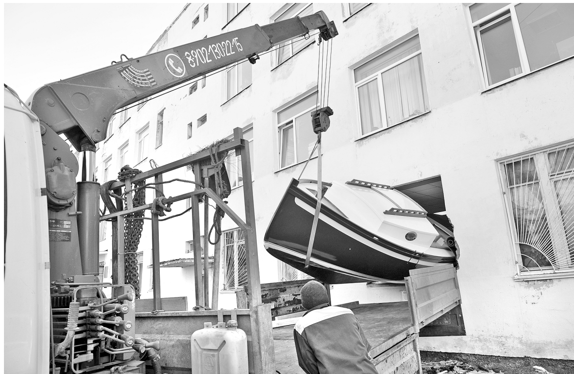
«Конек» покидает временное пристанище в мурманской мастерской через оконный проем.