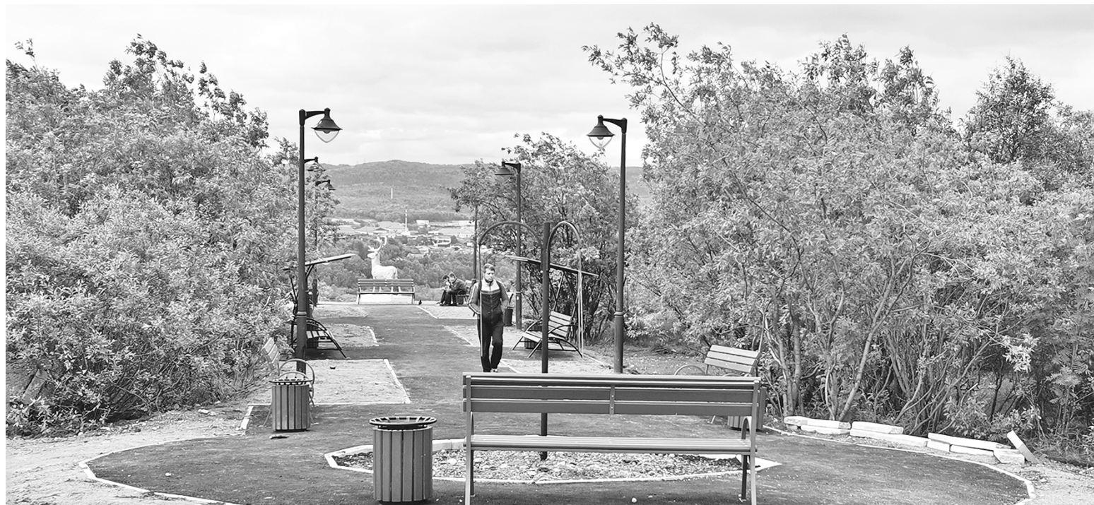
К ремонтно-восстановительным работам на объекте муниципалитет привлек организацию по договору субподряда, с предыдущим подрядчиком - ООО «Строй Плюс» - ведется судебное разбирательство.

31 января этого года порог нового детского ясли-сада в Авиагородке, ставшего новым корпусом д/с №7, перешагнули первые малыши. А уже 20 мая муниципалитет заключил контракт на выполнение строительно-монтажных работ нового детского сада с подрядчиком - компанией «МНК-групп». На возведение отводится 540 дней. Новое дошкольное учреждение на 220 мест на улице Восточной появится к концу 2021 года.