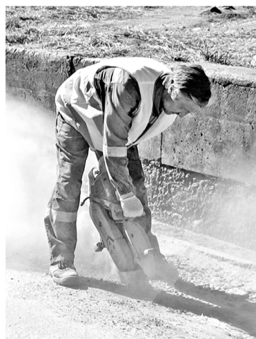
УК «Вертикаль» приступила к ямочному ремонту первой.

Маршрут следования был составлен по обращениям жителей.