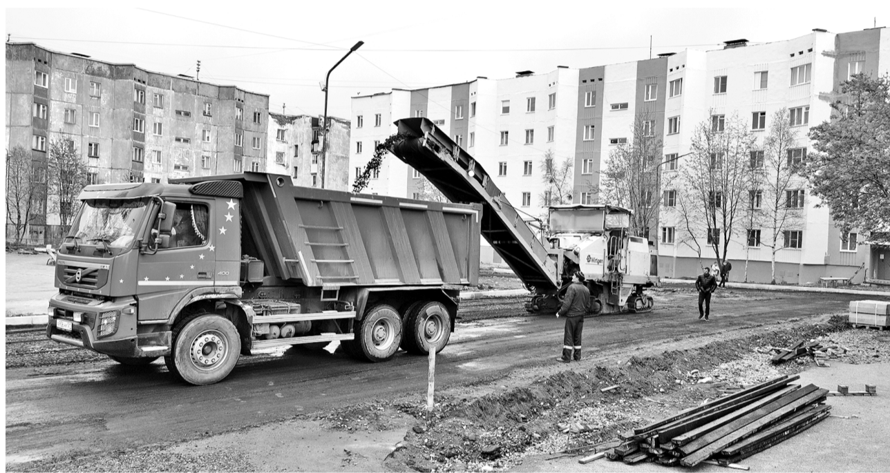
Снятие старого асфальтового покрытия во дворе домов 5-7 на ул.Елькина.

Муниципальный контроль Североморска вновь проверил состояние дворов и общественных территорий города.