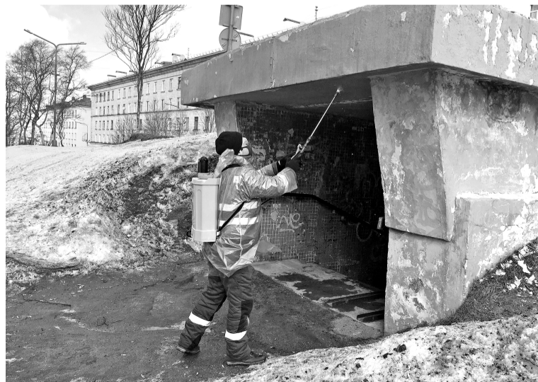
В администрации сообщили, что сейчас ведутся переговоры о привлечении к работе по дезинфекции и сил Минобороны.