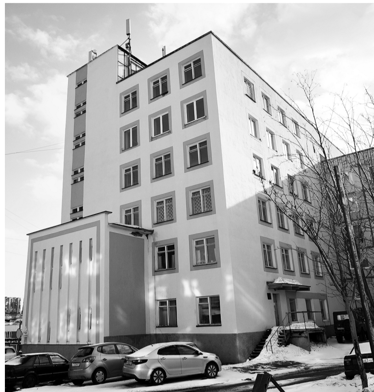
Резервный обсерватор в Североморске оборудован в здании на ул.Фулика, которое не так давно занимала детская поликлиника.

- Как и до начала пандемии, городская поликлиника работает с утра до вечера. Однако принимают врачи амбулаторного звена только пациентов с заболеваниями в острой форме. Также принимают тех, у кого наблюдается обострение хронических заболеваний. Гражданам в возрасте старше 65 лет, людям,