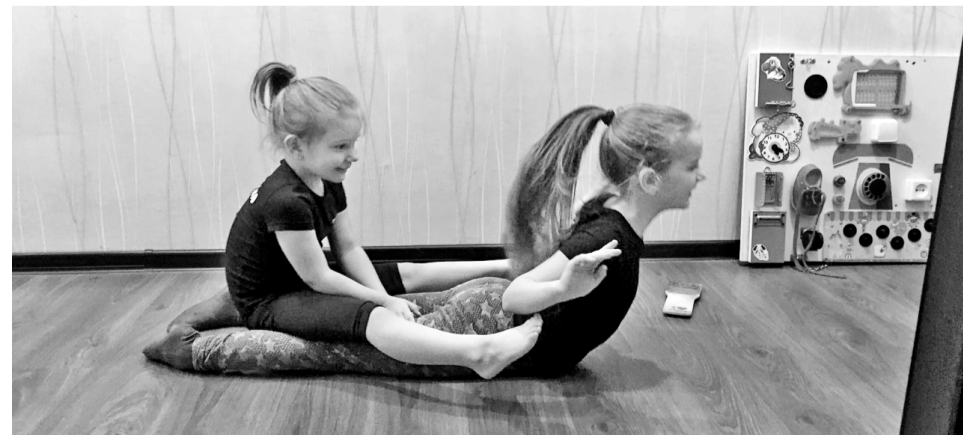
Младшая сестра с удовольствием помогает поддерживать спортивную форму старшей.