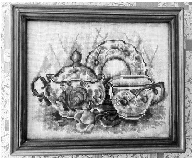
Выставка участников хора «Россия». Самоизоляция - самое время для творчества.

Подготовила Иванна МИКИТЕНКО.