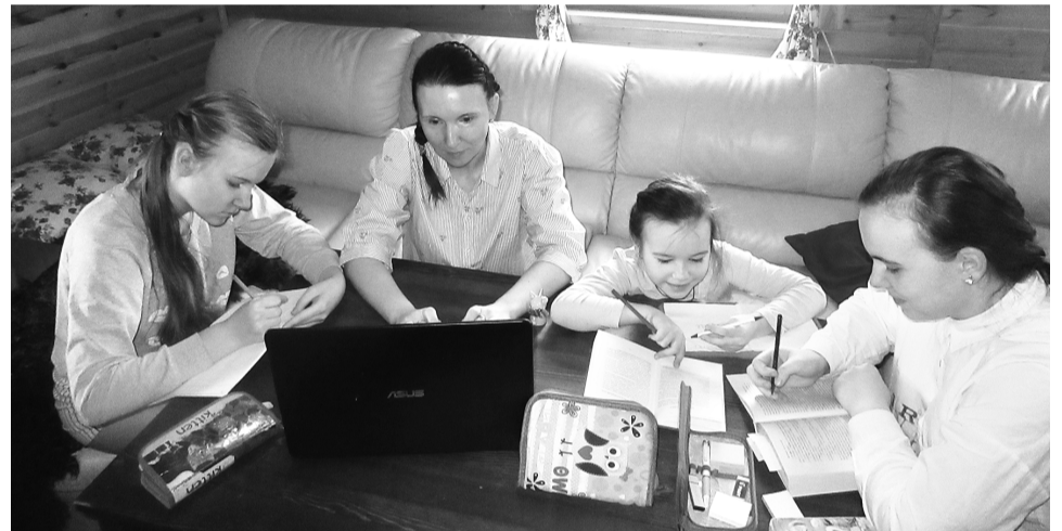
В семье Ефремовых пятеро детей, трое из них - школьники. Девочки стараются распределять время так, чтобы каждая успевала выполнять свои задания.

Любовь ЧЕБАНУ.