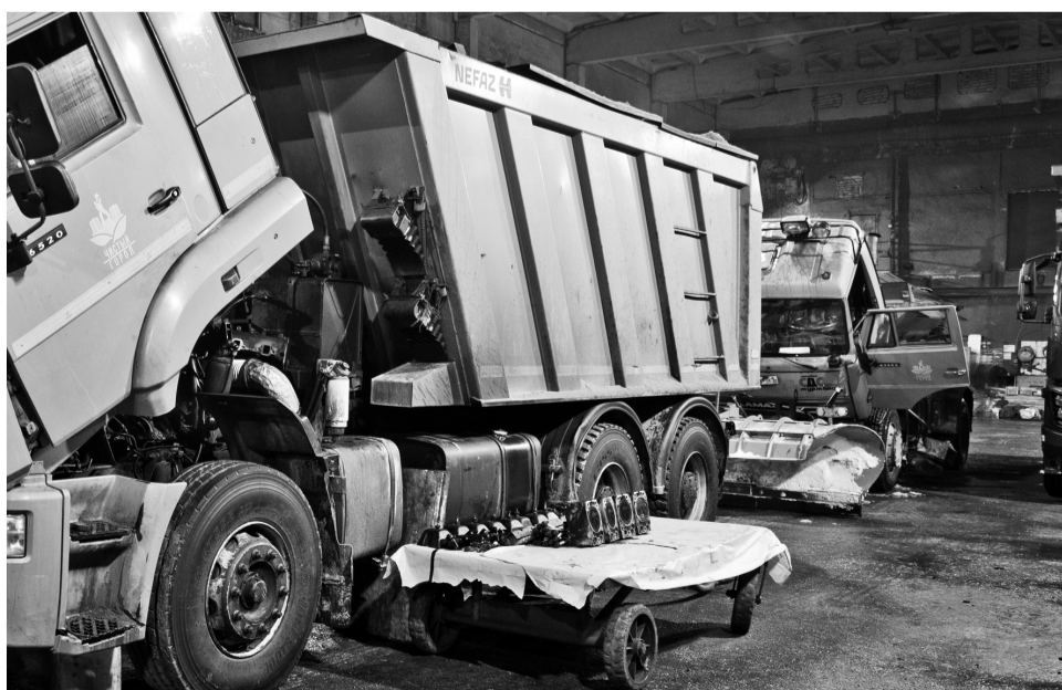
Спят усталые игрушки...