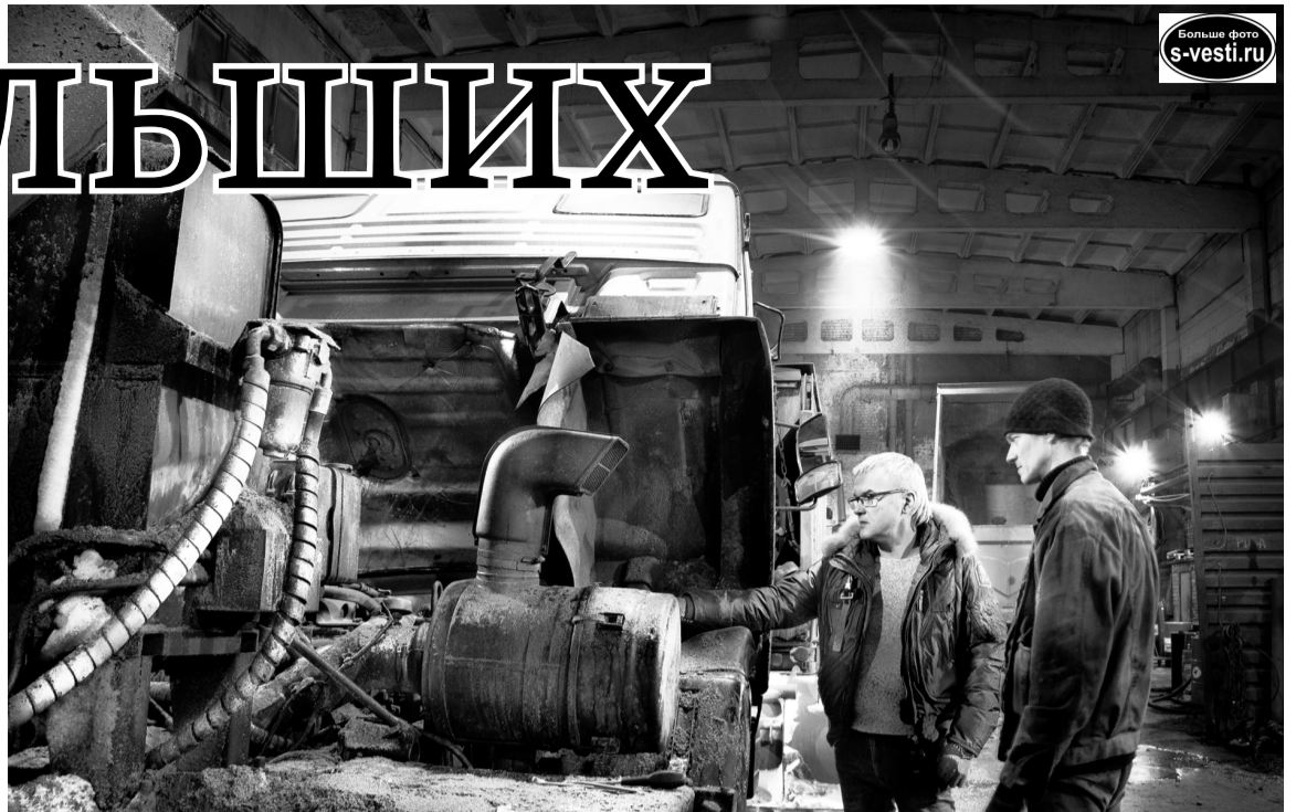
Ремонт комбинированной дорожной машины.

- Это работает так: берем две тонны воды, запас дизеля, авто-