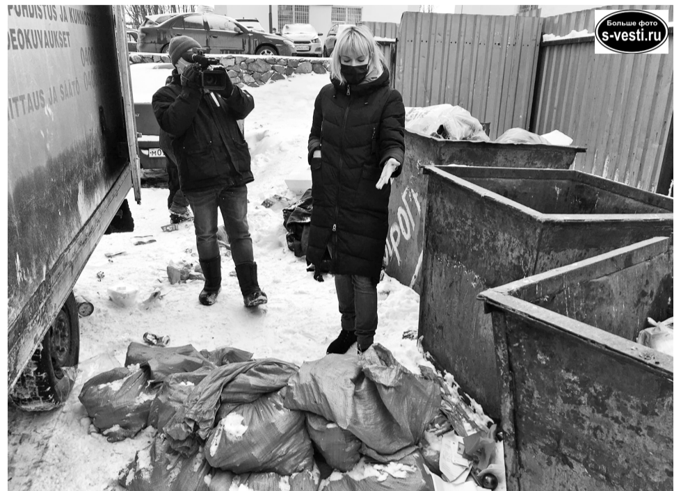
Самостоятельно вывезти строительный мусор наши граждане не привыкли.