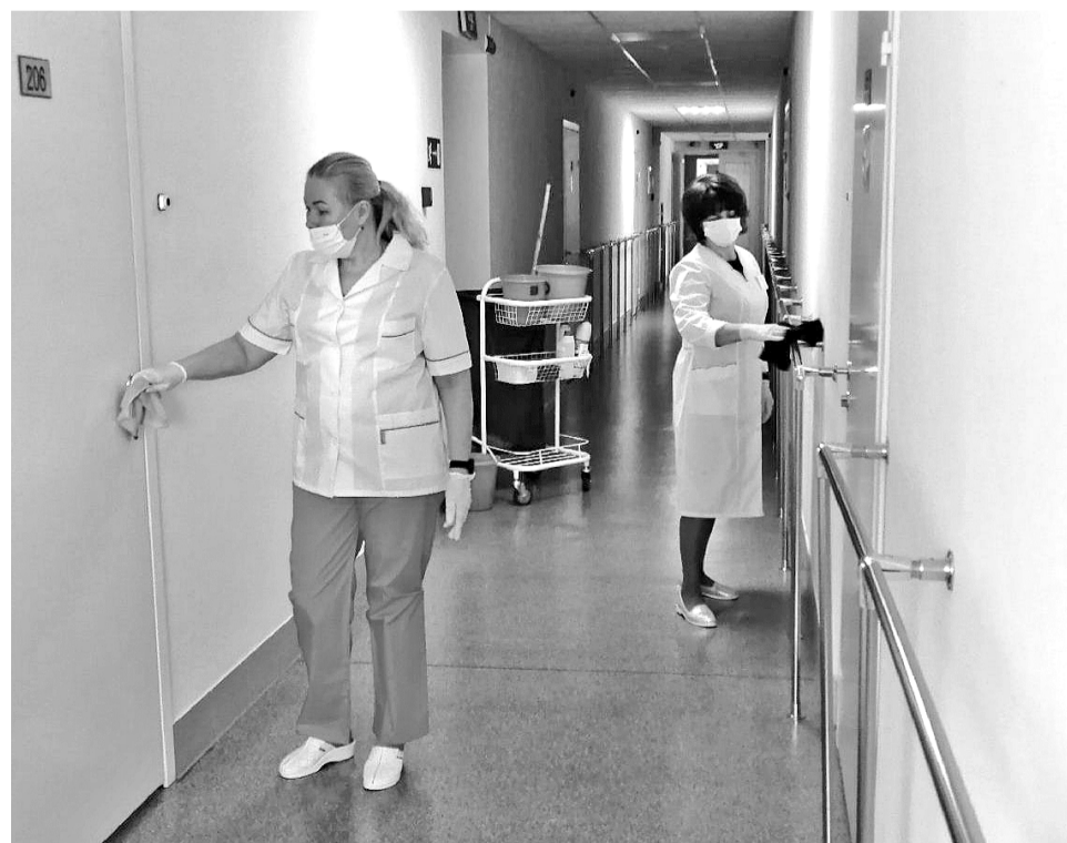
Санитарки стационарного отделения квартирного типа в течение дня несколько раз проводят влажную уборку всех помещений отделения с использованием дезинфицирующих средств.

Подробную информацию о стационарном отделении квартирного типа можно получить на сайте КЦСОН - cso51.ru, по телефону: (81537)5-70-35.