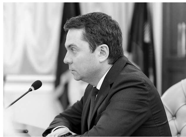
Губернатор Андрей Чибис.

- Правительством Мурманской области разработан беспрецедентный пакет конкретных мер, направленных на поддержку наших предпринимателей в условиях борьбы с коронавирусом , - отметил губернатор Мурманской области Андрей Чибис. - Это позволит не только преодолеть кризисный период, а даст возможность работать на Севере с более комфортными условиями налогообложения.