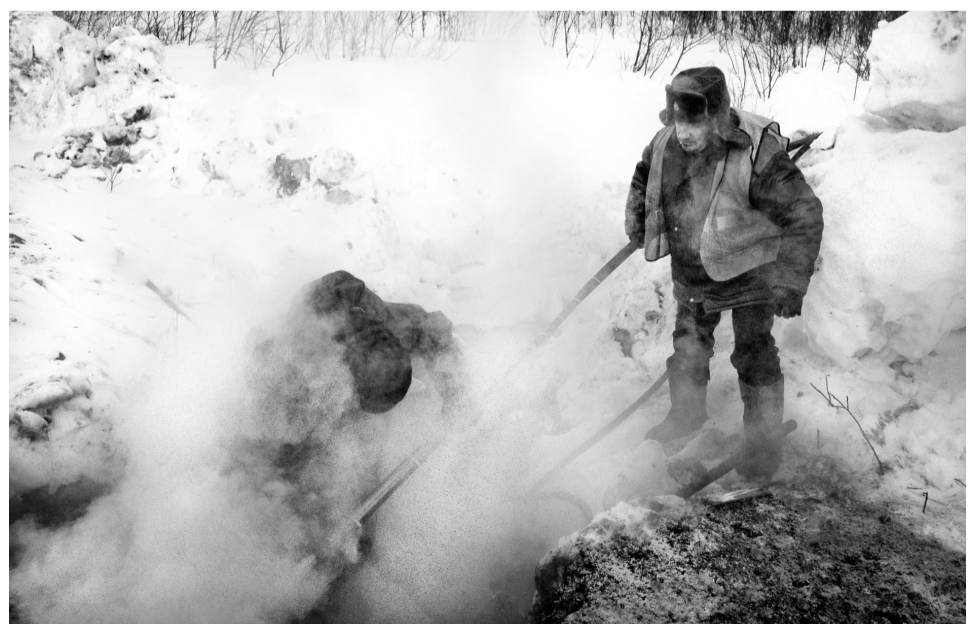
Парогенератор топит лёд у дороги на Североморск-3.