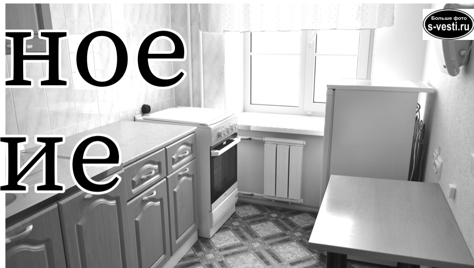
Уютная кухня оборудована необходимой бытовой техникой.

Уделяют в отделении внимание и творчеству: рисуют,