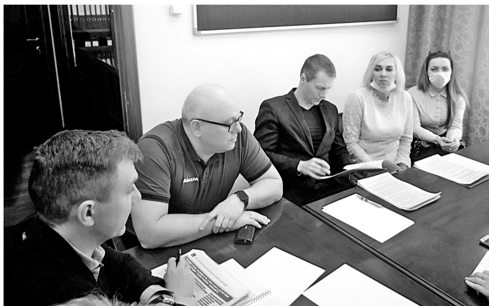
Североморские предприниматели первыми привлекли внимание города и области к проблемам малого и среднего бизнеса в условиях карантина.

Есть обязательства. Перед государством, банками, сотрудниками, арендодателями, своими семьями.