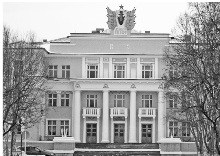
В связи с техническим состоянием здания ДОФА его историко-культурная ценность ставится под сомнение - требования пожарной безопасности нарушены, отопление нет. Грядущие морозы еще более усугубят ситуацию.