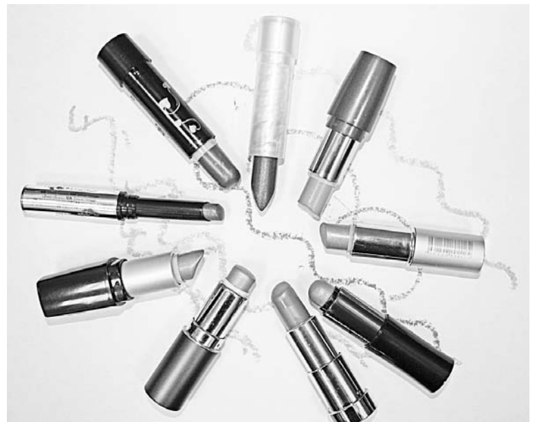
Двух одинаковых помад не бывает, как и двух одинаковых женщин.

Такая форма помады отличает женщину спокойных, рассудительных. Как правило, их дом – полная чаша, хотя они и склонны завидовать друзьям и соседям. Не любят быть в