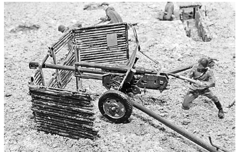
Моделизм - дело ювелирное: фигурка человека со спичечный коробок.

- Живем во флотской столице – казалось бы, корабли должны превалировать над другими, а на практике выходит наоборот, - недоумевает член правления