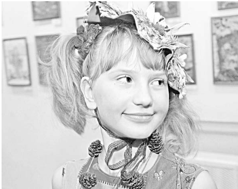
Девочки из студии «Энканто» ЦДМ продемонстрировали, как из природных материалов можно создать наряд.

нимается в клубе уже более трех лет, и ее картины, выполненные в технике «терра», были представлены в одном ряду с работами взрослых участников.