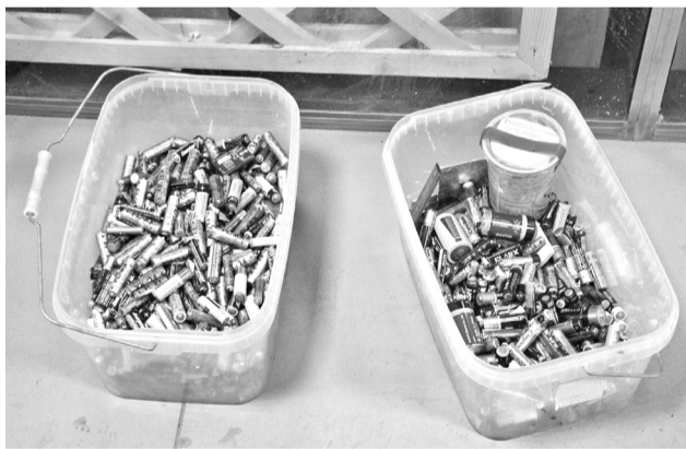
Активность североморцев при сборе отработанных аккумуляторов превзошла все ожидания.

Брендом акции стало зеленое яблоко с красной на-