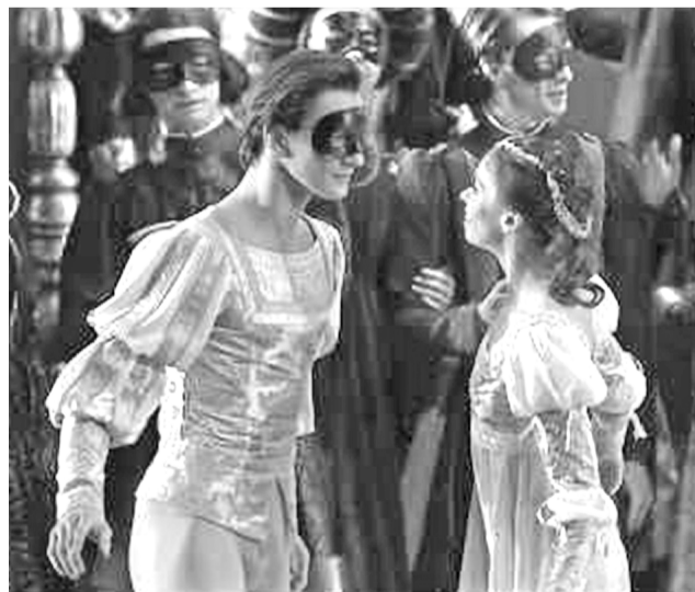
«СВ» рекомендует: даже виртуальное посещение Большого театра оставит неизгладимое впечатление.

На Okko с 16 марта можно бесплатно оформить пакет подписок «Оптимум» на две недели. Активировать подписку можно, написав чат-боту Okkobro в Telegram или «ВКонтакте».