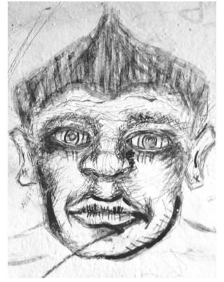
Образец «наскальной живописи».

- Еще в октябре прошлого года в результате обращения жителей была проведена проверка этого подъезда на предмет нарушения пра-