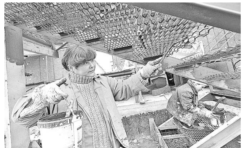
Сейчас строители заканчивают облицовку фасада. В октябре приступят к внутренней отделке.

- Отрадно, что это единственный город в области, в котором за последние годы строится детское учреждение. Североморск