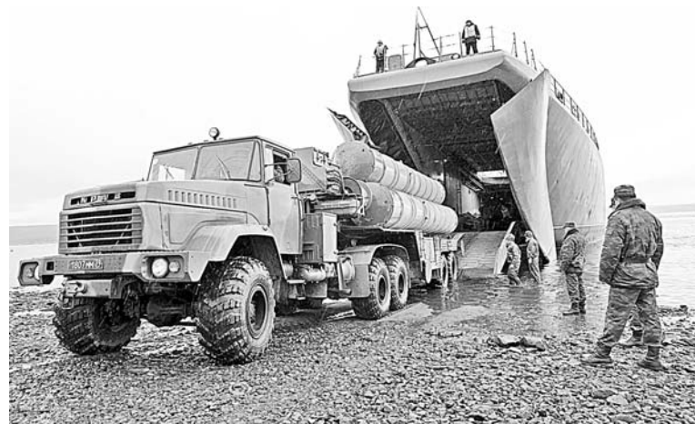
На БДК «Александр Отраковский» было погружено два зенитно-ракетных комплекса.