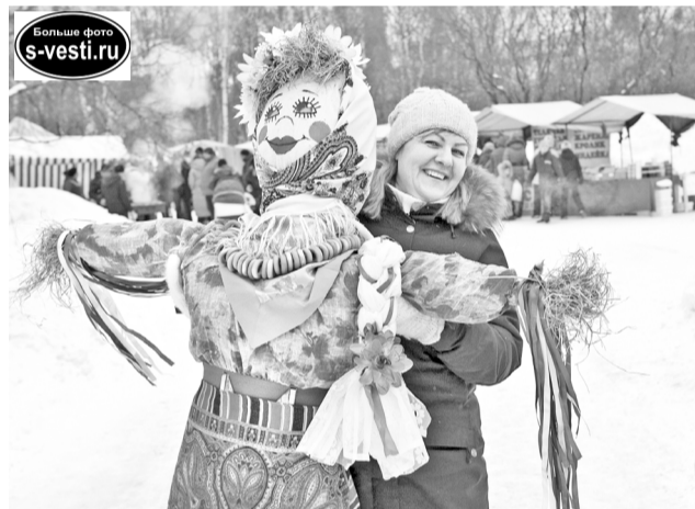
Фото с масленичным чучелом - отличная память о празднике.

Тряхнул стариной, вспомнив старую традицию, депутатский корпус. Депутаты пошли в народ, сами бесплатно раздавали блины североморцам и поили их горячим чаем. Надо сказать, что очередь за депутатскими блинами не иссякала, пока не иссякли сами блины.