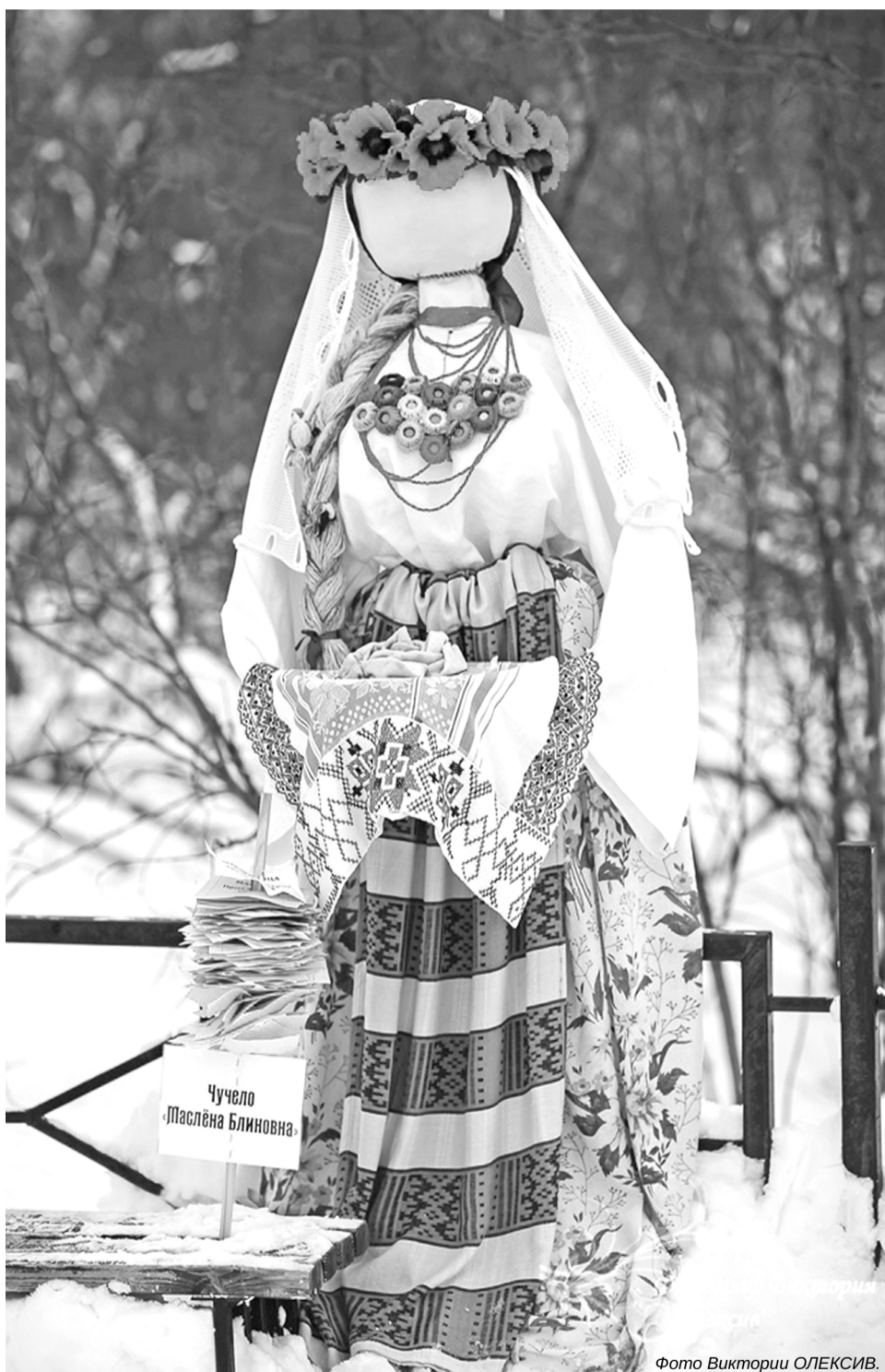
Чучело «Маслена Блиновна»