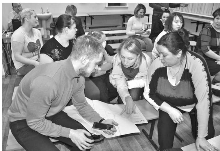
Одно из первых обсуждений прошло в п.Сафоново.

Напомним, программа «Формирование комфортной городской среды» рассчитана на ближайшие несколько лет. Заявки на благоустройство дворов принимаются в Комитете по развитию городского хозяйства администрации ЗАТО (каб.16, тел.: 5-07-57), а общественной террито-