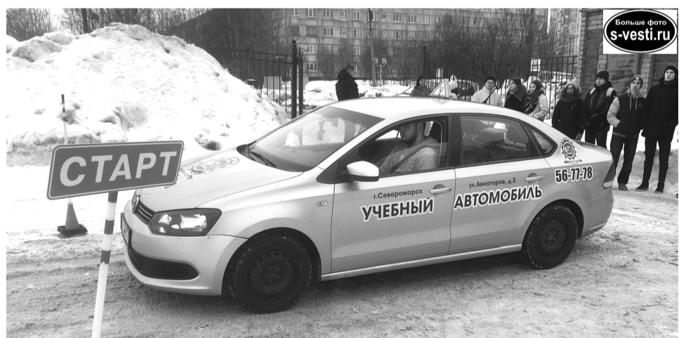
Сразу после старта юношам предстояло выполнить упражнение «горка». Справились с ним практически все участники соревнований.

- Надо поработать еще над техникой и особенно над временем, - говорит юноша. -