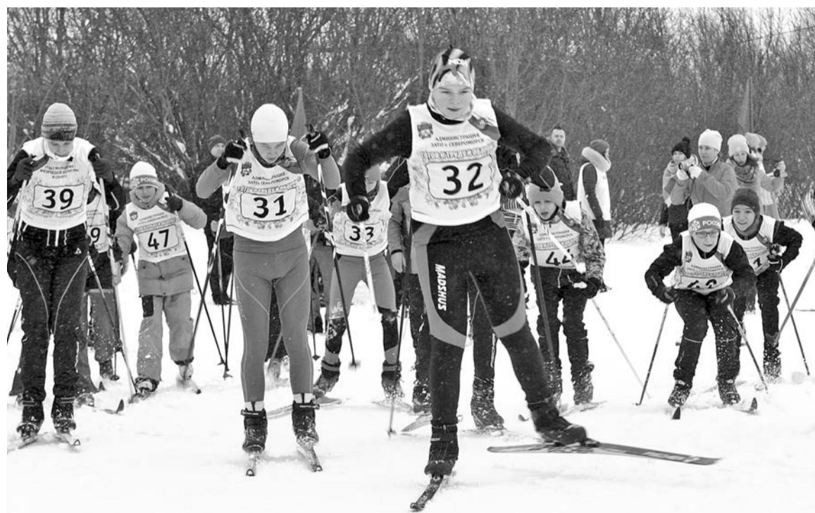
Даже сама погода, сменив гнев на милость, позволила провести «Лыжню России» в оптимальных условиях.