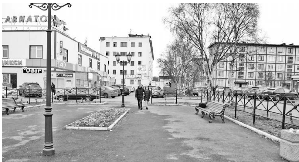
С открытием сквера «Народного» жителям Авиагородка есть где и прогуляться, и праздник провести.

Мурманская область подключилась к проекту в 2017 году, и с тех пор муниципалитеты активно используют его возможности. В пилотный год реализации местных инициатив 21 объект благоустройства появился в более чем десятке городов области. Кировск отремонтировал по программе набережную озера Верхнего, Кольский район привел в порядок фасад мурманской школы №1, Ловозерский - приобрел мини-трактор, Печенгский район создал Культурный центр «Живая история». Ну а флотская столица отпраздновала открытие сквера «Народного» в Авиагородке. Для его реализации из областного бюджета было выделено 1,5 млн. руб. Софинансирование проекта со стороны муниципалитета составило чуть больше 80 тыс. руб., от населения 200 тыс. руб. и от спонсоров почти 300 тыс. руб.