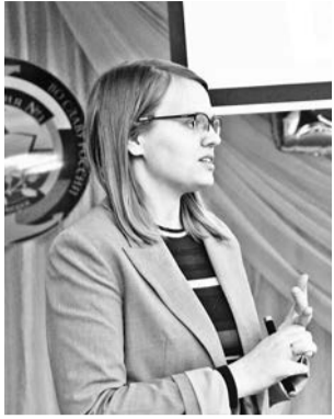
Министр градостроительства и благоустройства области Ольга Вовк.