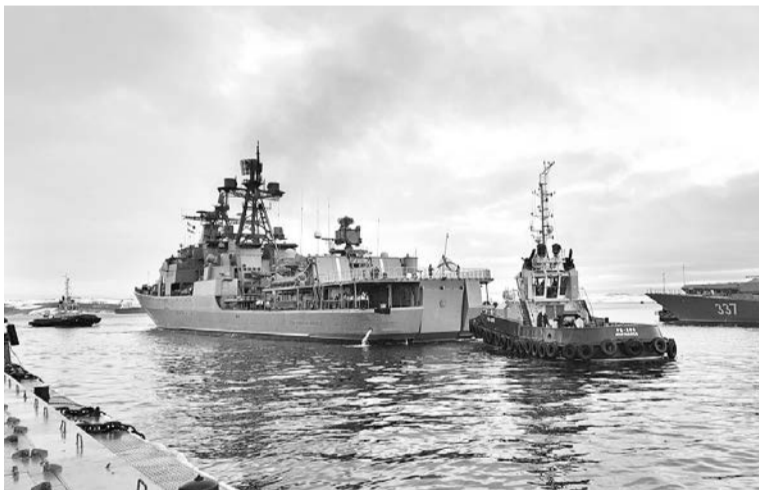
БПК «Вице-адмирал Кулаков» швартуется в главной базе Северного флота.