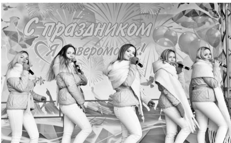
Вторая жизнь сценического комплекса - теперь здесь проводятся многие городские праздники.

15 февраля – День памяти о россиянах, исполнявших служебный долг за пределами Отечества. Эта памятная дата связана с выходом СССР из Афганской войны (1979-1989 г.г.) и окончанием вывода ограниченного контингента советских войск из Афганистана.