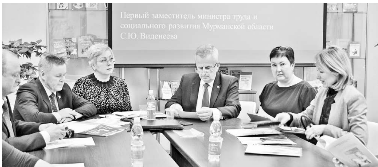
Региональная и муниципальная власти работают в тесном тандеме на защите прав семьи и детства.