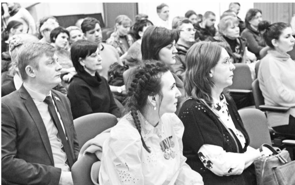
На обсуждении проекта жители города задали немало вопросов.