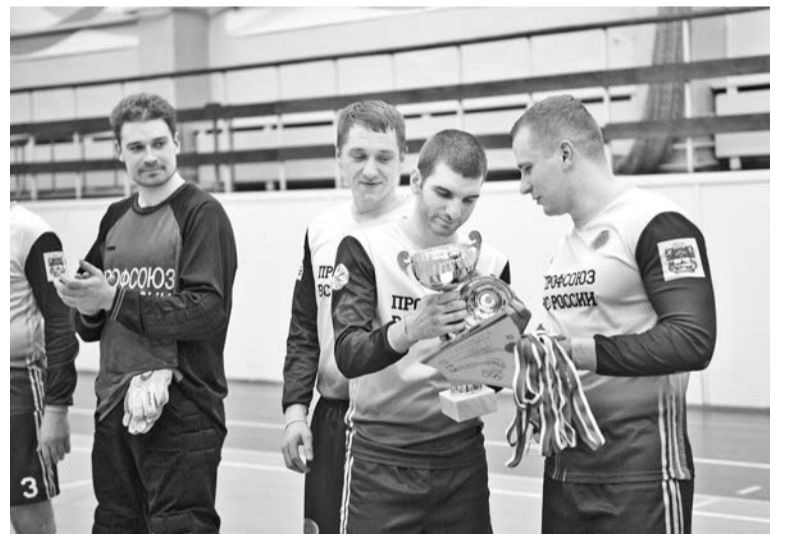
Спустя три года футболисты «Профсоюзов ВС» вновь держат в руках заветный кубок.

10 февраля в финальном поединке за утешительный Серебряный кубок в упорнейшей борьбе «Петр Великий» одолел «Водоканал» 5:4. Вслед за ними на площадку вышли «Профсоюзы ВС» и «КЛФ» - состоялся финал Золотого кубка. По сути, судьба матча была предрешена уже в первом тайме, по окончании которого на табло горели цифры «7:3» в пользу профсоюзников. Коллектив впервые собрал две полноценных четверки, в то время как у «любителей футбола» людей на ро-