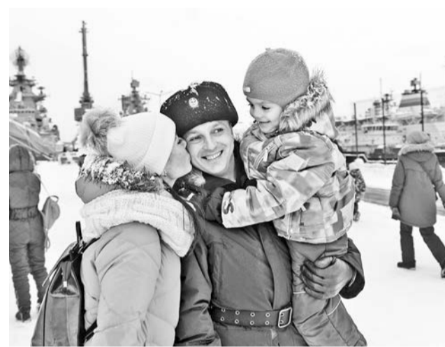
Из объятий морской стихии в объятия родной семьи.