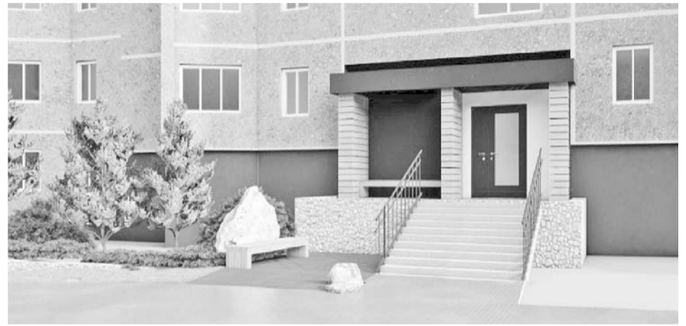
Технологичные ограждения, прозрачные двери и камни с подсветкой в качестве антипарковочных столбиков - вот он, подъезд мечты.

Немалую часть того, что волнует жителей, глава ЗАТО Североморск Владимир Евменков узнает непосредственно от самих людей. Прийти на встречу с главой и задать вопрос может любой желающий, и стоит отметить, что жители такой возможностью пользуются.