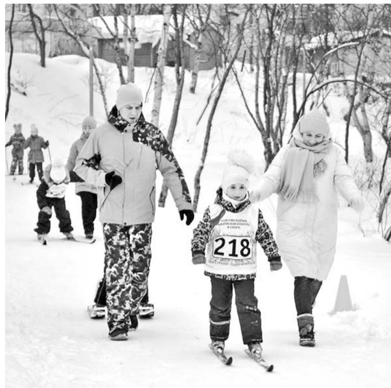
«Солнечные лучики» - один из лучших вариантов активного семейного отдыха.

В третий раз в этом лыжном сезоне в городском парке на Аллее спорта прошел праздник спорта «Солнечные лучики». 9 февраля более 150 ребят от 1 до 8 лет пришли в парк, чтобы преодолеть километровую трассу.