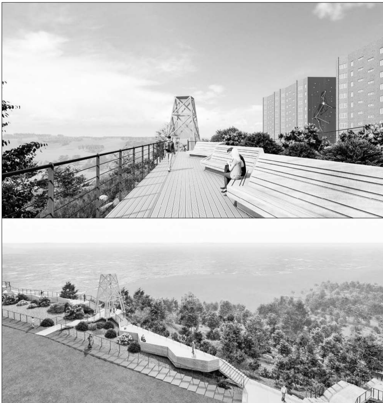
Североморцам представили проект преобразований на ул.Полярной.