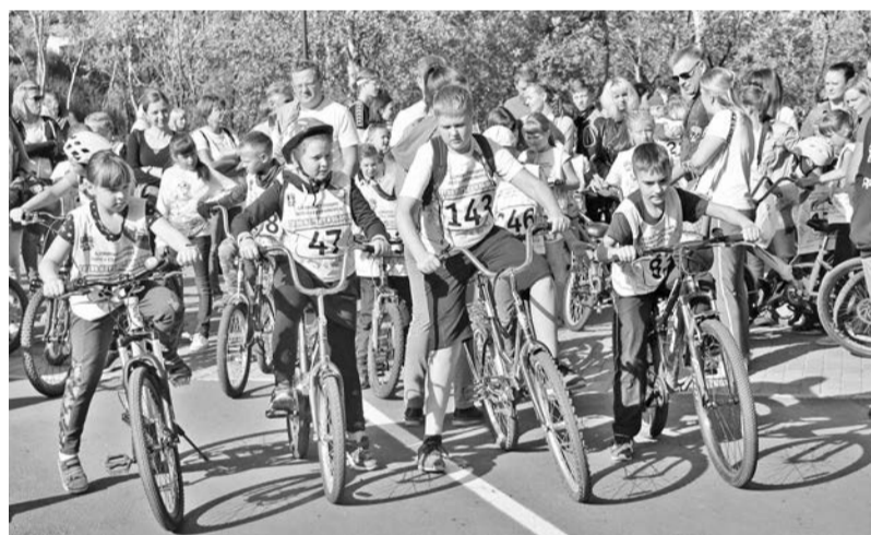
Аллея спорта в городском парке полностью оправдывает свое название: летом проходят велозаезды, зимой - лыжные гонки.

Иванна МИКИТЕНКО. Фото из архива редакции.