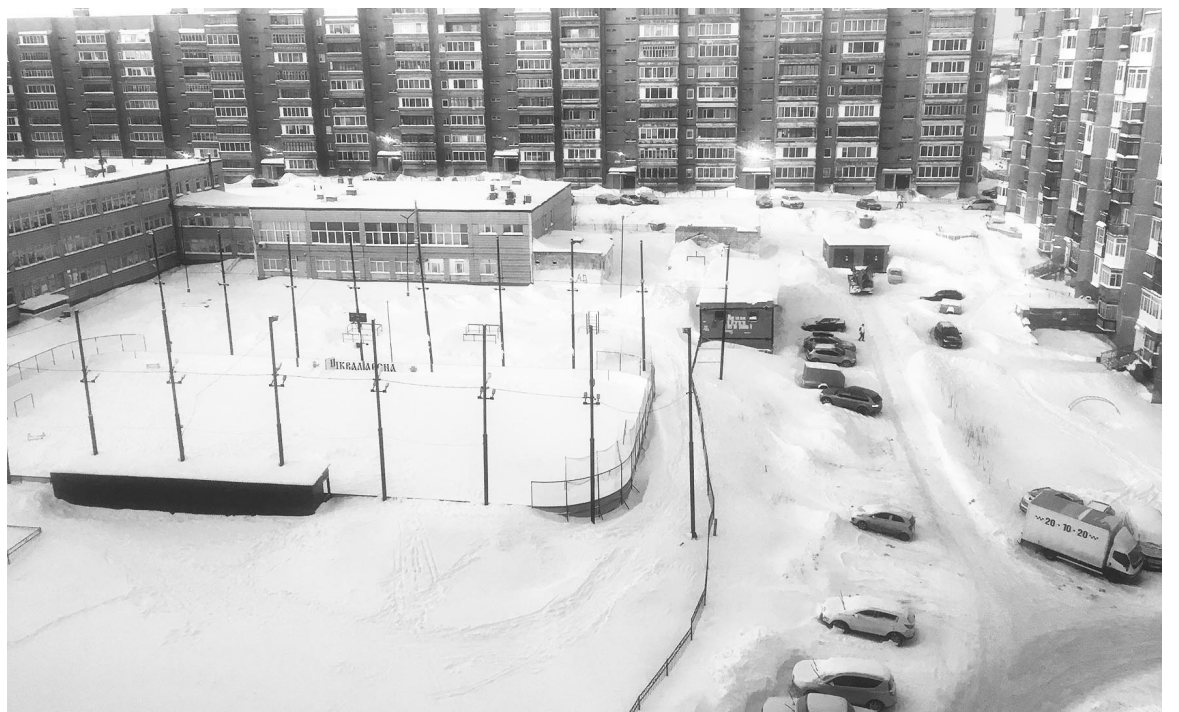
На ул.Полярной в Североморске будет в миниатюре воплощена идея города будущего, комфортного для проживания.

Игорь ГЛУЦКИЙ.