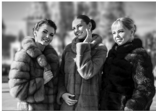
На фото: презентация нашей коллекции «Зима-2020» в Москве

Выставка от ведущих фабрик из Кирова и Пятигорска приглашает на последнюю распродажу в Вашем городе! Вы спросите, почему мы распродаем весь ассортимент практически по себестоимости? С удовольствием расскажем: