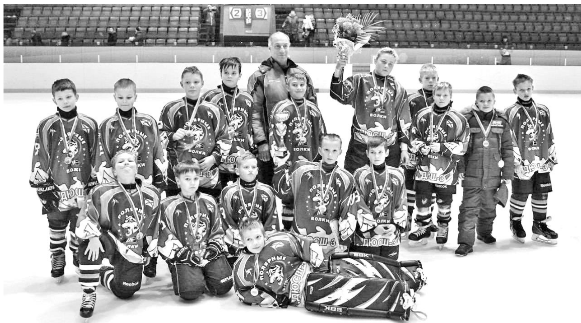
Команда «Полярные волки» на первенстве Мурманской области по хоккею (2017 год).