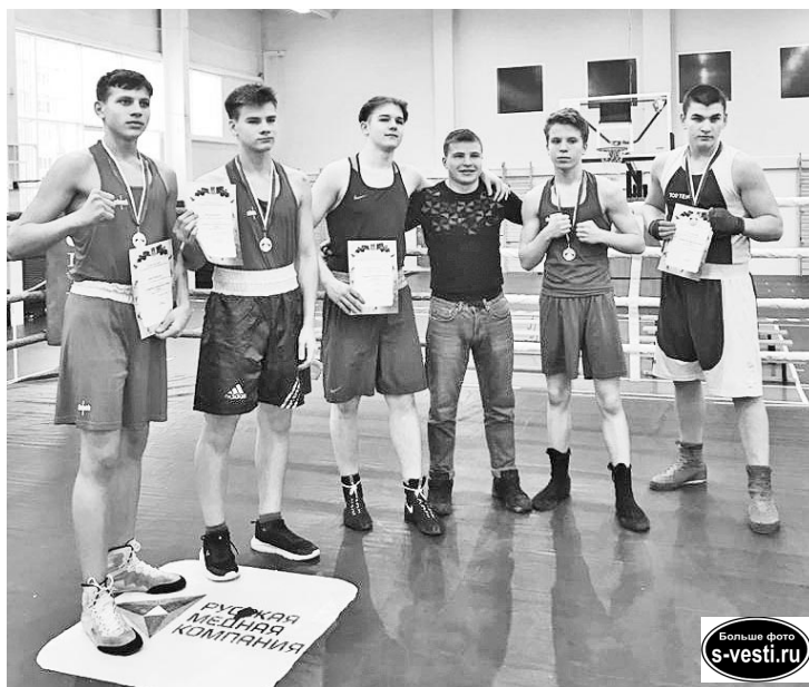
Юные боксеры ДЮСШ-1 – победители и призеры чемпионата Мурманской области.