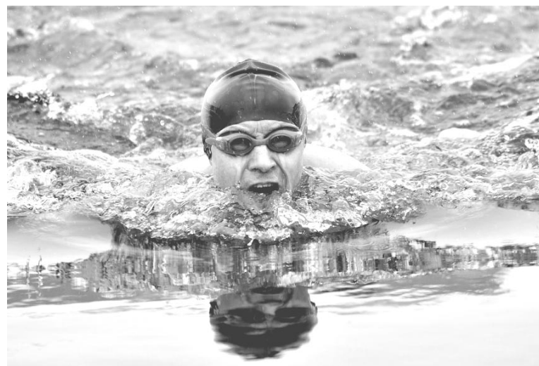
Самым ярким событием прошлого года стал 3-й Чемпионат мира и 1-й Кубок Арктики по ледяному плаванию. Проходил он на Семеновском озере в Мурманске.