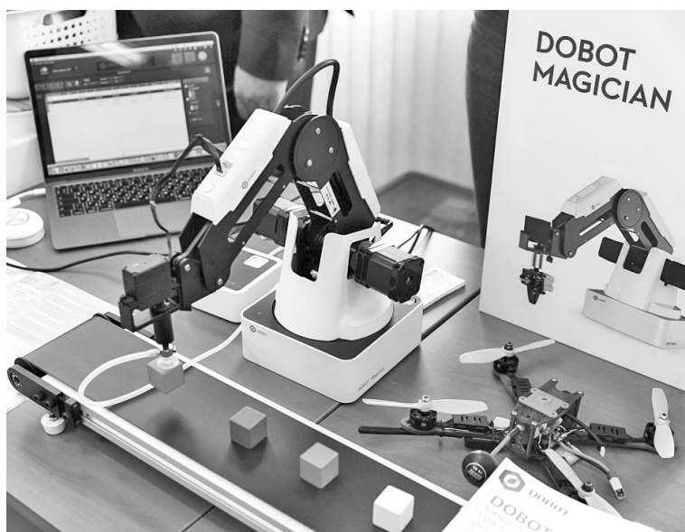
Подобные 3D-принтеры появятся во всех «Точках роста».