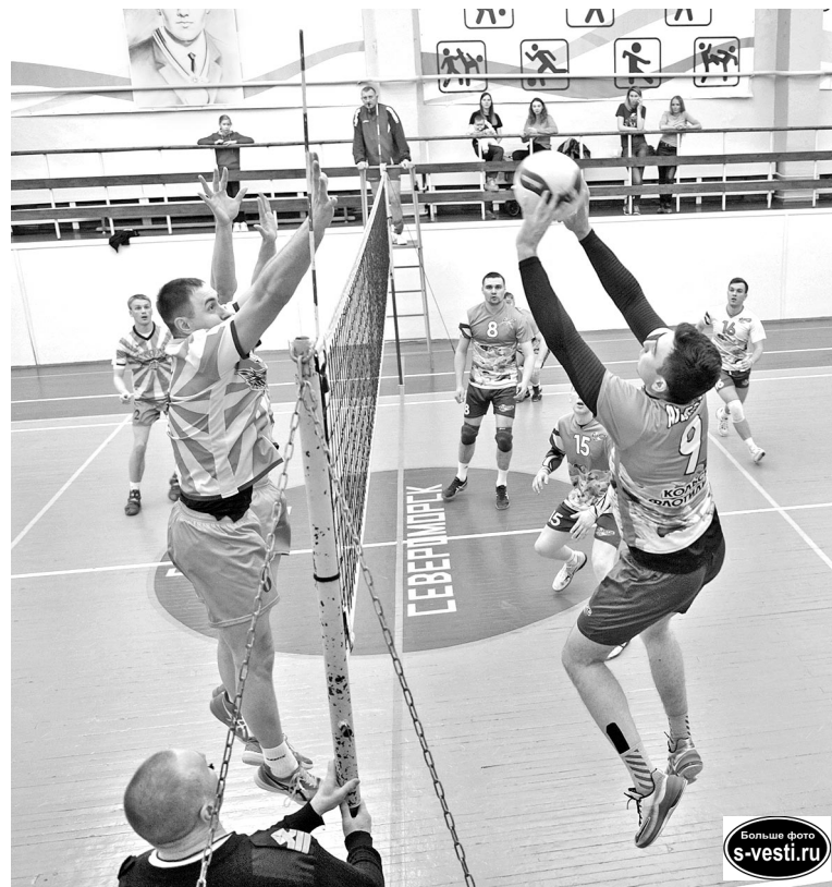
Ничто в игре «Гроза»-«Альбатрос» не напоминало классический поединок фаворита и аутсайдера.