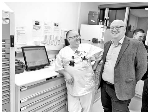
В январе минувшего года во время рабочей поездки в Киркенес глава ознакомился с принципами работы местной больницы, в том числе с пунктом выдачи медикаментов.