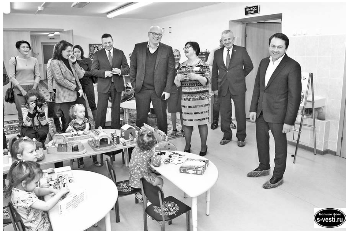
Малыши д/с №41 попросили Андрея Чибиса подарить им новый автобус - и глава региона поддался на этот «запрещенный прием».

600 тыс.руб. на обновление медоборудования. В ФАПе три кабинета: для приема пациентов, процедурный и комната персонала, туалетная комната, просторная прихожая с гардеробными шкафчиками. При входе оборудован пандус и кнопка вызова для маломобильных граждан. Оснащение ФАП дополнителем медицинским оборудованием будет продолжено, планируется закупить электрокардиограф, стерилизатор и портативный спирометр.