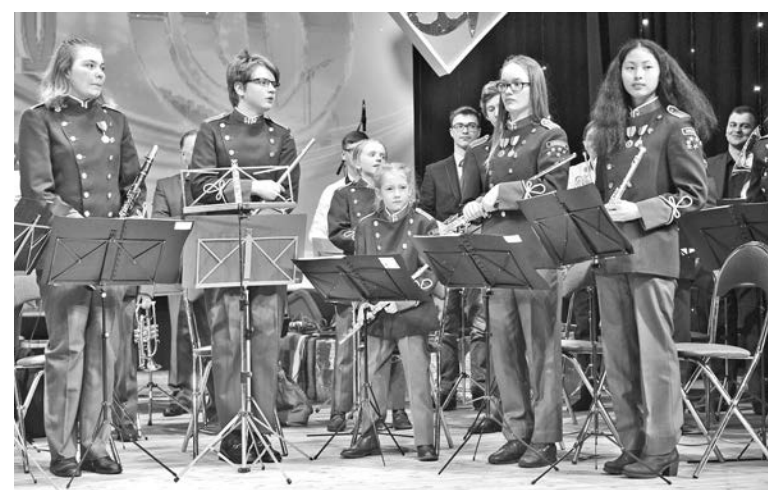
13 апреля 2018 года Детский духовой оркестр Школы культуры города Киркенеса впервые дал концерт для североморцев. На сцене Центра досуга молодежи коллектив исполнил популярные эстрадные и джазовые композиции.