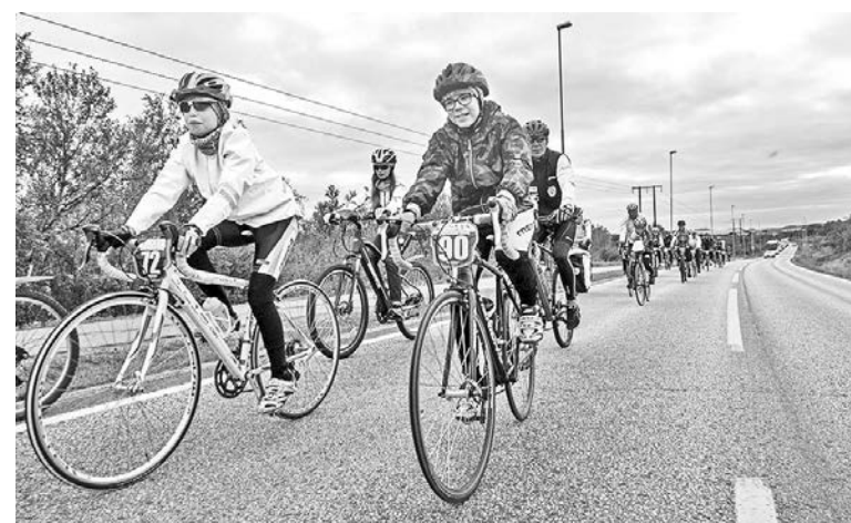
15-17 августа 2018 года в Норвегии прошла VI традиционная Международная велогонка Arctic Race of Norway. Среди приглашенных были 25 североморских спортсменов из велоклуба «Пилигримы».