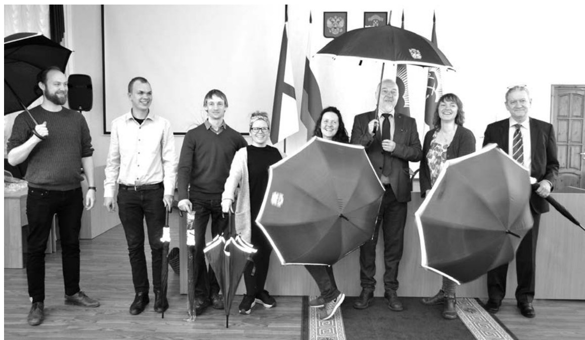
Участники делегации норвежской коммуны Сер-Варангер во главе с мэром Руне Рафаэльсеном во время дружеского визита в мае 2019 года.