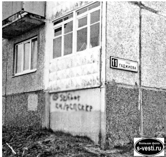
Подобные надписи на домах должны остаться в прошлом.

тому подобному виду настенной живописи, но, прежде всего, о надписях с указани-