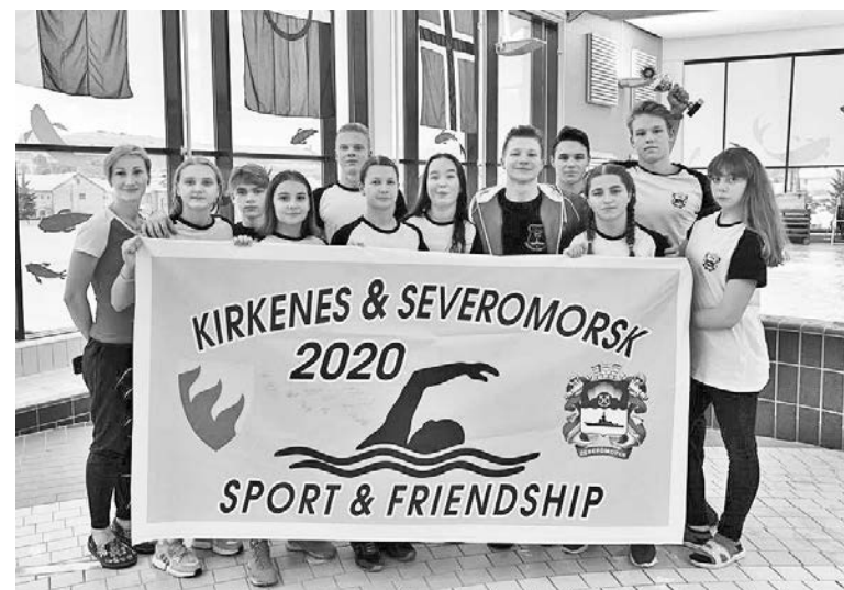
26 января в норвежском Киркенесе завершились международные соревнования по плаванию. В них приняли участие 18 команд: десять из городов Мурманской и Архангельской областей и восемь из городов Северной Норвегии. Североморская команда выступила успешно - в копилке награды в командных и индивидуальных дисциплинах.