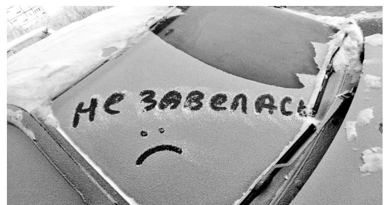
В морозные дни не все автолюбители смогли завести свои машины - это внесло коррективы в графики механизированной уборки.

- Обратите внимание на детские и спортивные площадки ЗАТО, которые входят в муници-