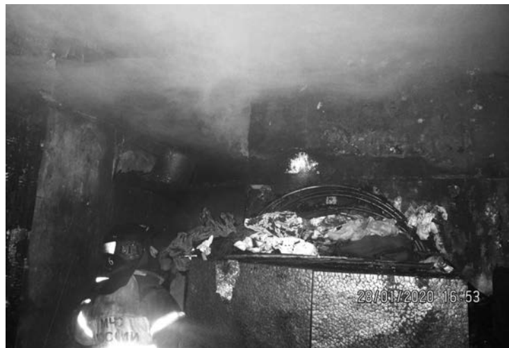
Пожар на ул. Сафонова, 24.

4-95-30, 4-95-32, +7(921)27-210-71. По данным полиции, Игорь ГЛУЦКИЙ.