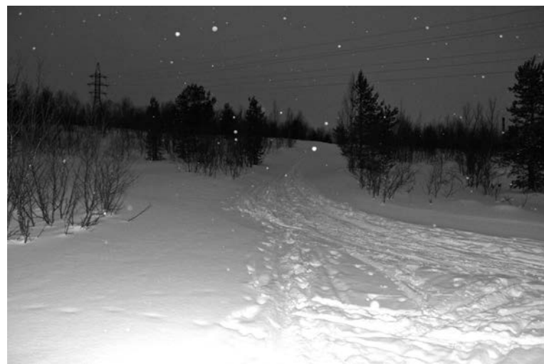
Уходящая в ночь лыжная трасса на ул. Восточной должна стать светлее.