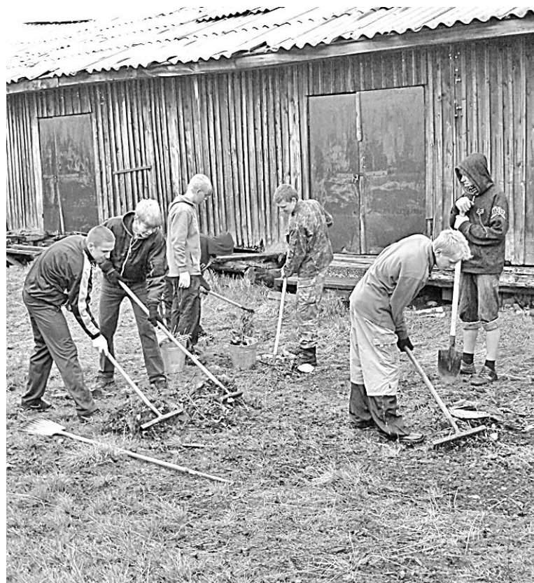
... как и пришкольная территория.