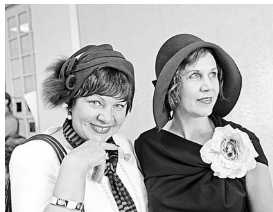
Шляпа - самый быстрый способ заставить говорить о себе.