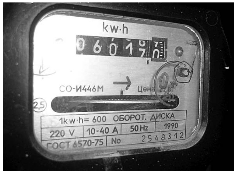
Как контролеры фиксируют показания счетчиков, если к маю прибор так и не «докрутил» до указанных в мартовской квитанции 6019,3 кВт/ч?

Поскольку ОАО «КЭС» является гарантирующим поставщиком на территории нашего ЗАТО, то можно говорить о его особом положении, то есть о том, что организация, по сути, является монополистом. Значит, по отдельным аспектам деятельности «Колэнергосбыта» можно обращаться и в территориальное Управление антимонопольной службы. ФАС России следит за действиями субъектов оптового и розничного рынков электроэнергии на территории региона, занимающих исключительное положение, а также за соблюдением стандартов раскрытия информации субъектами розничного рынка электроэнергии. Кроме того, согласно Приказу Министерства по антимонопольной политике РФ от 04.04.1996 №42 (ред. от 02.07.2002) антимонопольные органы рассматривают жалобы на действия по продаже товаров (выполнения работ, оказания услуг) при отсутствии достоверной и достаточной информации о товаре (работе, услуге). Адрес Управления ФАС по Мурманской обла-