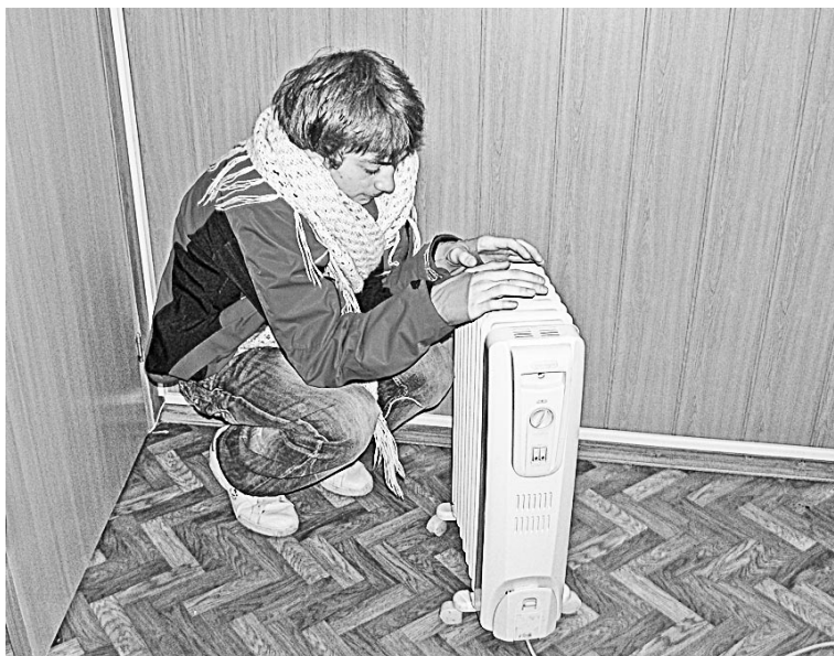
Летом можно только позавидовать тем, кто решился перейти на электробатареи.

Вроде все четко, но с центральным отоплением вышла заминка. Постановление правительства №491 от 13 августа 2006 года отнесло «внутридомовую систему отопления, состоящую из стояков, обогревающих элементов, регулирующей и запорной арматуры, коллективных (общедомовых) приборов учета тепловой энергии, а также другого оборудования, расположенного на этих сетях», к общему имуществу дома. Согласно ст.44 ЖК РФ решение о реконструкции жилого дома, а также ремонте общего имущества принимается на общем собрании собственников помещений в многоквартирном доме. И чтобы получить «добро» на демонтаж батарей, необходимо собрать две трети от общего числа голосов собственников помещений в многоквартирном доме (ст.46 ЖК РФ). По крайней мере, так трактуют законодательство органы, проводящие согласование переустройства. Но с другой стороны переустройство системы отопления в отдельно взятом помещении нельзя в полной мере отнести ни к реконструкции дома, ни к ремонту общего имущества, поскольку полной реконструкции всей системы не происходит, а ремонт подразумевает не изменение, а лишь устранение неисправностей. Кроме того, в перечне документов, которые требуются