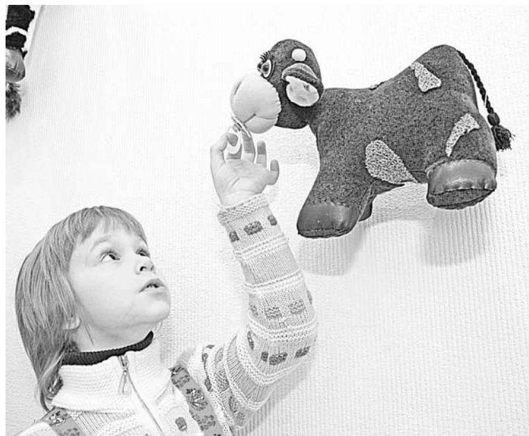
Где еще можно увидеть «Теленка с соской»?!