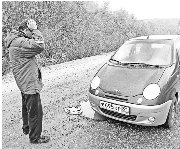
Колпак от колеса - не такая серьезная потеря. Ямы могут нанести куда больший материальный вред.

тью подошла к оценке ее технического состояния. Износ дороги составляет порядка 60%, колейность - 70%, практически 50% дорожного полотна требует капитального ремонта. Тем не менее, на этот год для капитального ремонта дороги не выделено ни рубля. В ходе объезда было выявлено около сотни различных ям, выбоин, других нарушений, не соответствующих ГОСТам по эксплуатации дорог. Все акты комиссии направлена исполнителем различных уровней: в управление «Мурманскавтодор», который является заказчиком, Кильдинское Государственное управление дорожных ремонтно-строительных работ, осуществляющим ремонт. Как нас заверили, там уже составлен план устранения замечаний. Руководитель «Мурманскавтодора» принял решение выполнить ка-