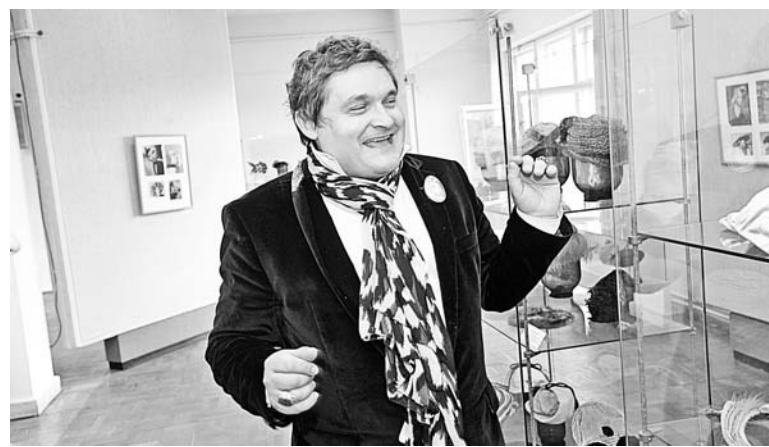
Александр Васильев: «Хотите преуспеть - наденьте шляпку».

Не знаю, зачем голова мужчинам, но женщинам она необходима для... ношения шляпок: атласных и из панбархата, украшенных страусовыми перьями и пайетками, широкополых и миниатюрных, вычурных и скромных, почти домашних. Все это великолепие можно увидеть в Мурманском областном художественном музее на выставке «Секреты шляпной коробки». Обладатель эксклюзивных экспонатов – известный историк моды Александр Васильев.