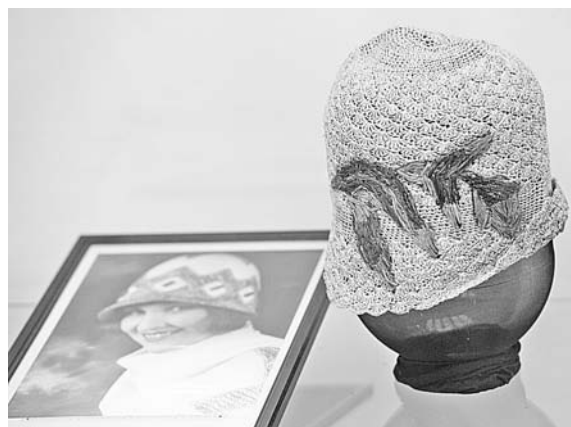
Некоторые экземпляры отличаются почти ювелирной работой.