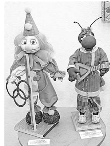
Автор этих каркасных кукол Ирина Друбецкая.