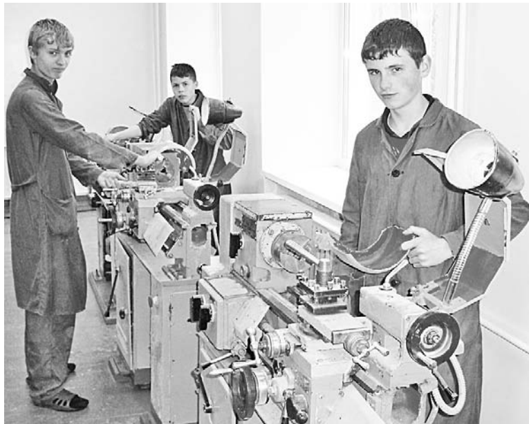
К началу учебного года станки будут в идеальном состоянии,...

С июня начали работу трудовые бригады для старшеклассников при учреждениях образования и ООО «Автодорсервис». Всего в этом году запланировано 407 рабочих мест, из них 45 - в «Автодорсервисе».