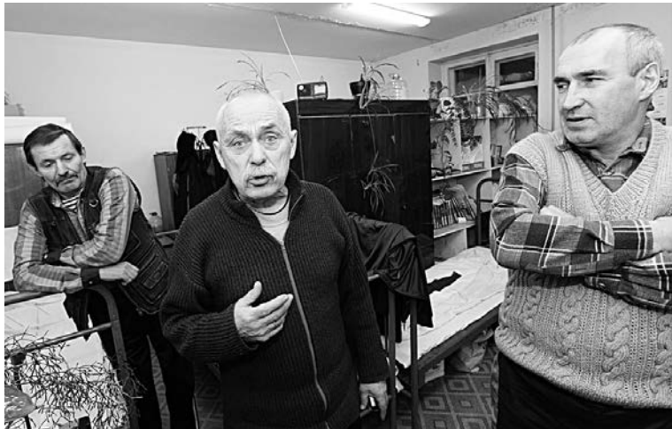
Военные строители готовы перекрыть дорогу 30 или 31 декабря.

- 1 октября мы приостановили голодовку, потому что поверили обещаниям, что долг будет выплачен. И зря поверили! Долги по заработной плате были погашены только тем, кто успел внести свои имена в список, когда при-