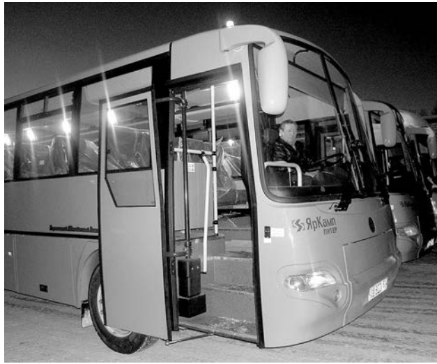
В таком автобусе зимой не замерзнешь.

– Подвеска оборудована пневмобаллонами и рессорами, что обеспечивает достаточную проходимость и плавность движения. Кроме того, здесь предусмотрена противоскользкая система и автономный отопитель, рассчитанный на 4 часа работы. Так что в случае поломки двигателя пассажиры не замерзнут, ожидая другой автобуса или ремонтной бригады. КАВЗы имеют по 40 посадочных мест. Раздельные мягкие кресла с высокими регулируемые спинками установлены на подиуме.