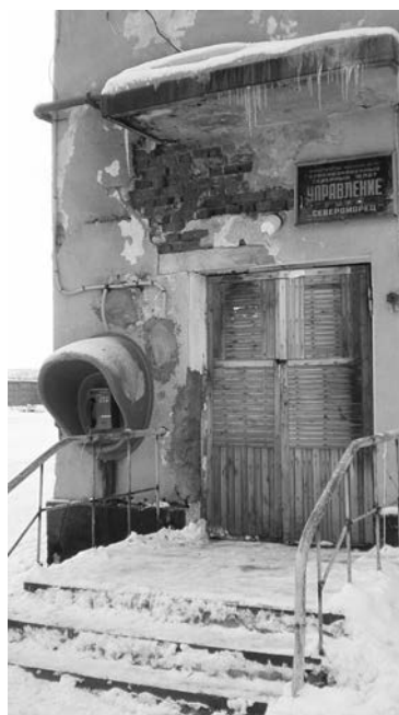
Фасады большинства зданий в п.Щукозеро выглядят удручающе.

На сегодняшний день в сельской школе учатся 47 детей. В самом многочисленном классе — восемь учеников, а в самом маленьком — всего один. Как и везде, на каникулах для школьников здесь работает площадка. В прошлом году было много кружков, но проблемы с финансированием заставили существенно сократить их количество, оставив лишь занятия по общей фи-