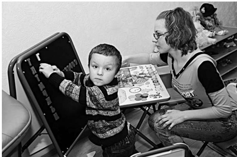
Совместные занятия исключают отчуждение в семье.