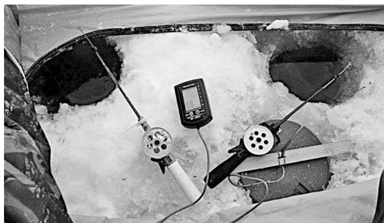
Эхолот, конечно, может стать залогом хорошего улова, но его отсутствие еще не обрекает рыбалку на провал.