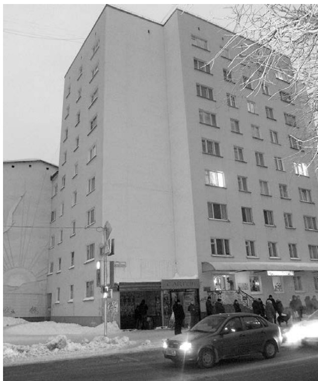
Остановку у девятиэтажки издавна называют «Россия», хотя до бывшего кинотеатра еще более 100 метров.