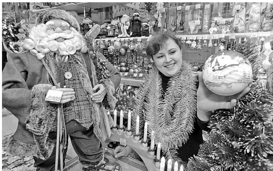
Для приобретения новогодней атрибутики осталась всего неделя.

Уже с середины декабря во множество магазинов и торговых центров города, таких как «Пять М», «Блокнот», «Малыш и К», «Юбилейный», «Пес и Кот», «Лев», поступили искусственные ёлки. Стоимость зеленых красавиц зависит от их величины и материала, из которого они изготовлены. В среднем небольшое новогоднее деревце 1,2 м в высоту обойдется в 1000 рублей. А вот возможность приобрести самую пышную ёлочку высотой более 2 м находится в прямой зависимости от габаритов вашей квартиры и толщины кошелька. Ведь такое удовольствие будет стоить недешево: свыше шести тысяч. В тех же магазинах открылись и целые отделы с ёлочными украшениями,