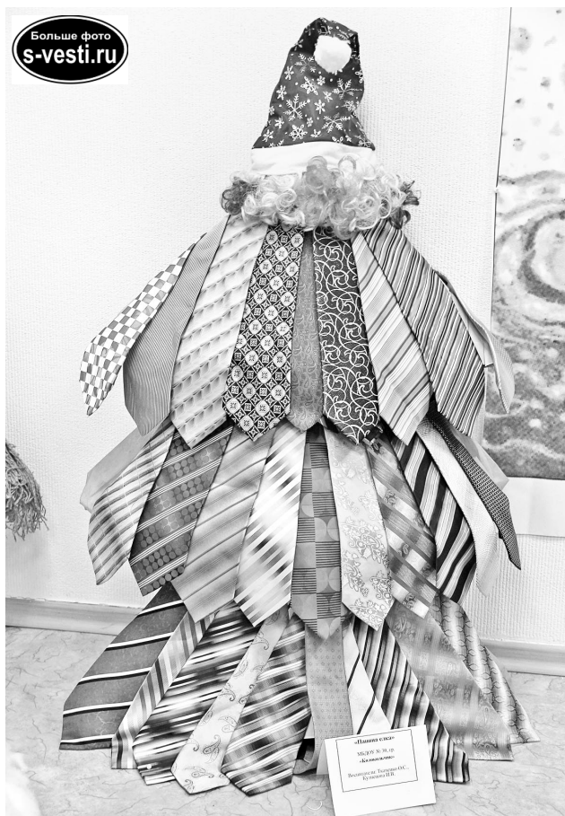
Вот такую «Папину ёлку» смастерили в группе «Колокольчик» д/с №30.

Муниципальное бюджетное учреждение дополнительного образования