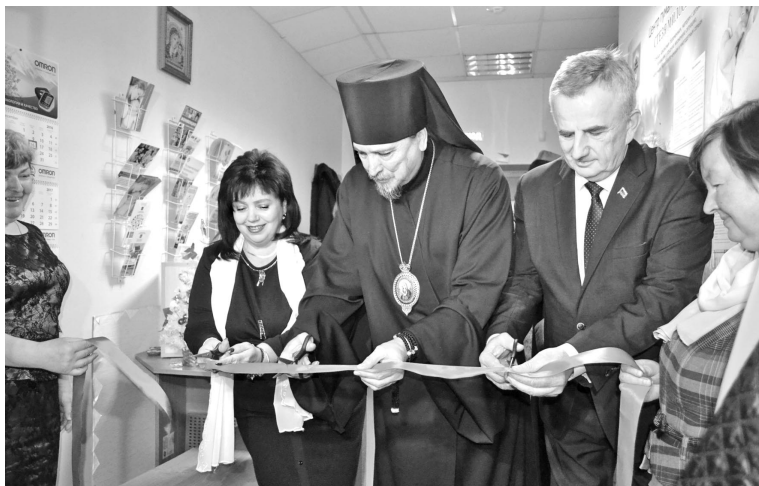
Торжественный момент открытия Центра гуманитарной помощи «Стезя милосердия» в декабре 2016 года.

Вся работа благотворительной организации строится на щедрости и отзывчивости простых североморцев, целых трудовых коллективов и