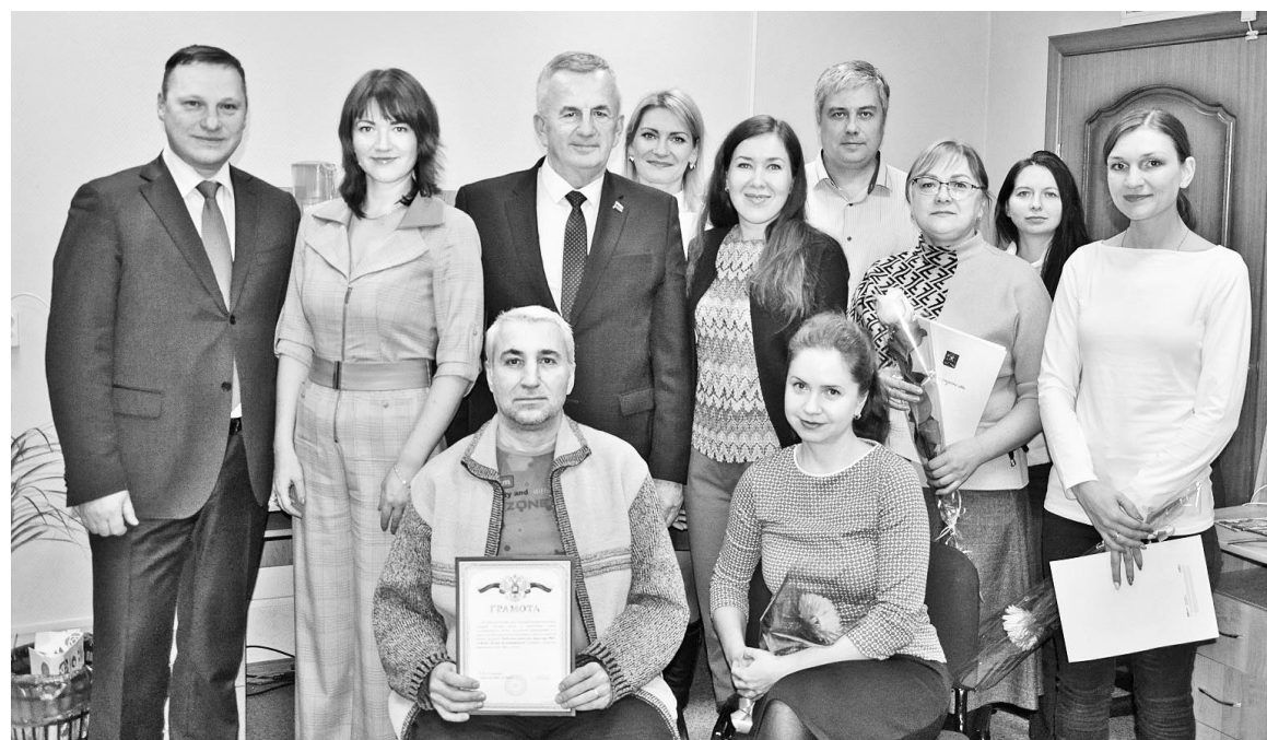
День печати, пожалуй, единственный день в году, когда все идут в гости к газете, а не наоборот.

денты, количество полос в газете, ее проблематика. Отдельным самодостаточным СМИ стал сайт «Североморки», а наша группа «ВКонтакте» собрала уже 14 тысяч подписчиков.