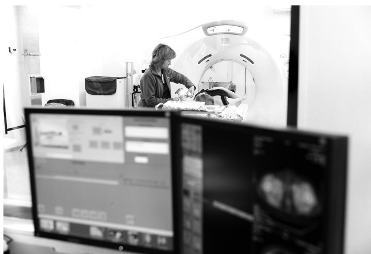
Специализированный мультиспиральный компьютерный томограф.

- То есть, проведя обследование пациентки, врач может отправить данные специалистам не только в областной центр, но и в курирующий научно-медицинский исследовательский центр онкологии имени Петрова в Санкт-Петербург. Речь идет о создании в регионе новой системы – онкологического скрининга для ранней диагностики злокачественных образований, - так оценивает новую технику министр здравоохранения Мурман-