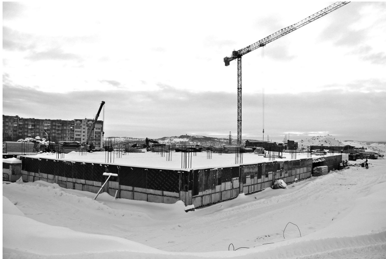
В ближайшее время на стройплощадке появится еще один башенный кран.

Напомним, что сроки строительства школы сдвинулись из-за дополнительных мероприятий по буровзрывным работам. По проекту БВР должны были завершиться в октябре прошлого года, на деле - последний взрыв прогремел только в конце декабря. В среднем подрядчик отстает от