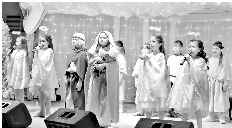
Юные артисты из 2 «А» и «Г» классов СШ №12 получили 1-е место и Гран-при зрительских симпатий.