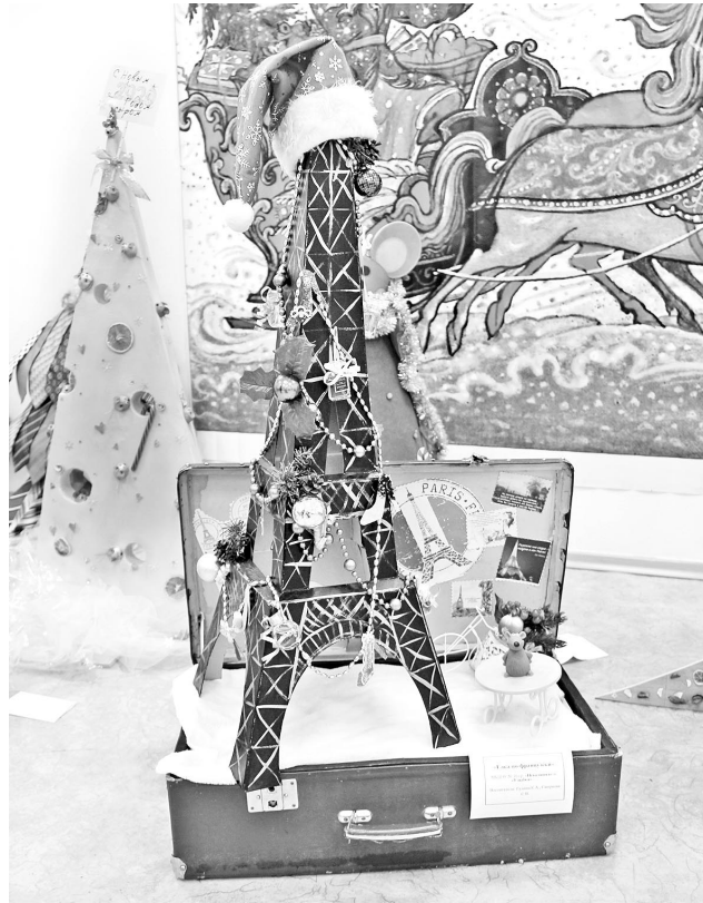
«Ёлка по-французски» украшена миниатюрами аромата «Шанель №5», на создание которого парфюмер вдохновило Заполярье.

- Новогодние деревья в разных уголках планеты очень разные. Например, во многих скандинавских странах люди отказываются от живых деревьев и используют различные экоконструкции, в странах, где нет елей, украшают бамбук. И нам очень приятно, что все это разнообразие можно было увидеть у нас, - отмечают сотрудники Музейно-выставочного комп-