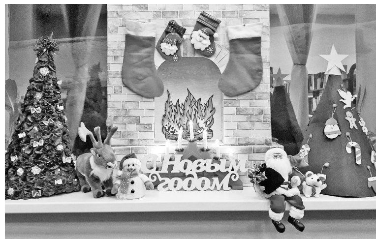
«Окно в сказку» Юлии Гончарук.