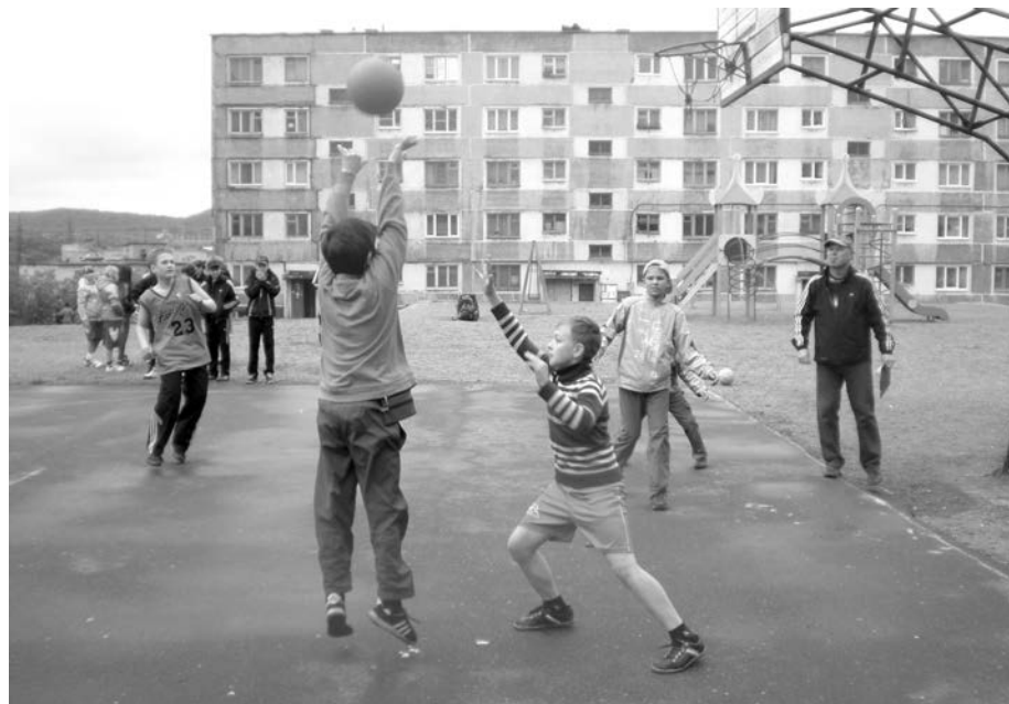
Накал страстей был так высок, что, несмотря на холодную погоду, игрокам было жарко.