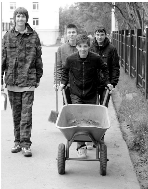
Ребята трудятся не только в школе, но и на прилегающей территории.