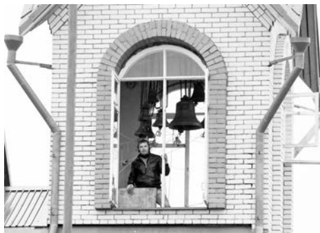
В этом году День России совпал с праздником Святой Троицы - над городом разливался колокольный звон.