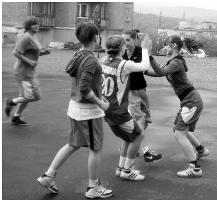
Встреча девушек, открывшая турнир, задавала отличный тон последующим поединкам.