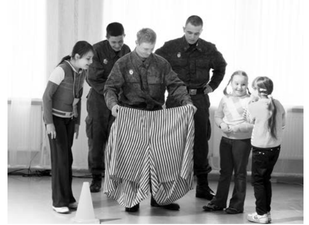
В Росляково зрители не только смогли насладиться концертом местных творческих коллективов, но и принять участие в шуточных эстафетах.