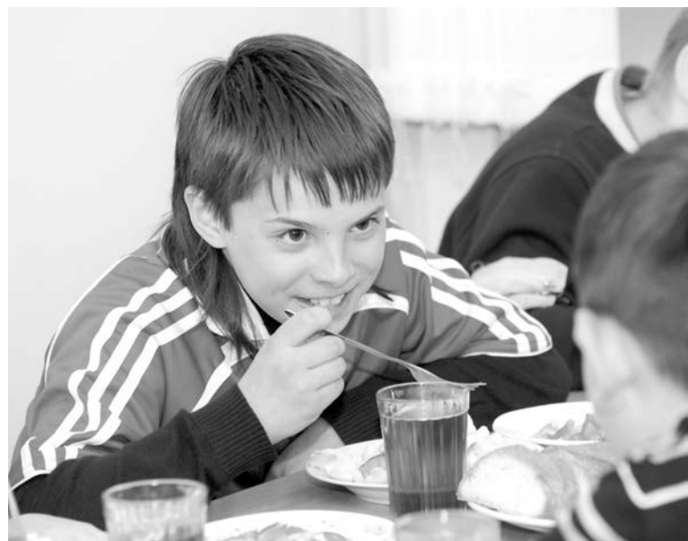
Чтобы сил хватило на все запланированное, нужно хорошенько подкрепиться.

В июне, как обычно, на базе северноморских школ начали свою работу летние площадки для школьников. В этом году их работа претерпела существенные изменения. Вместо трех смен, как было раньше, они проработают всего одну.