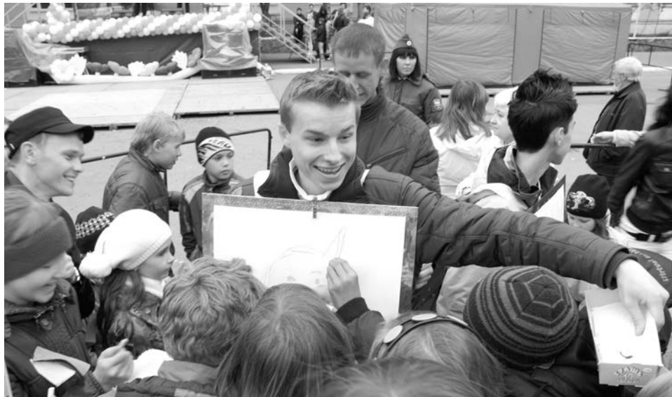
В художественном конкурсе «Я люблю Россию!» предлагалось выразить свои чувства к родной стране. Желающих оказалось много. В итоге получилась яркая картина-мозаика.