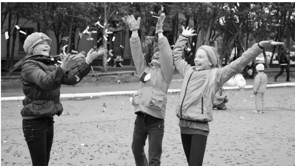
Самыми стойкими участниками праздника были дети. Они радовались разноцветному дождю из конфетти, несмотря на накапывающий настоящий.