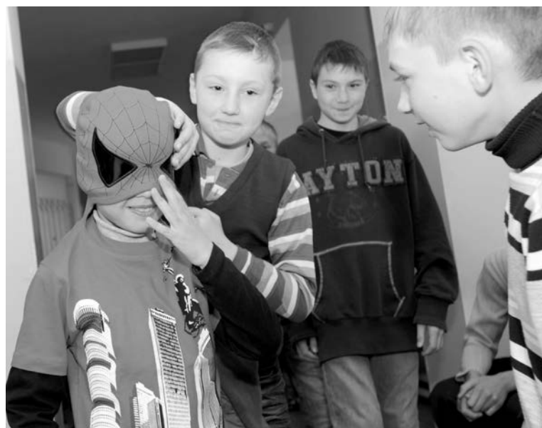
Находиться в компании друзей ребятам нравится больше, чем сидеть дома перед компьютером.

Независимо от того, какое количество детей останется в Северноморске в июле и августе, полного прекращения работы площадок не будет. У детей останется возможность свободно посещения различных учреждений дополнительного образования, со списком которых пе-