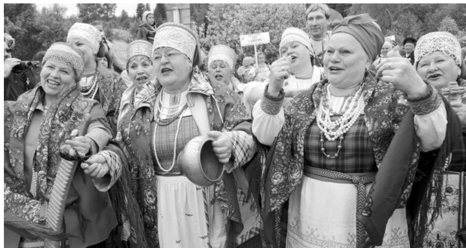
«Мы девчата боевые, мы девчата с огоньком. Про себя частушки эти мы с задором пропеём».

встречали дорогих гостей на мосту традиционной рыбной кулебякой и хлебным квасом. Второй день праздника совпал с православной Троицей. Каждый творческий коллектив подготовил театрализованное представление, а рукодельники из «Города мастеров» поделились секретами прикладного творчества.