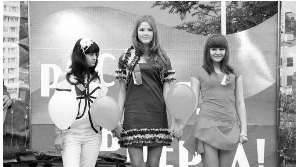
Театр моды «Энканто» представил новую коллекцию костюмов в российском триколоре.