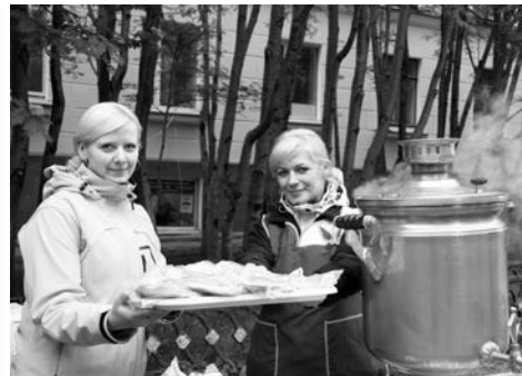
Праздничная торговля из-за плохой погоды шла неактивно, но у самовара было многолюдно.