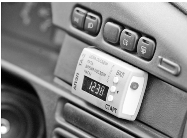
Еще один парадокс: в законе прописано обязательное наличие таксометра, но не говорится, что плата взимается согласно его показаниям.