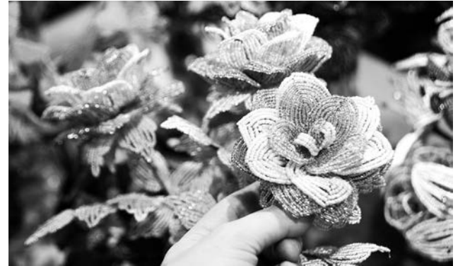
Когда за окном зима, от такой красоты не хочется отводить взгляд.

Ирина ПАЛАМАРЧУК.