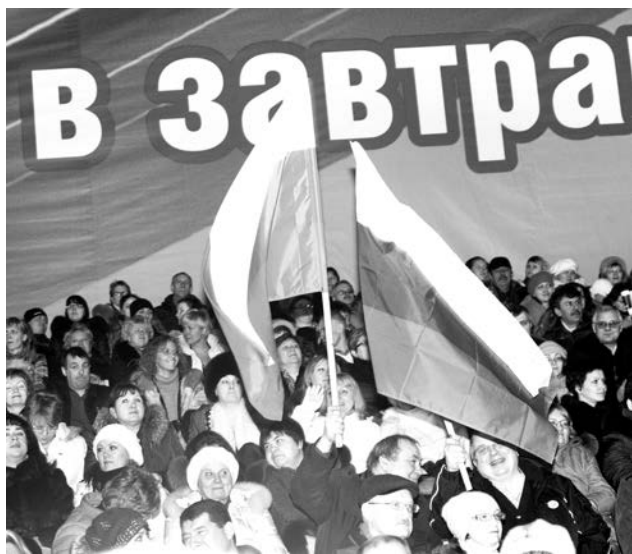
Участники митинга дружно скандировали лозунги в поддержку курса В.Путина.