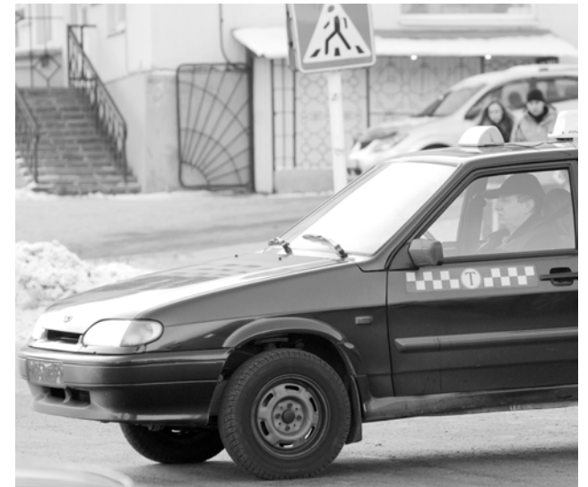
Единый цвет такси в нашем регионе отменен. Но шашечный пояс и фонарь – обязательные требования к легальным перевозчикам.

тель рассказал, что вскоре изменится и сама система пользования услугами такси. За посадку будет взиматься плата от 50 до 250 рублей, к которой приплюсуются расходы на бензин в соответствии с километражем. Цены станут определять сами фирмы.