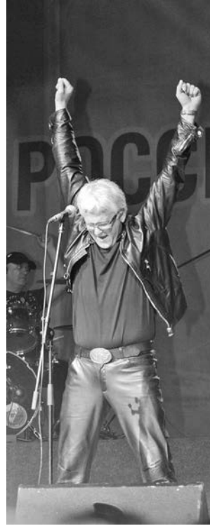
Митинг поддержал заслуженный артист РФ Александр Маршал.