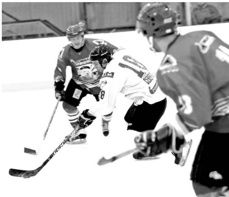
Реванш не завершился разгромом, но тем интереснее была сама игра.

Ожидания оправдались: за 10 минут до конца основного времени на табло горели две пятёрки. Исход встречи могла решить всего одна шайба, однако счет успел измениться трижды. Хозяева одержали верх со сче-