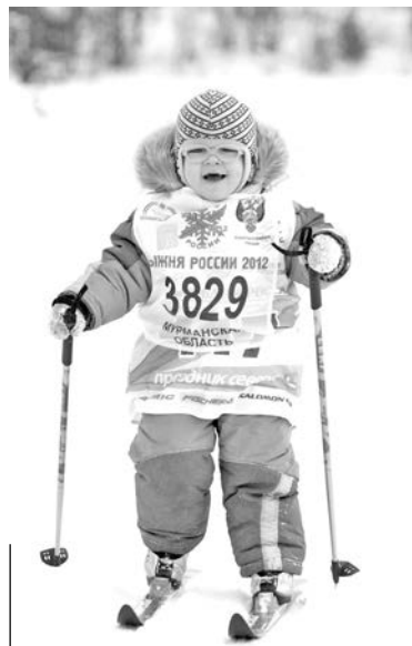
Наконец и самые юные лыжники дождались своего шанса принять участие в этой гонке.