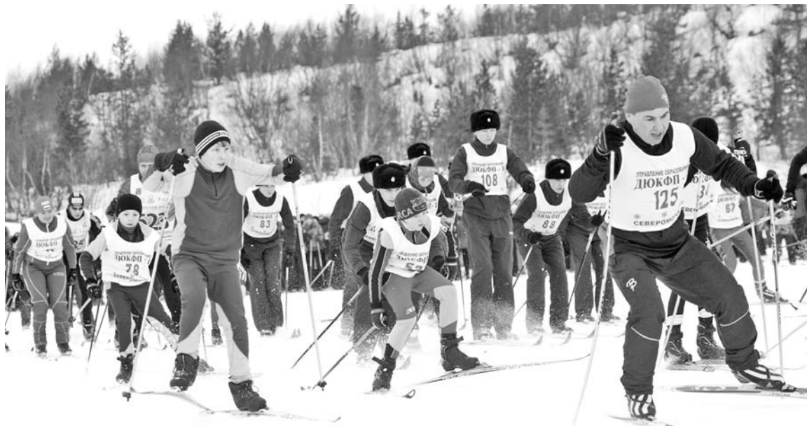
Уже 30 лет «Лыжня России» объединяет сотни людей всех возрастов и профессий.

В небесной канцелярии позаботились о том, чтобы гонка получилась действительно массовой: мороз спал, легкий ветер не стал препятствием для 360 человек, решивших присоединиться к спортивному празднику. Среди них впервые заняли