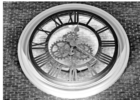
Часы для фасада изготовили в Петербурге по спецзаказу.