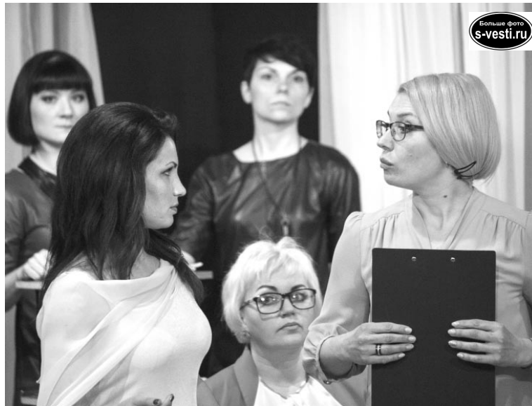
Фрагмент спектакля «Комната невесты», премьера прошла в апреле этого года.

Есть у нас и специальные тренинги - смехо- и слезотерапия. Последняя дается ребятам особенно хорошо, и это здорово, они