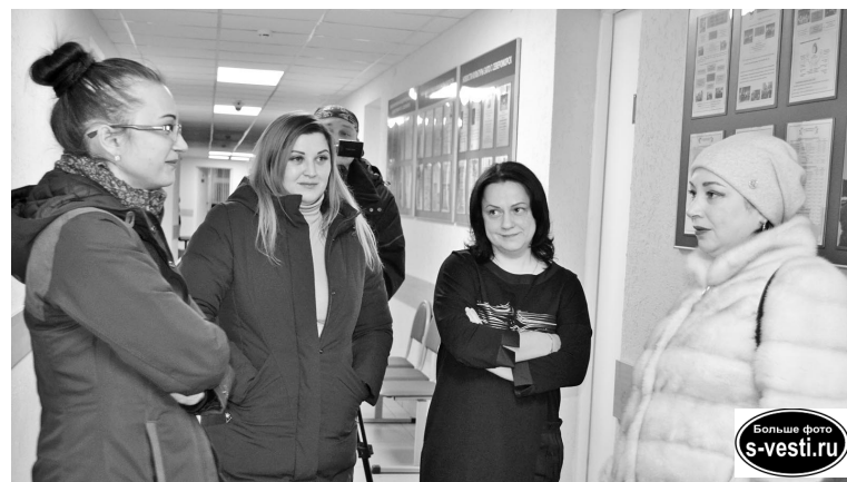
Инициативная группа микрорайона ул.Падорина и Инженерной убедила, что личный прием главы информативней, чем слухи в соцсетях.

- Начнем с подъезда: комиссия от КРГХ и составление акта были еще в августе 2019 года, УК должна отремонтировать объект до 31 декабря 2019 года, - сказал