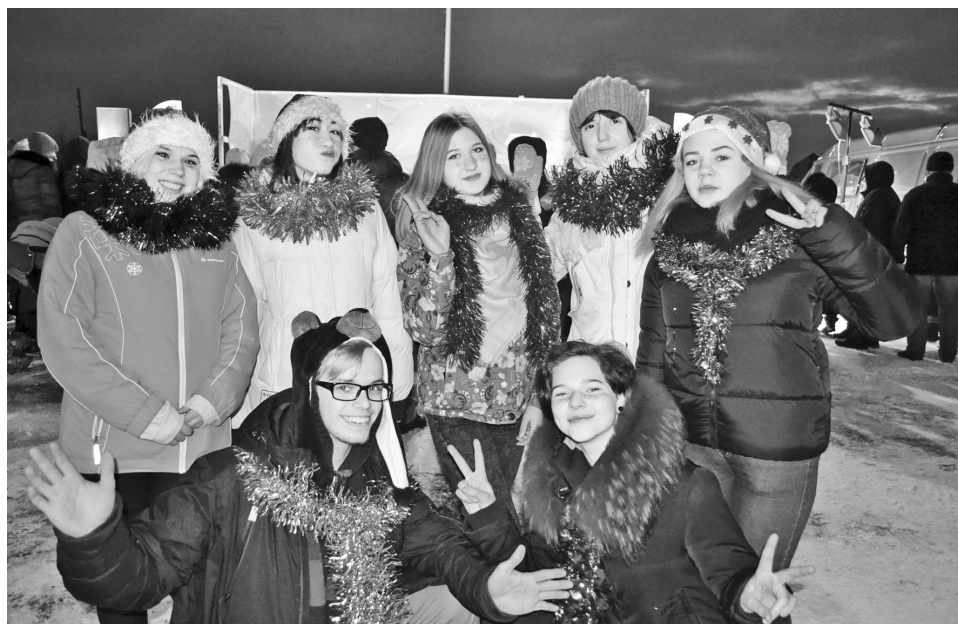
Волонтерская организация «Дива» создает праздничное настроение.

Около ста североморцев приняли участие в предновогоднем первенстве Североморска по фитнес-аэробике на призы Деда Мороза «Ёлка в кроссовках».