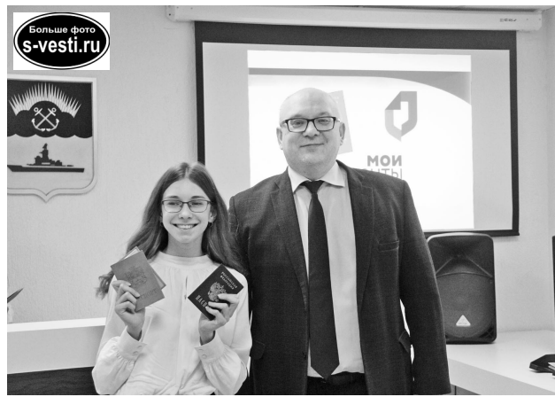
Получить свой первый паспорт в торжественной обстановке желает все больше школьников.

- Интересное мероприятие. Готовилась ли? Выбирала блузку. Мама пообещала, что отметит это дело – купим торт. Здесь сказали, что можно