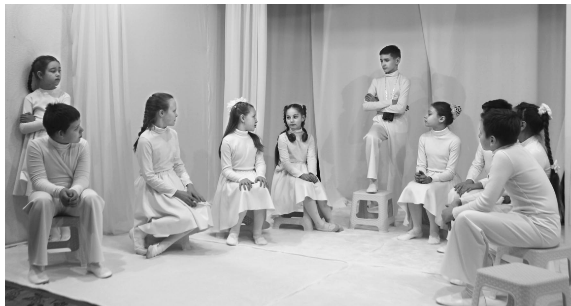
Премьера спектакля «День рождения» прошла в декабре этого года. В постановке задействован средний состав актеров «ЗАТО ТЕАТРА».