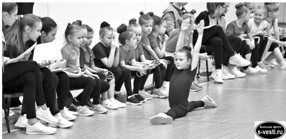
В традиционных соревнованиях «Ёлка в кроссовках» приняли участие порядка 130 юных спортсменов: 97 продемонстрировали физическую подготовку, остальные были задействованы в судейской и организаторской работе.