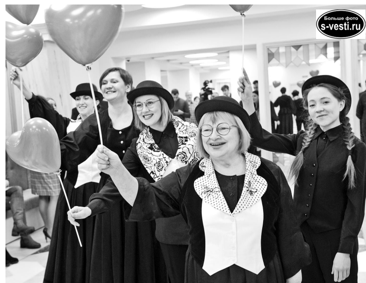
Новому дому артисты кукольного театра рады, пожалуй, даже больше, чем зрители.

По материалам газеты «Мурманский вестник», Екатерина АНДРЕЕВА.