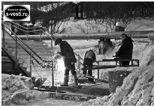
Трап от Верхнего Сизова к Нижнему – первый в городе, на котором проводятся столь масштабные работы.

Начали искать пути выхода из сложившейся ситуации и решили переместить месторасположение спуска к памятному знаку. Уже после согласования земляных работ выяснилось, что здесь проходят электрические ка-