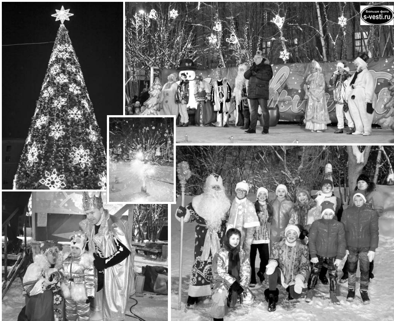
Старт новогодним торжествам дали во флотской столице и в п.Сафоново. На ближайшие выходные эстафету принимают поселки Щукозеро, Сафоново-1 и Североморск-3.