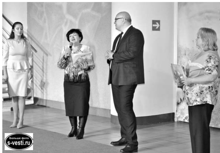
«Стеза милосердия» впервые приняла участие в «Добром Североморске». Руководители организации оценили весомое подспорье акции для своих подопечных.

В итоге общая сумма собранных средств - 412 тыс. 475 руб.