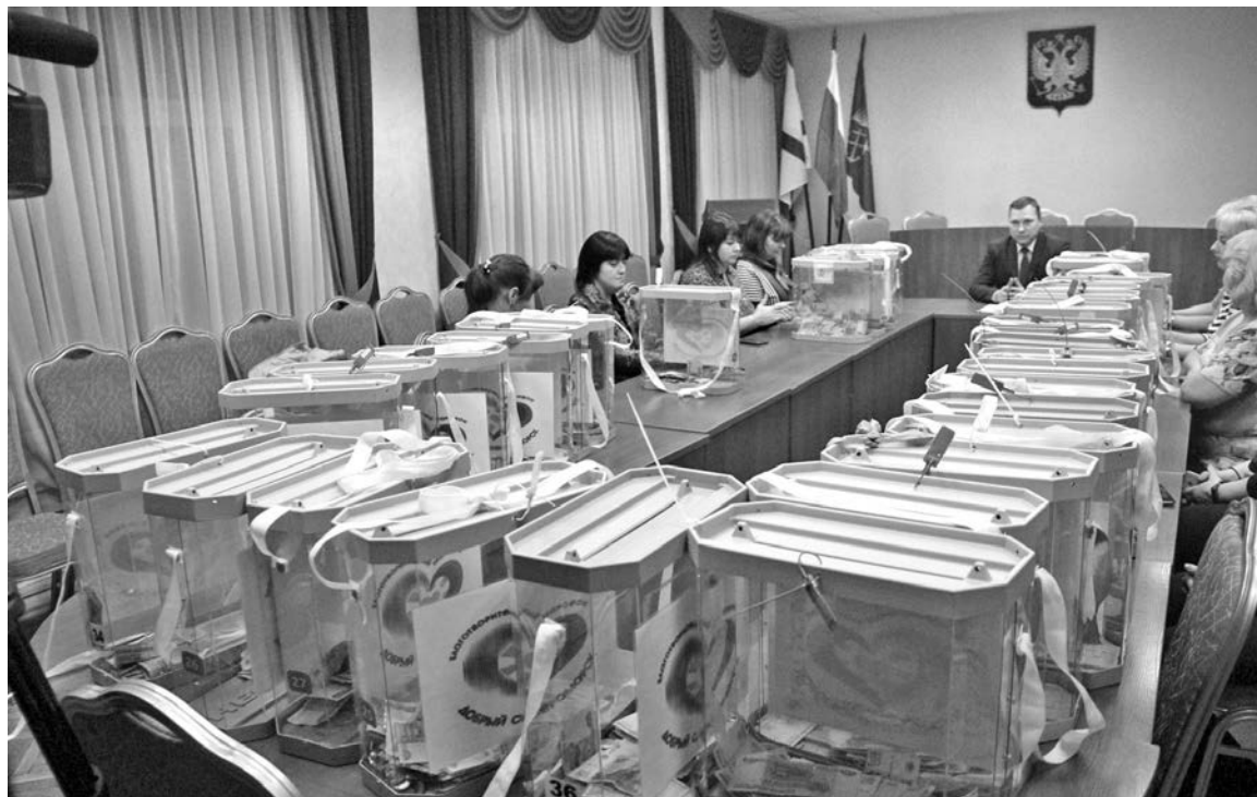
5 декабря боксы, расставленные по всему городу, были собраны, организаторы подсчитали средства.