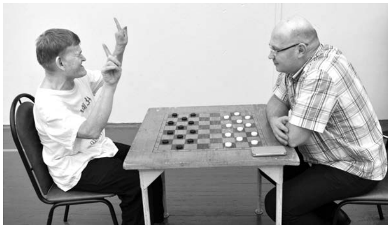
Шашки - традиционная настольная игра фестиваля.

Так организаторы и участники называют ежегодный фестиваль спорта и здоровья для особенных людей.