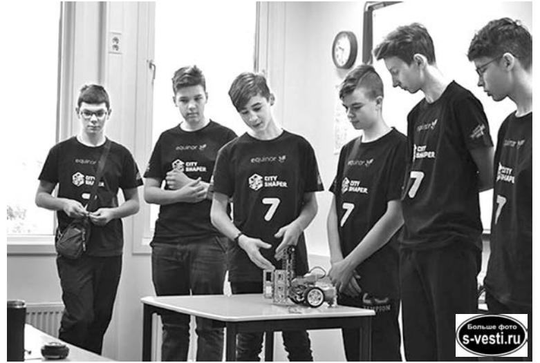
Команда североморцев защищает свой проект на турнире в Норвегии.

морск на престижнейших международных соревнованиях. Он также пообещал профинансировать закупку необходимого оборудования для занятий по «Робототехнике» в СЮТ.