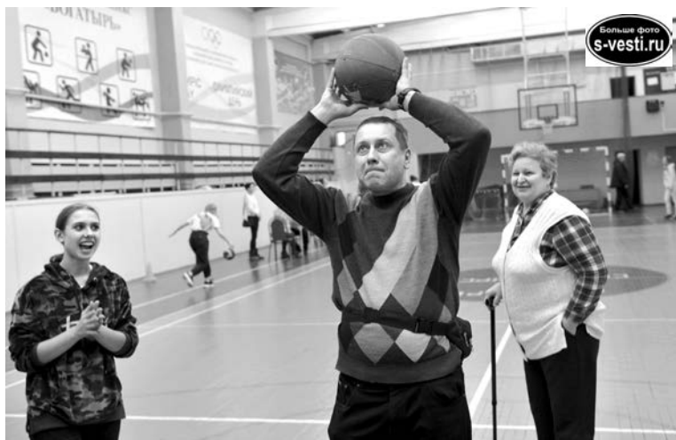
Несмотря на ограничения по здоровью у участников, спортивные игры вызвали неподдельный интерес.