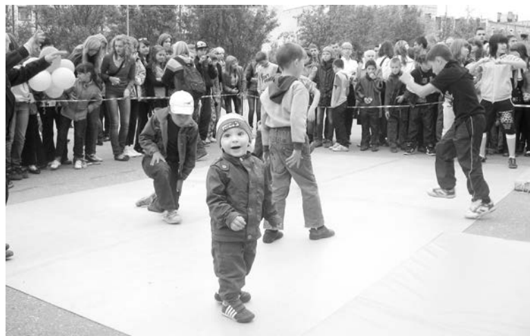
Во время пауз на импровизированную сцену выходили и маленькие зрители.