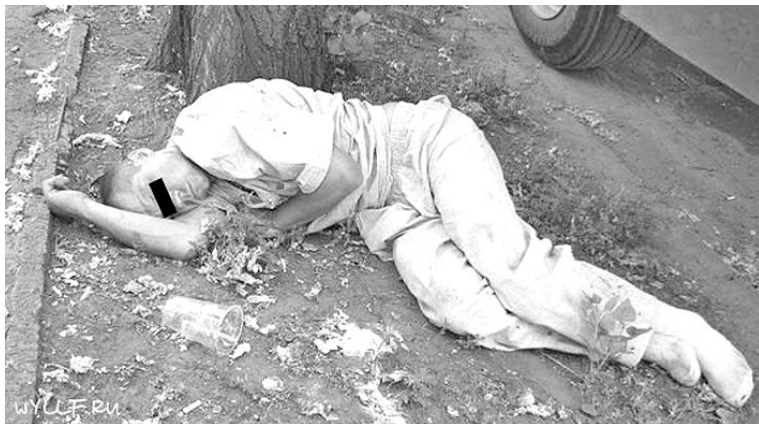
По данным ВОЗ, необратимое угасание этноса начинается, если в стране в год на душу населения потребляется 8 литров спирта. В России этот порог превышен вдвое.

Сравнивая количество выпитых литров спиртосодержащих напитков у нас и за рубежом, многие приходят к выводу, что по количеству потребляемого алкоголя Россия стоит не на первом месте. Несмотря на это, положение нашей страны крайне тяжелое и совершенно не может идти ни в какое сравнение с государствами Европы. И одно дело количество потребляемого алкоголя,