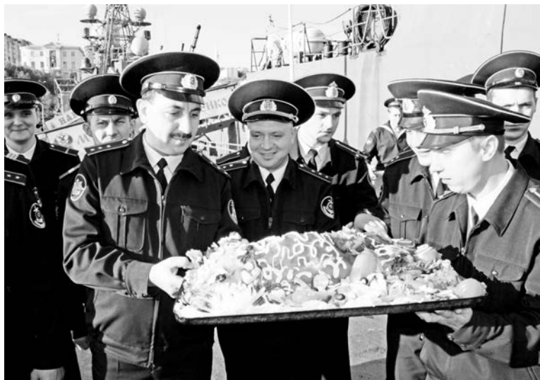
По старой флотской традиции экипаж «Владимира Гуманенко» встречали жареным поросенком.

Адрес электронной почты: gzhssf@yandex.ru