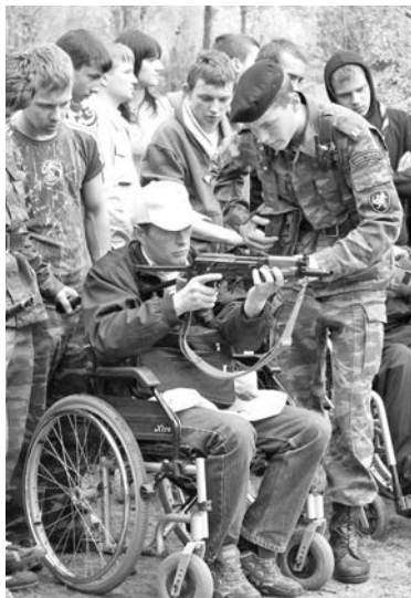
Незабываемые впечатления ребята получили в пневматическом тире.

Навыки борьбы за жизнь представителям всех команд довелось продемонстрировать в полной мере, ведь традиционная часть турслета – соревнования