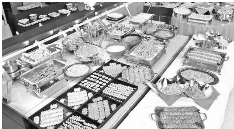
Обеспеченные россияне все чаще пользуются услугами организаций общественного питания: и быстро, и вкусно, и посуду мыть не надо.

Питание в домашних хозяйствах становится более сбалансированным, с точки зрения современной диетологии. Наблюдается дальнейшее увеличение объема потребления молока и молочных продуктов (с 18,9