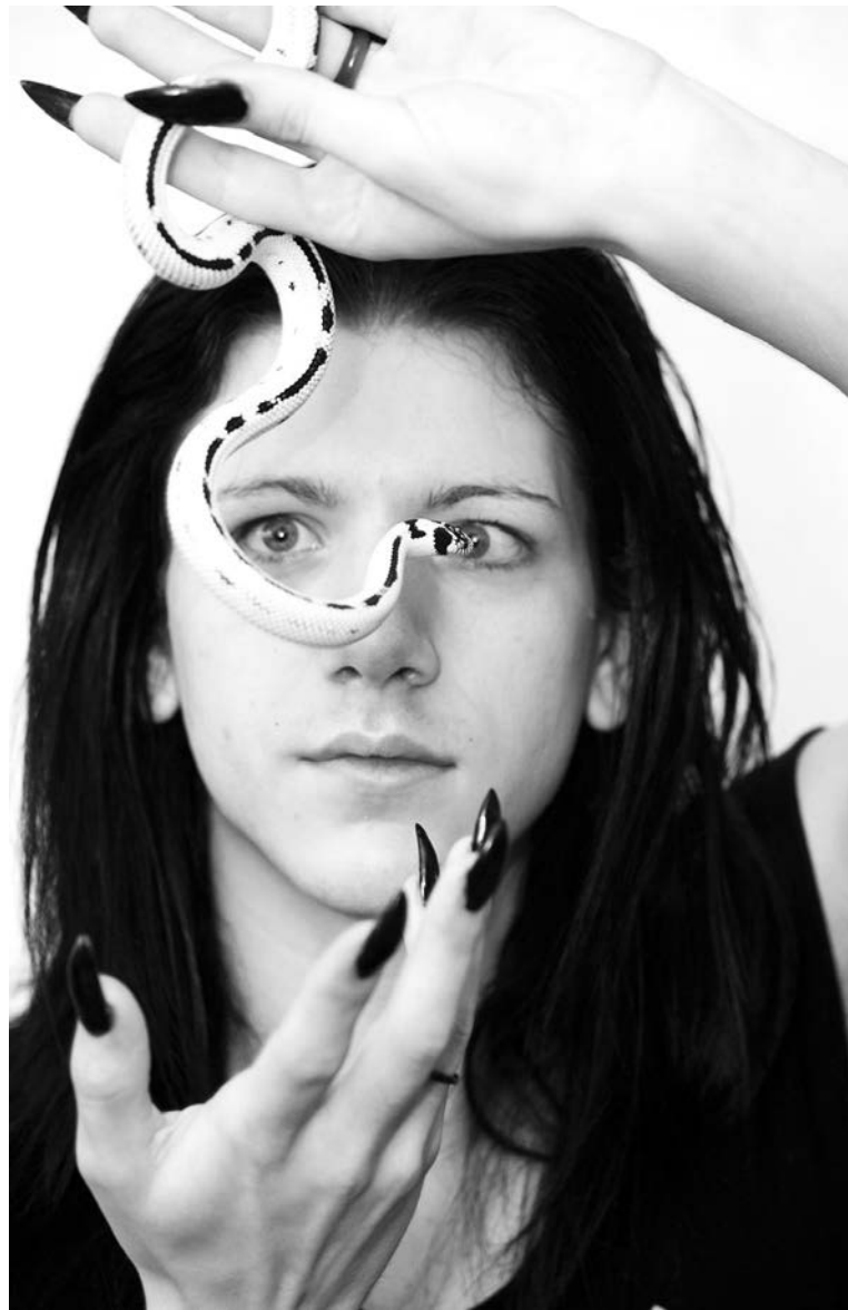
Калифорниец Люциус, как и все змеи, имеет гипнотический взгляд.

Не все любят змей, но при знакомстве с Люциусом меняют свое отношение к пресмыкаю-