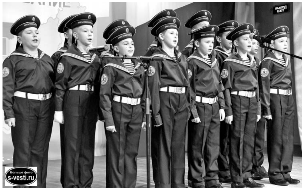
В работе слета впервые приняли участие североморские кадеты.