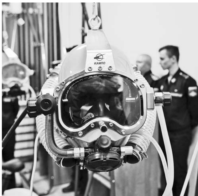
Тренажер позволяет создать имитацию сопротивления дыханию при работе в аппаратах АВМ-12К или ИДА-71, ИДА-72В, «Амфора», смоделировать переход на резервный запас воздуха и попадание воды в поглотительный патрон.