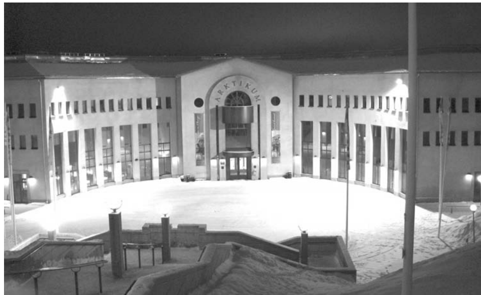
«Арктикум» – единственный музей Рованиеми, работающий в выходные.