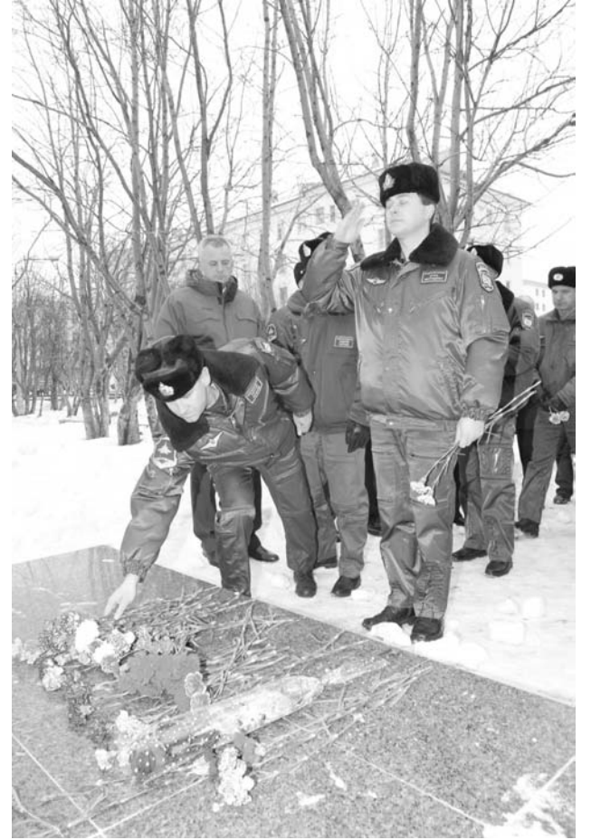
Рука сама взлетает к виску: Апакидзе не только Герой России – он старший по званию.