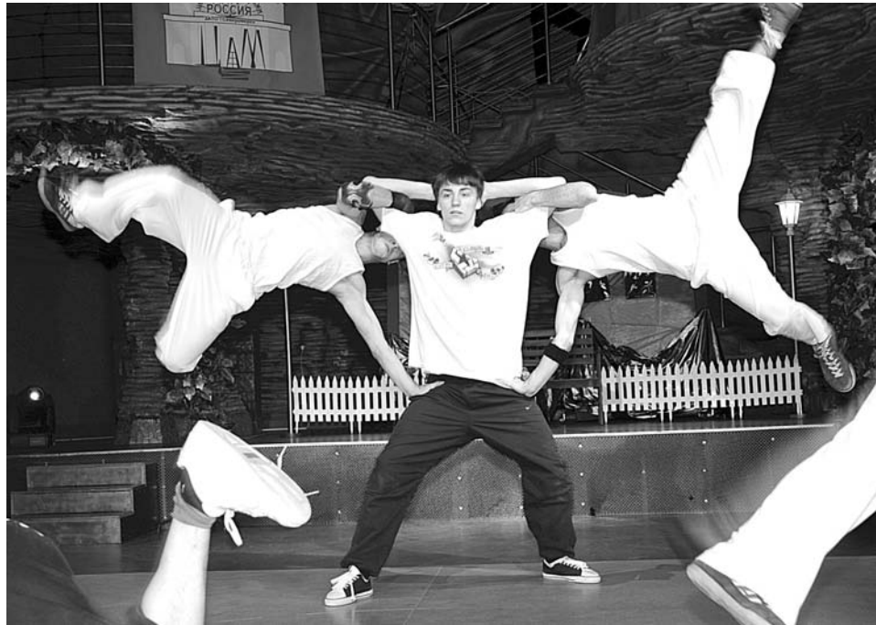
Элементы брейк-данса сродни цирковым кульбитам.

альной битвы была дружелюбной и радостной. Выступления каждого коллектива сопровождались овациями, а самые активные зрители пускались в пляс.