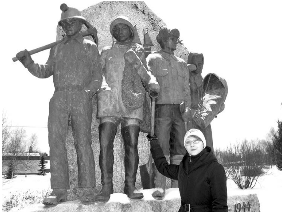
Въезжающих в Ивало встречают металлические изваяния шахтеров.

Останутся довольны и любители зимних развлечений. Прелести так называемого арктик-сафари предлагают несколько турфирм Рованиеми, подробную информацию о которых можно узнать в отеле. 2-часовая поездка на снегоходах будет стоить около 100 евро на человека, ночное путешествие по заснеженному лесу под луной – на 10 евро дороже. За три часа в оленьих и собачьих упряжках придется отдать 120 европейских банкнот. Дешевле всего обойдется лыжная прогулка – 57 евро за три часа. Порыбачить на озере вас вывезут за 105 евро. Поклонники экстремальных видов спорта смогут отвести душу в горнолыжном центре на сопке Оунасваара. Он включает в себя 6 горнолыжных трасс, спуски для