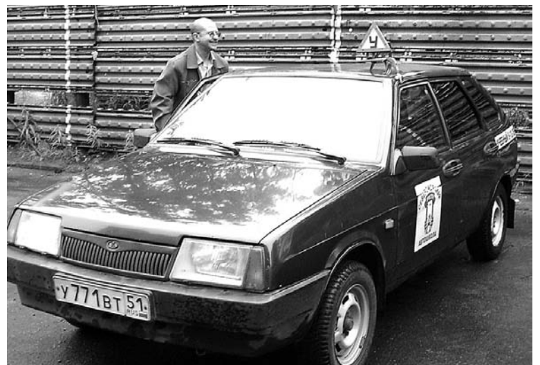
В автошколе РОСТО целый автопарк: 7 легковых машин, 5 грузовиков, 2 мотоцикла, автобус и прицеп.

- С 1 июля этого года планируется оборудовать каждый автомобиль средствами технического наблюдения. А это значит, что экзамен по вождению будет записан на видео. Такое видеонаблюдение позволит избежать спорных ситуаций, часто возникающих между экзаменатором и