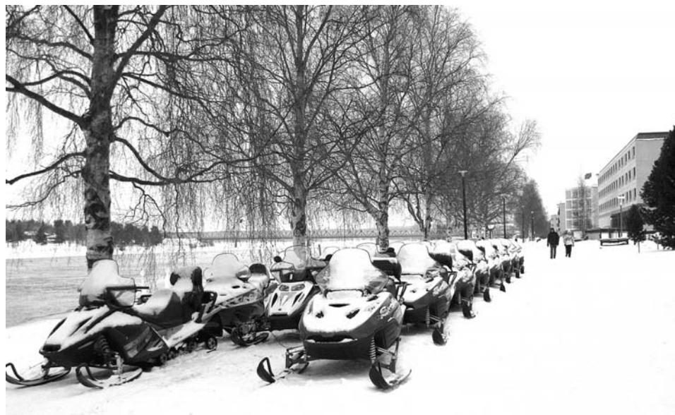
К полудню снегоходов вдоль реки поубавится: разберут туристы.