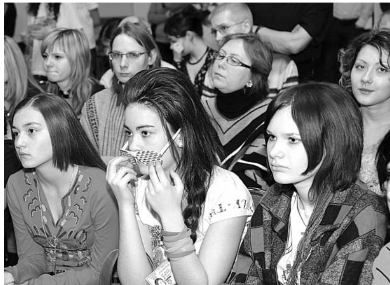
Ни один совет профессионалов не прошел мимо юных пытливых фотографов.