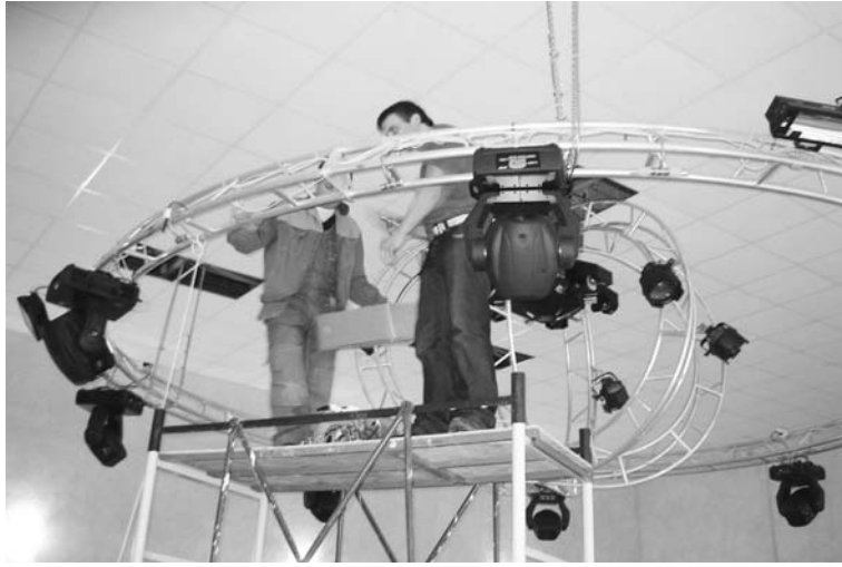
Чтобы обучить специалистов «Судоремонтника» рисовать светом с помощью нового оборудования, требуется время.