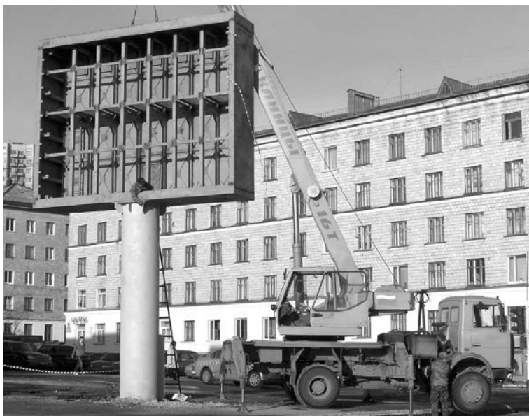
За установкой экрана североморцы наблюдали весной 2007 года...