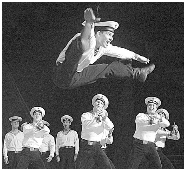
23 февраля артисты Ансамбля песни и пляски КСФ выступали в Кремлевском дворце с визитной карточкой коллектива – танцем «Яблочко».

Подготовила Елена ЯКУНИНА.