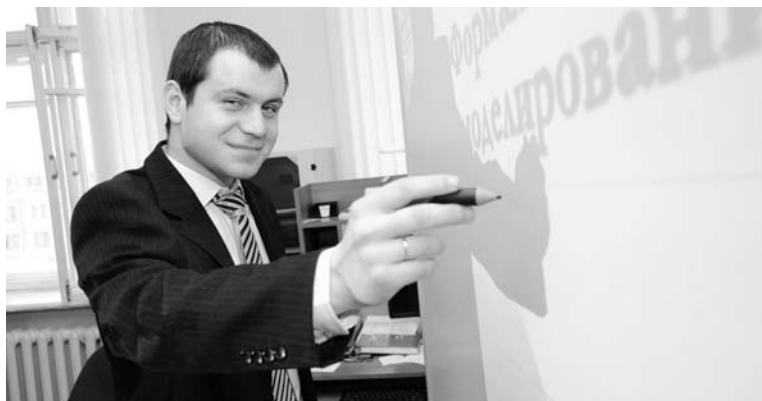
Педагогический метод Максима Кузнецова: сложное объяснять простыми словами.