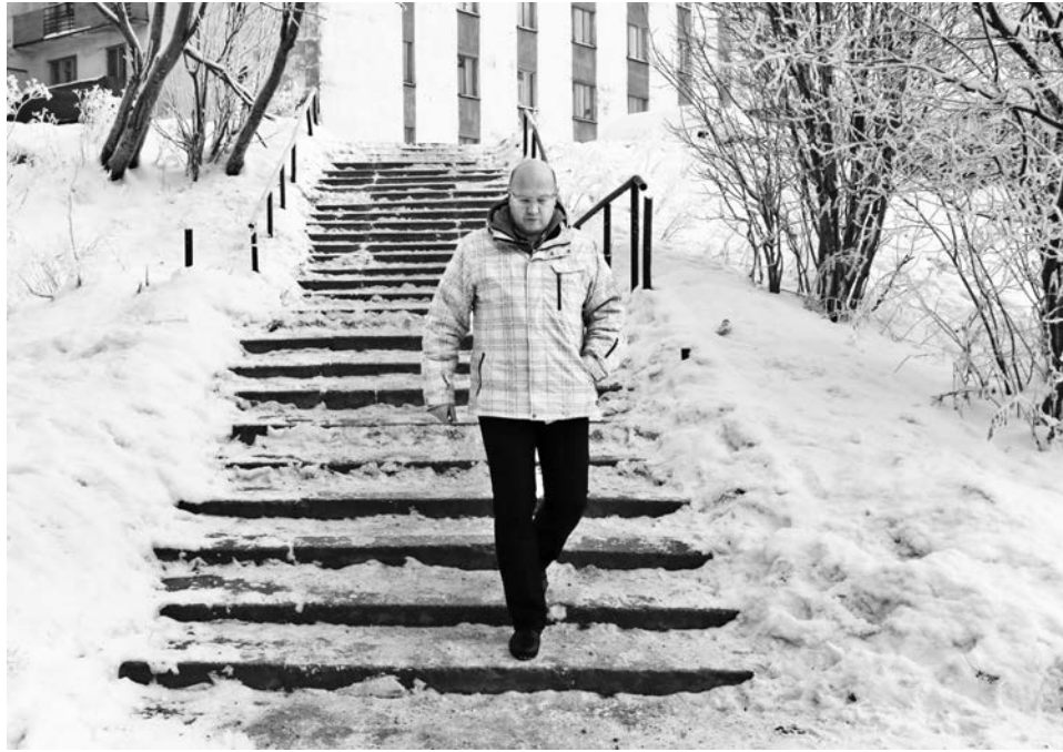
Как почищены городские вертикали, Эдуард Миронов проверяет лично.