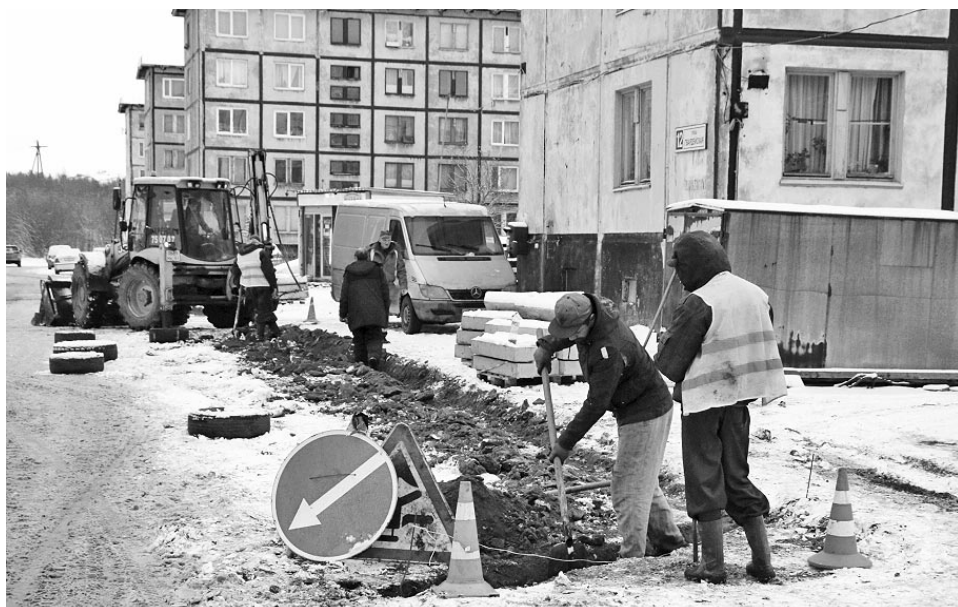
На ул.Гвардейской было заменено около 700 м 2 асфальтобетонного покрытия. Работы проведены за счет средств, сэкономленных после конкурсных процедур и ремонтных работ.