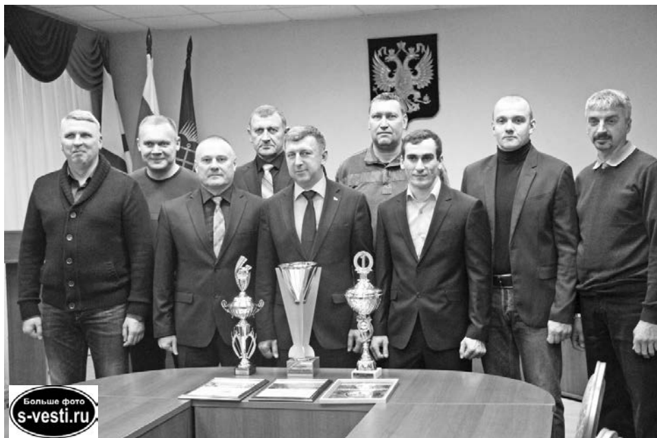
Коллектив «Североморскводоканала» органичен везде: на замене труб, на волейбольной площадке и на встрече с главой города.

Команда «Североморскводоканал» в октябре победила на впервые проводившемся отраслевом турнире по волейболу «Кубок чистой воды» в Москве. И на этом не успокоилась.