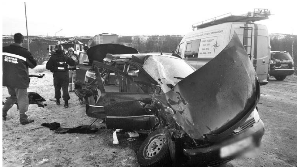
Авария от 30 октября на 4 км автоподъезда к Северноморску в статистику по ЗАТО не вошла, однако итога это не меняет - двое погибших.