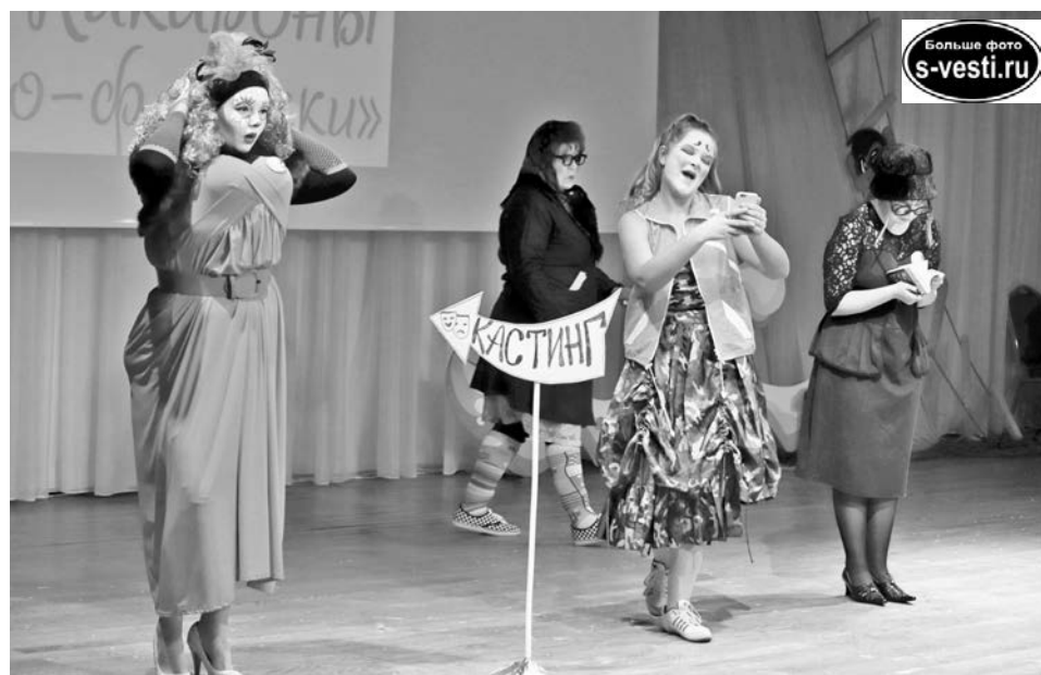
Фрагмент пантомимы «Разные в ЗАТО».