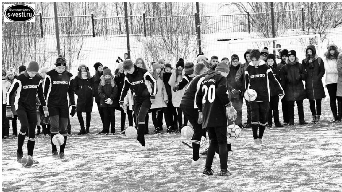
Воспитанники ДЮСШ-1 демонстрируют фрагмент учебной тренировки по мини-футболу.

нительных средств, выделенных правительством Мурманской области на реализацию этого проекта, появилась возможность завершить их в этом году. Доступна площадка пока для учеников школы и юных спортсменов ДЮСШ №1, расположенной здесь же.