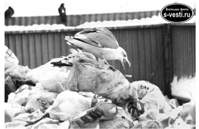
Благодаря работе АДС у североморских чаек всегда богатый рацион.

На заседании межведомственной комиссии по вопросам ЖКХ, которое прошло 7 ноября, также поднимался вопрос содержания дворовых территорий. Замечание управляющим компаниям было