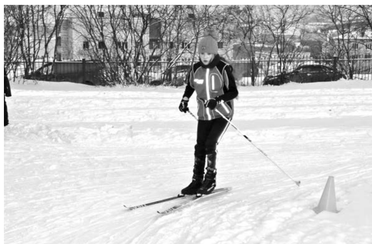
На открытии спортивного корта выступили юные лыжники ДЮСШ-1.