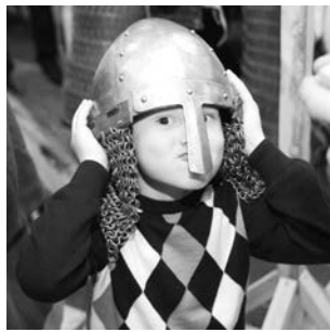
Доспехи реконструкторов пользовались успехом.

Вы когда-нибудь видели нескончаемую очередь мерзнущих на улице людей, стремящихся во что бы то ни стало попасть в музей? Если да, то, скорее всего, это был Эрмитаж или Лувр. В крайнем случае, Мавзолей. Тем не менее, время от времени такую картину можно наблюдать и у дверей мурманского Областного краеведческого музея. Виной всему уже ставшая популярной среди северян «Ночь в музее».