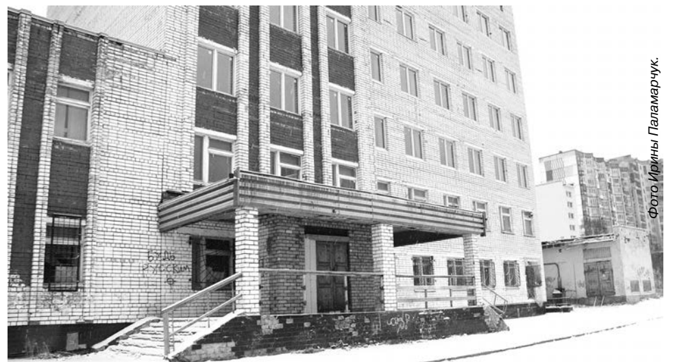
Об окончании ремонта детской поликлиники можно будет судить по парку колясок малышей у крыльца. Пока пусто...

Радует тот факт, что в июне 2012 года работы по детской поликлинике были включены в одну из региональных программ, что потребовало внести изменения в бюджет области. Североморская ЦРБ получила целевые средства в размере 25 млн. рублей только 28 июля. Сразу же были