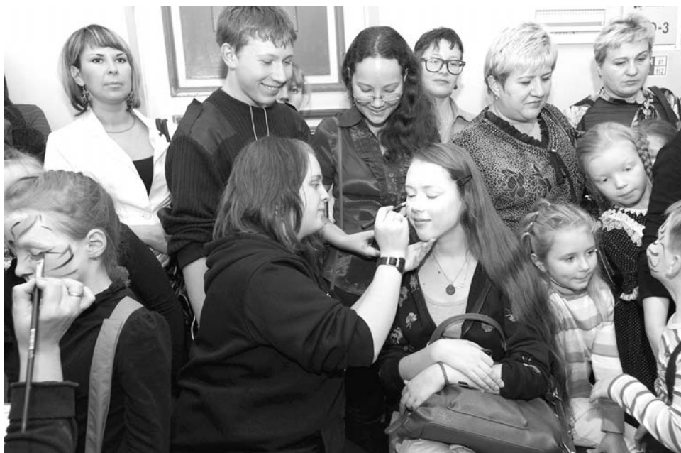
Мастера боди-арта превращали лица участников акции в забавные мордашки.