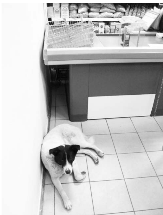
Покупатели и сотрудники магазина не раз подкармливали эту собаку. Так захочется ли ей покидать теплое местечко?