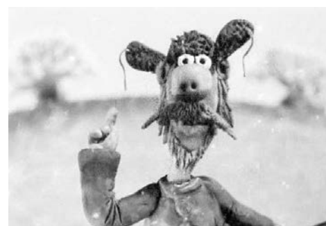
«Уж послала, так послала...»