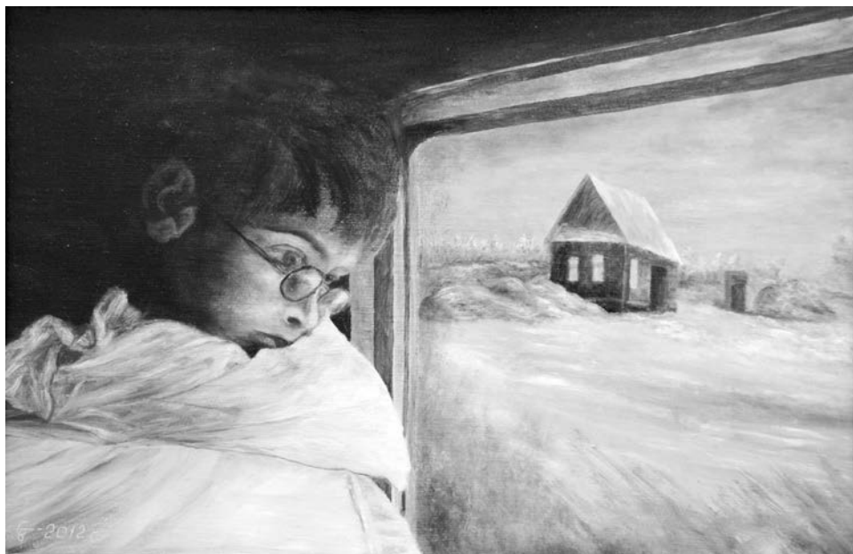
Картину «Былое и думы» и другие работы автора можно увидеть до 7 ноября.