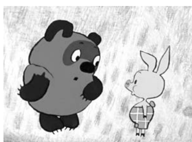
«До пятницы я совершенно свободен!»