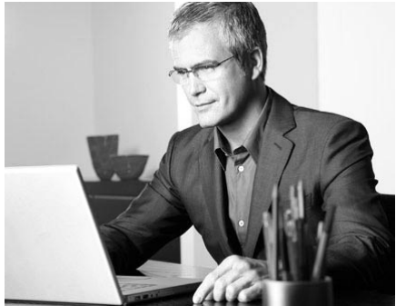
Публикуется на правах рекламы.

Время работы: в будние дни с 11.00 до 19.00, в субботу с 11.00 до 17.00, воскресенье - выходной.