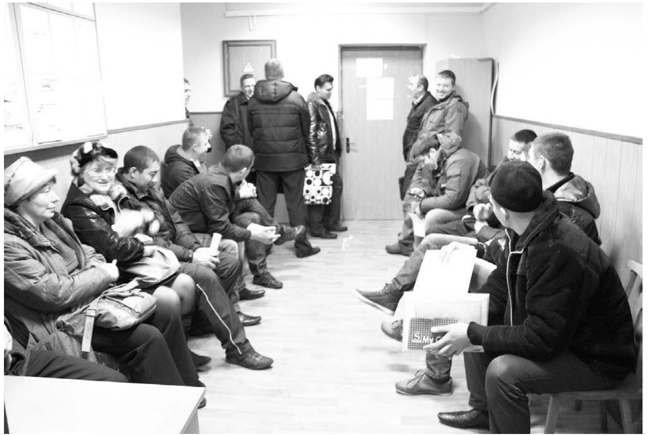
Ждать своей очереди в 4-м отделе Западрегионжилья зачастую приходится стоя – всех желающих в тесном помещении не рассадить.

По официальным данным, нуждающимися в получении служебного жилья признаны около 480 североморцев. Между тем многие из них в Западрегионжилье не спешат. Чаще там бывают те, кто переводится к новому месту службы и вынужден искать добровольца, желающего выехать в освобождаемое им помещение без претензий. Дело в том, что большая часть служебных квартир, занимаемых военнослужащими, находится в так называемом фонде повторно заселения по линии Министерства обороны, то есть принадлежит муниципалитету. А значит, прежде чем выехать из квартиры и сдать ее городу, необходимо привести ее в технически исправное состояние. Без соответству-