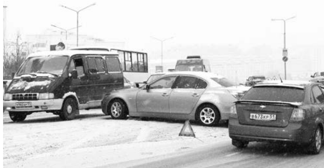
Первый снег – первые аварии: перекресток на Северной Заставе.