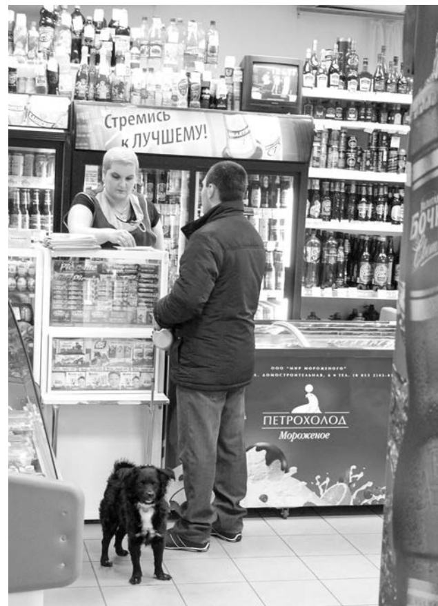
А администрация магазина утверждает, что к ним с домашними питомцами нельзя...

Пусть ни в каких правилах это не прописано, но ведь есть здравый смысл и