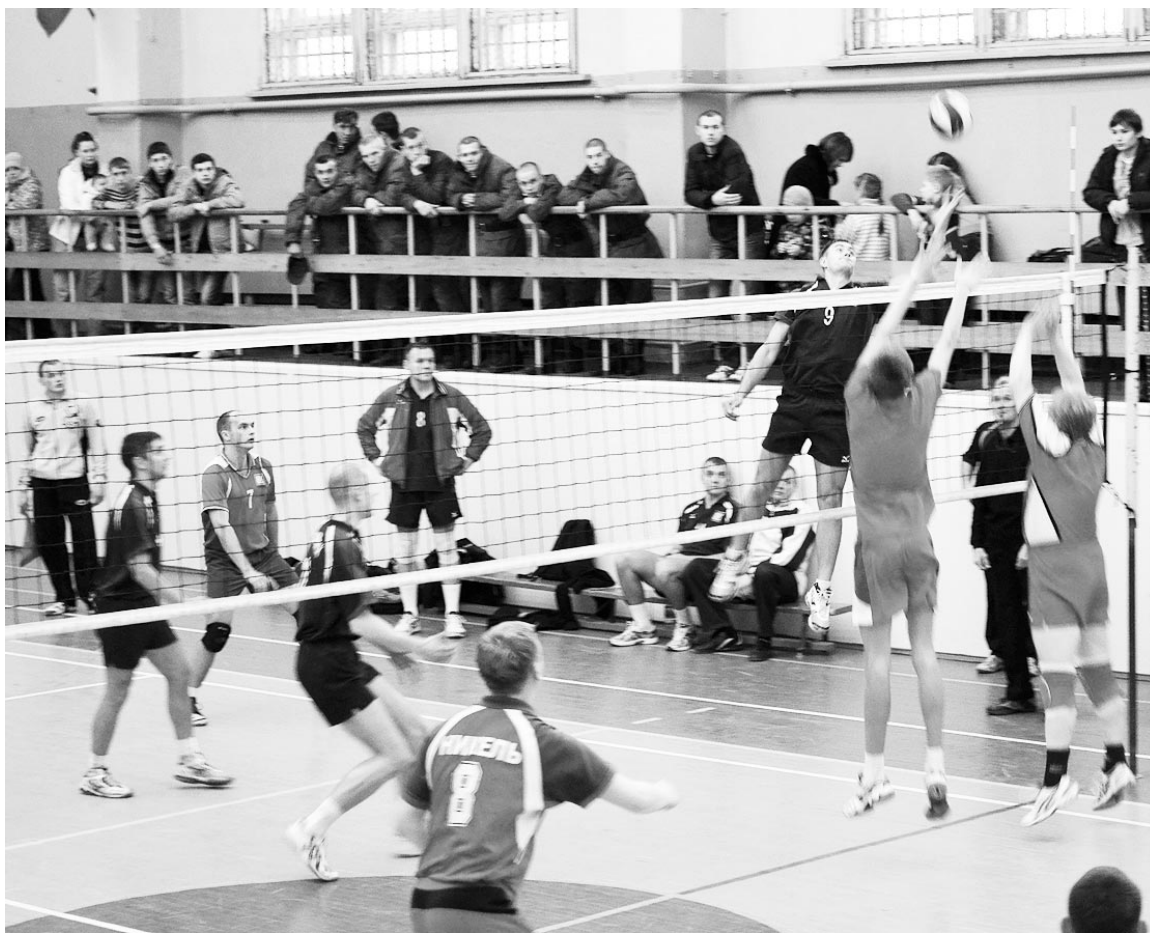
Правильный настрой на игру с любым соперником - залог успеха нашей команды.

Все, кто пришел в минувшее воскресенье в СК «Богатырь», понимали, что исход матча предрешен до его начала, но не отказали себе в удовольствии посмотреть на уверенную игру наших волейболистов. Без раскочки и волнения хозяева с первых секунд вели себя по-хозяйски, не позволяя сопернику практически ничего. Волейболисты «Никеля» лишь пеняли друг другу за постоянные ошибки, которые наши просто заставляли их совершать. А для североморцев, казалось, это была будто бы простая тренировка – настолько легко они взяли верх над гостями. Счет по партиям спортсмены Печенгского района вряд ли захотят вспоминать – 25:13, 25:12 и 25:9. Уже привычные, но от этого не менее любимые и приятные 3:0 – и мы в полуфинале Кубка.