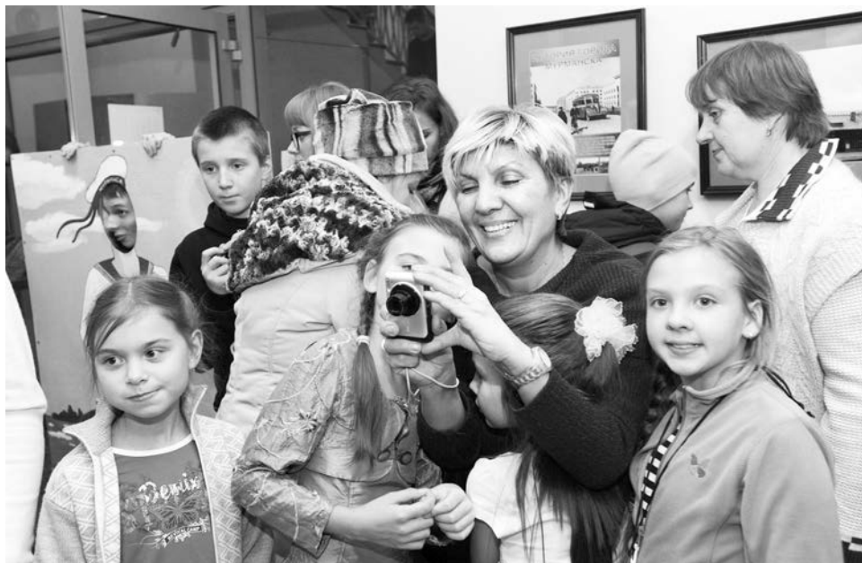
С ходу и не скажешь, кого было больше в музее: детей или взрослых.

Вы когда-нибудь видели нескончаемую очередь мерзнущих на улице людей, стремящихся во что бы то ни стало попасть в музей? Если да, то, скорее всего, это был Эрмитаж или Лувр. В крайнем случае, Мавзолей. Тем не менее, время от времени такую картину можно наблюдать и у дверей мурманского Областного краеведческого музея. Виной всему уже ставшая популярной среди северян «Ночь в музее».