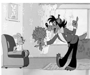
«Ну, заяц, погоди, любимый мой, родной!»