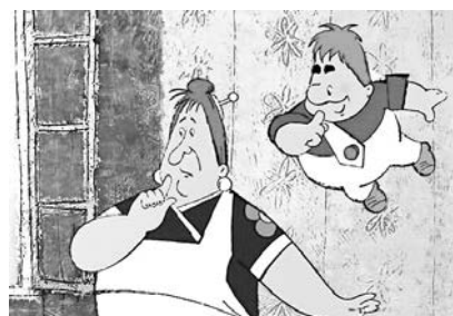
«А вот и не угадал! У меня жужжит в обоих ушах!»