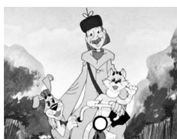
«Я почему вредным был - у меня велосипеда не было!»