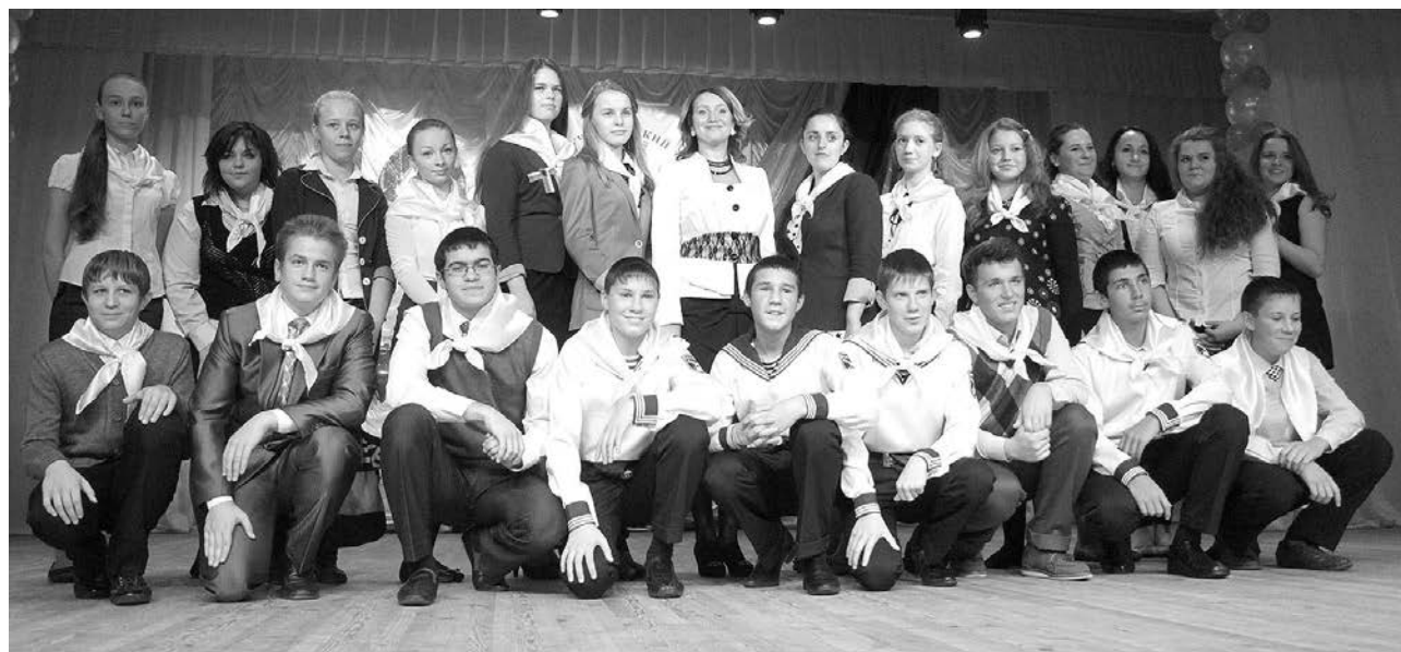
На посвящении галстук с символикой парламента получил каждый его представитель.