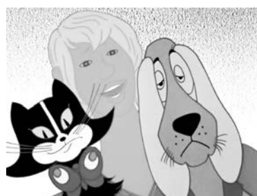
«А, как известно, мы народ горячий...»