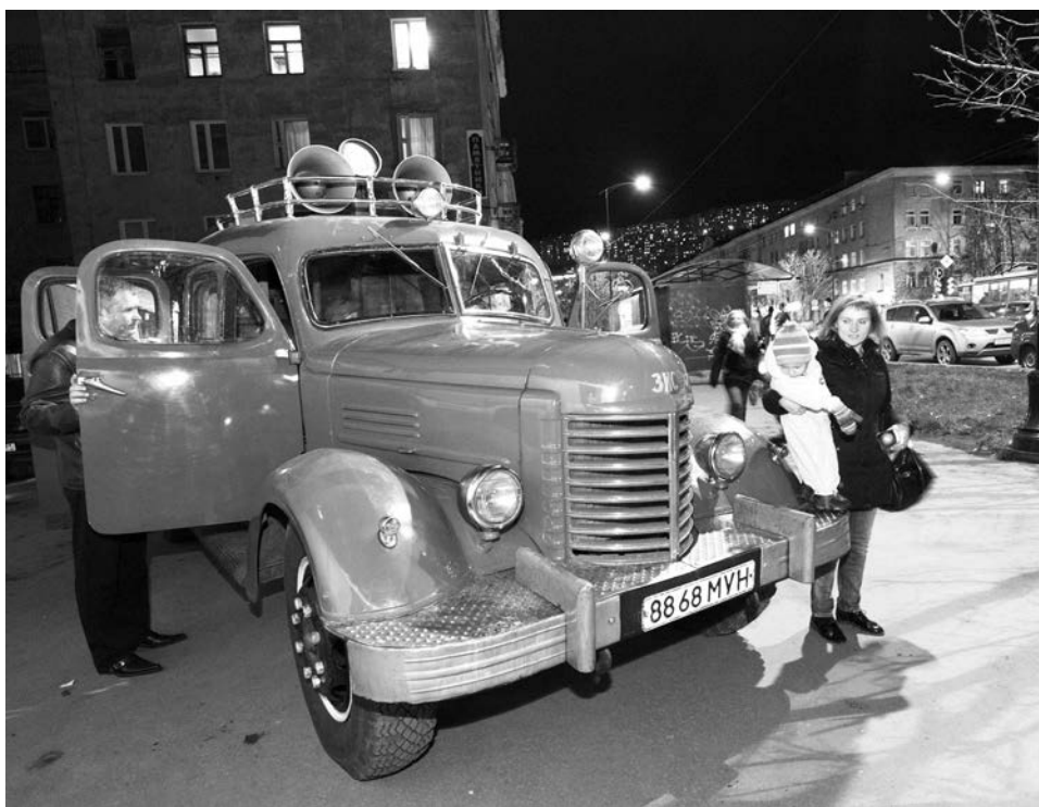
Не только музей распахнул свои двери для всех желающих, но и ретроавтомобили у его крыльца.