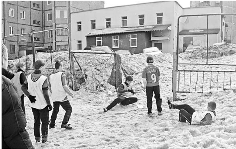
Мокрый снег ничуть не мешает накалу страстей.