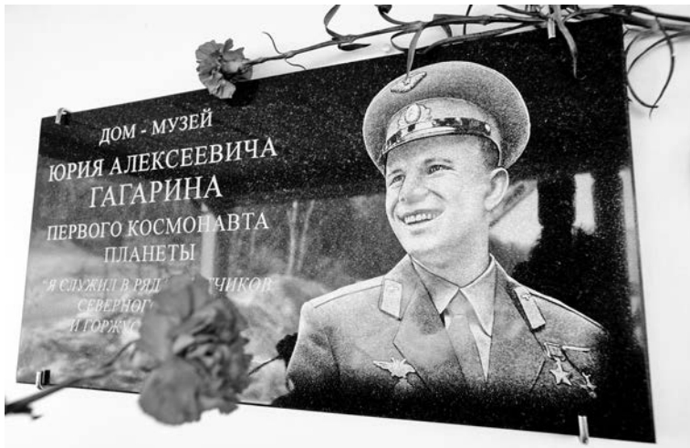
На доске высечены слова из книги Юрия Гагарина «Дорога в космос»: «Я служил в рядах летчиков Северного флота и горжусь этим».

Сафоновский дом-музей – сборно-щитовая постройка, в которой Юрий Алексеевич жил в п.Луостари (сейчас Корзуново) во время службы в 769-м истребительном полку 122-й истребительной авиадивизии СФ. В 1983 году