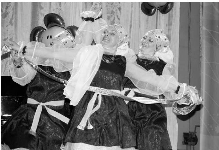
Творческая группа школы №8 выступила с танцем «Тройка».