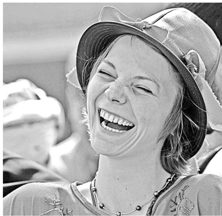
Если заботиться о полости рта, комплекса улыбки не появится.

О стоматологическом здоровье детей на Севере читайте в следующем номере, который выйдет в пятницу, 22 октября, на тематической страничке «Наши дети».