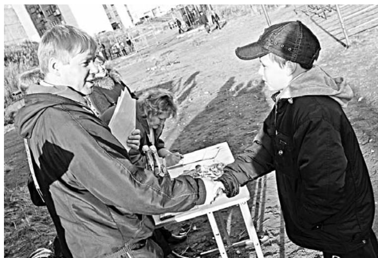
Ни один участник Дня дворового спорта не ушел домой без поощрительного приза.