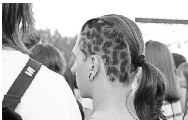
Звериный орнамент в прическах сегодня популярен среди неформальной молодежи.