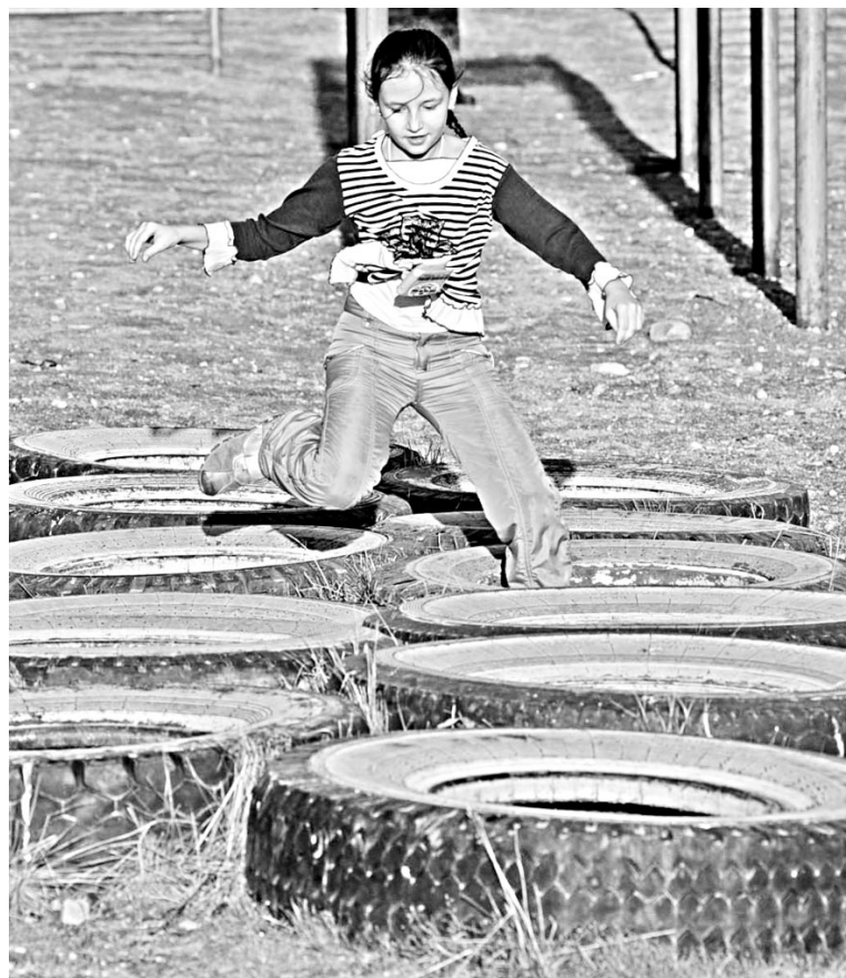
...и преодолевали полосу препятствий. Каждый стремился улучшить собственный результат.