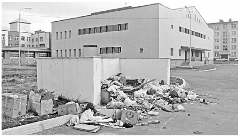
Пока материал готовился к публикации, в Автодорсервис пришло письмо из водоканала о заключении договора на вывоз мусора два раза в неделю, в том числе с территории бани.