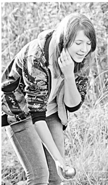
Ребята с ул.Сизова, Падорина, Инженерной, Полярной, Чабаненко играли в бочу...