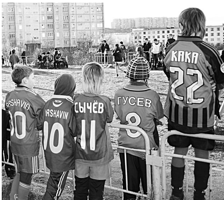
«Звездную» сборную с ул.Морской, Корабельной и Восточной после матча ждало чаепитие в кафе.