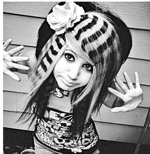
Девушек в стиле трэш часто сравнивают с бунтующими принцессами.

Пару лет назад в моду вошли постижеры (от фр. postiche – «искусственный»,