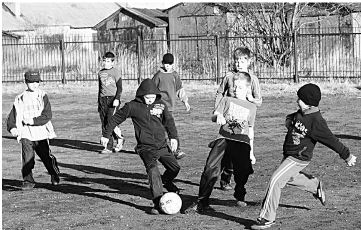
В Росляково прошел поселковый турнир по мини-футболу. В борьбе за первое место страсти бушевали, как на чемпионате страны.