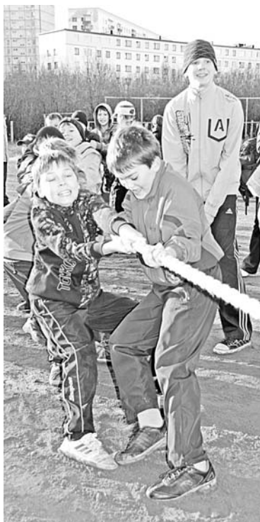
Детвора с ул.Душенова, Сафонова, Ломоносова перетягивала канат и участвовала в веселых стартах.