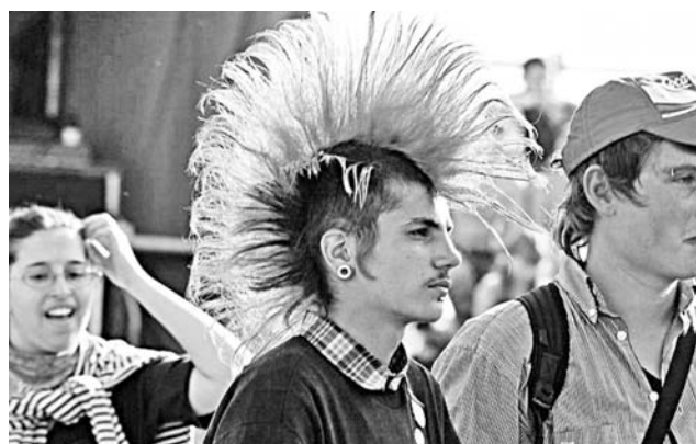
Чем больше лака на ирокезе, тем быстрее он покрывается слоем пыли.