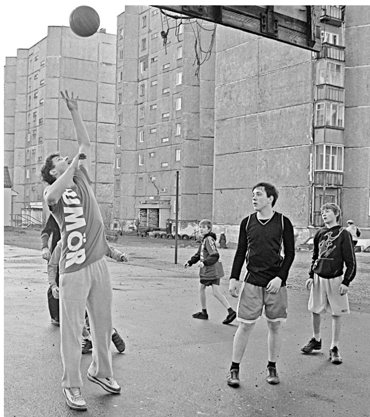
Стритболисты с ул.Комсомольской и Фл.Строителей показали класс.