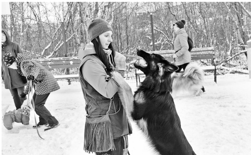
Начало положено! Теперь у собаководов есть своя площадка, на которой они со своими питомцами будут осваивать основы дрессировки и успешно демонстрировать ее на различных конкурсах.