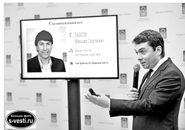
В результате реструктуризации сокращено несколько десятков ставок. Эти средства пойдут на стимуляцию сотрудников.

Не меняет пост и замгубернатора Александр Хомяков, он продолжит курировать вопросы взаимодействия правительства региона с военными, правоохранительными органами и судебными сообществом. Под его кураторство перейдет