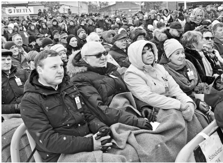
Североморская делегация во время торжественных мероприятий на главной площади Киркенеса.

А уже в саму годовщину освобождения, 25 октября, на главной площади Киркенеса в составе сводного коллектива российских и норвежских музыкантов выступил духовой оркестр "Юниор-бэнд" североморской Детской музыкальной школы им. Э.С.Пастернак.