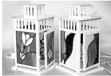
Обычный фонарь может стать произведением искусства, если снять фабричные стекла и заменить их авторскими витражами.

Со стеклом работать очень интересно, но чтобы витраж заиграл в лучах света и стал украшением интерьера, нужно поработать хорошо, - продолжает мастерица. - Начинается все с задумки и макета на бумаге. Затем резка, обточка, подгонка деталей, пайка... Стекло претерпевает много манипуляций, пока в руках не заблестит готовое изделие. Определенного стиля у меня нет, но мне по душе сочетание материалов, например, стекла и дерева, особенно того, что можно найти на северных берегах - оно просолено и обточено морем.