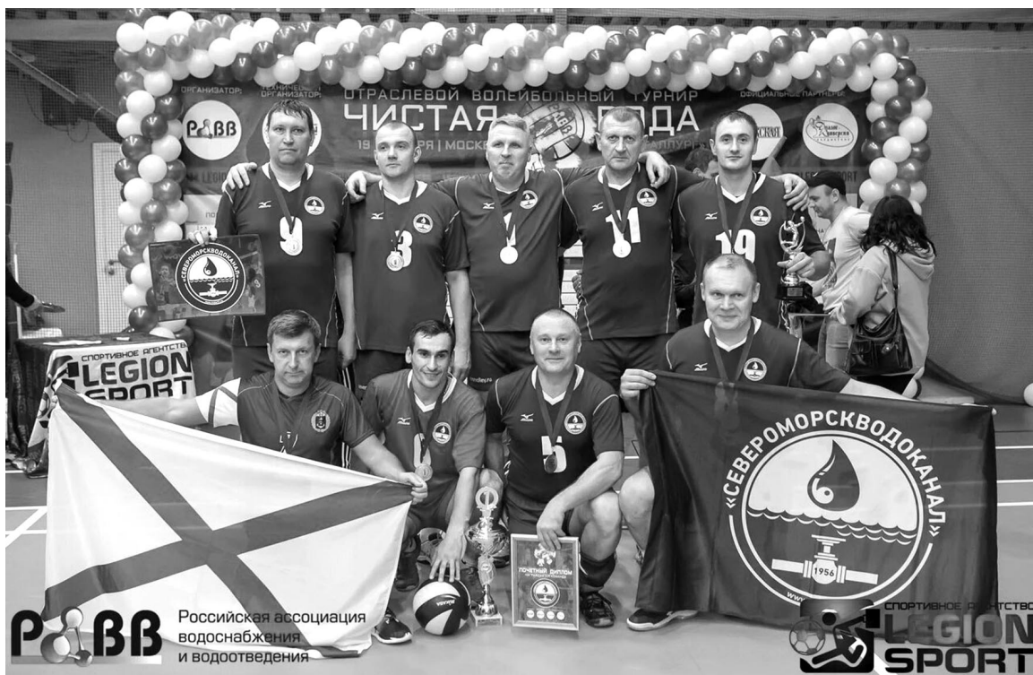
Победа на первом отраслевом турнире ожидаемо досталась «Североморскводоканалу».