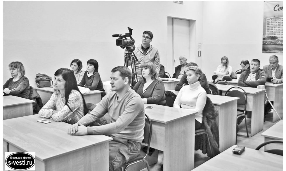
Среди представителей и председателей советов МКД североморцы из разных микрорайонов флотской столицы. Возможно, вскоре к ним присоединятся и активисты из поселков ЗАТО.

- Зачастую собственники квартир считают: пусть кто-нибудь придет – УК, администрация, ресурсник – и решит все проблемы дома, – отметил глава ЗАТО. – Но я могу привести массу примеров, когда никакая из вышеперечисленных структур не имеет права по действующему законодательству принимать какие-то решения. Все решения – за собственниками. Не первый раз поднимается вопрос участия собственников жилья в управлении домом, содержании придомовой территории, и в городе есть примеры, где независимо от того, какая УК работает, каково состояние дома, собственники успешно решают все проблемы. К примеру, от жильцов домов по адресу: ул. Сафонова, 7, 9, 11