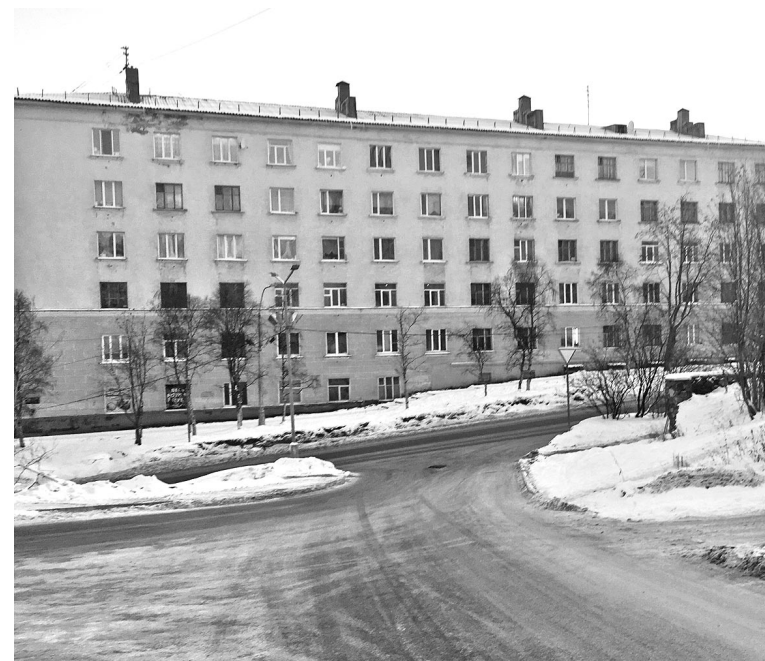
Поворот к детской поликлинике при спуске с ул.Душенова разрешат.