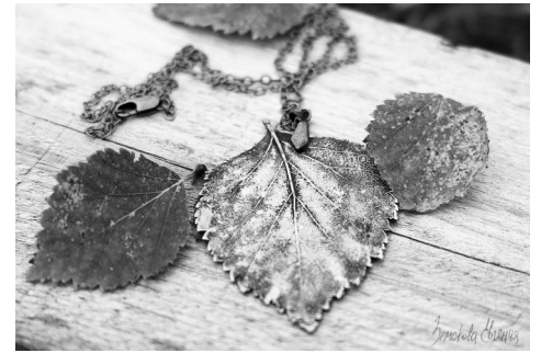
Листик в медной одежде: вот так выглядит природная красота, запечатленная с помощью гальваники.

Украшения из меди и для самой Евгении Земсковой - настоящая магия. Впервые она увидела такую красоту на ярмарке в Санкт-Петербурге.