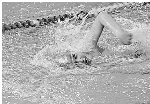
Для результата важны и техника, и выносливость, и боевой настрой.