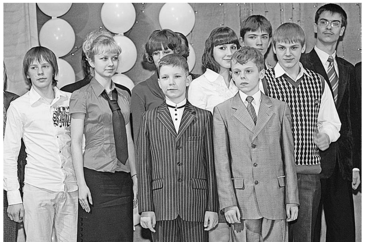
Впереди у этих ребят новые высоты и достижения.