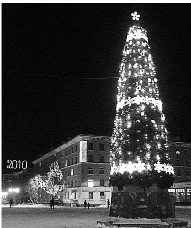
На ёлке 1800 лампочек, более 40 снежинок и еще около сотни игрушек.

Весело прошли приготовления к торжествам и в п.Росляково-1. Детвора и сказочные персонажи собрались на главной площади поселка, чтобы дать старт череде новогодних приключений и чудес. Все вместе они боролись с проказами Южного ветра, чтобы в Новый год ёлочка не осталась без