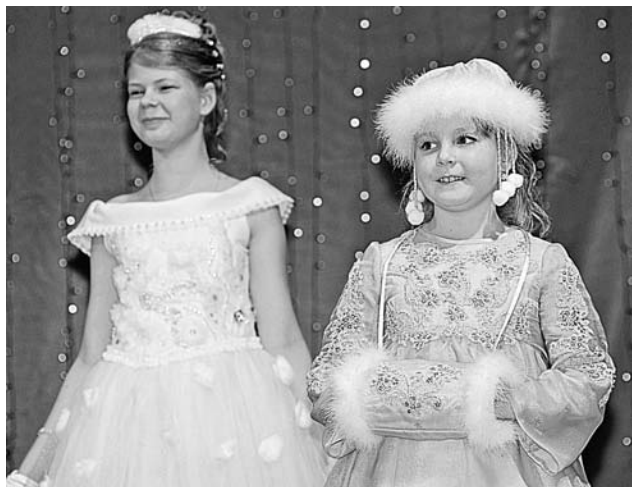
В таких нарядах конкурсантки походили не просто на снегурочек...

Ох, и поволновался же Дед Мороз! Середина декабря, скоро главную ёлку во флотской столице зажечь, детям подарки раздавать, а у него до сих пор помощницы нет. Хорошо, Белоснежка с гномом подсуетились – кастинг маленьких волшебниц организовали.