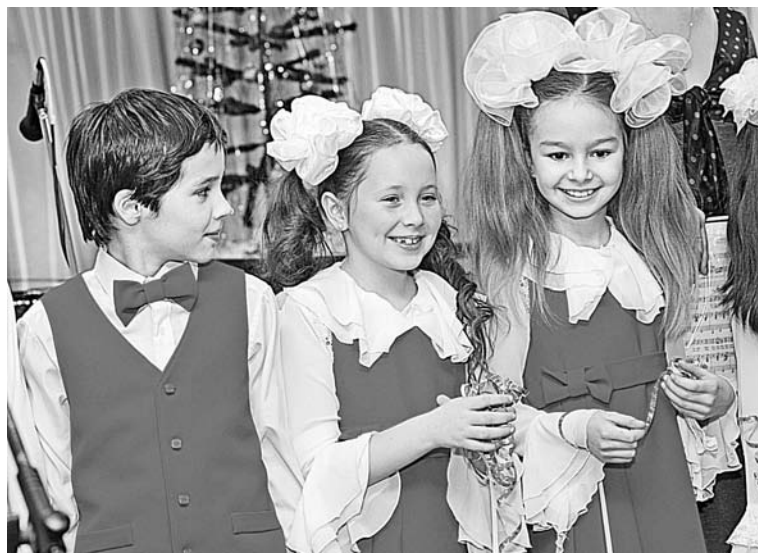
Маленькие артисты вокальных ансамблей блестяще справились с главной задачей - заразить публику праздничным настроением.

Городской фестиваль вокальной музыки «Зимняя феерия» хорошо знаком тем, кто учится пению. Очередная встреча вокалистов ЗАТО состоялась в стенах североморской ДМШ 20 декабря.