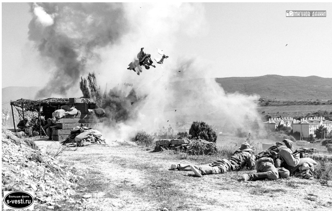
В реконструкции одного из эпизодов Афганской войны использовались пиротехника, бронетехника и охолощенное оружие.

Любовь ЧЕБАНУ.