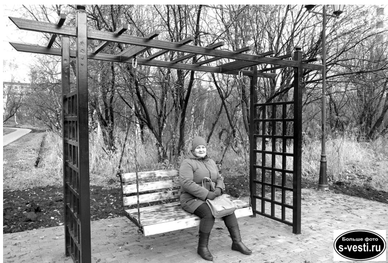
Новые лавочки-качели в городском парке уже опробованы североморцами.