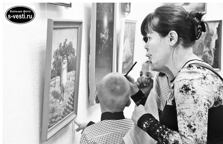
У взрослых и детей задача одна – найти разгадку. И подсказки в виде экспонатов не всегда в этом помогают.

- Внук начинает ходить в художественную школу, для него это все необычно, интересно, весело, - говорит одна из по-