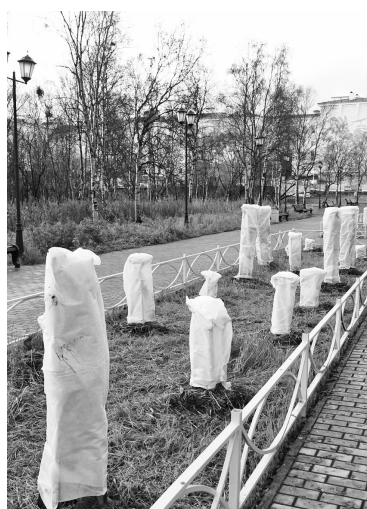
Бережное отношение к саженцам – залог весеннего цветения.

Новая детская площадка с современными игровыми элементами появилась в парке благодаря программе правительства Мурманской области «100 шагов». А в рамках программы «Инициативное бюджетирование» на танцевальной площадке