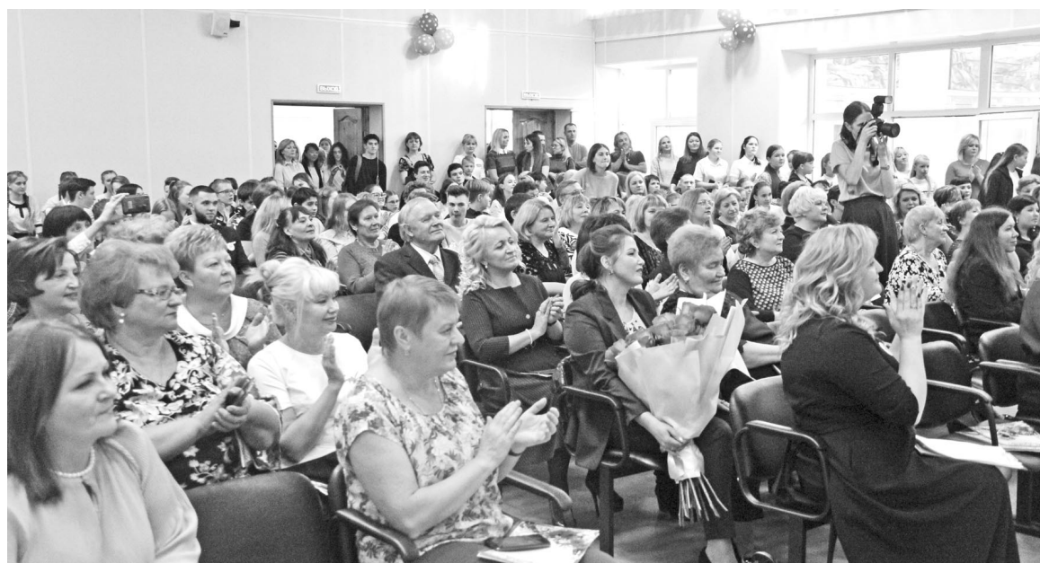
Некоторые выпускники и бывшие педагоги приехали на юбилей специально из других городов.