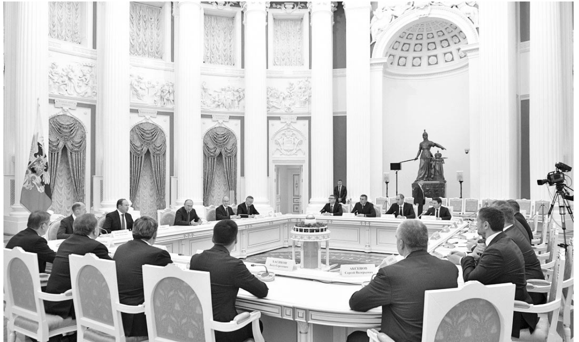
Слова напутствия от Президента России прозвучали для 19-ти губернаторов в Екатерининском зале Кремлевского дворца.