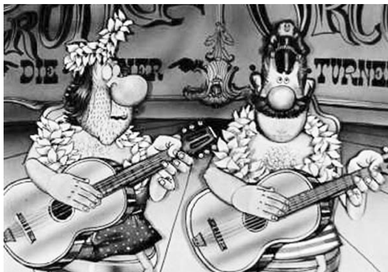
Герои мультфильма «Приключения капитана Врунгеля» вдохновили и авторов 3-го северноморского «дозора».