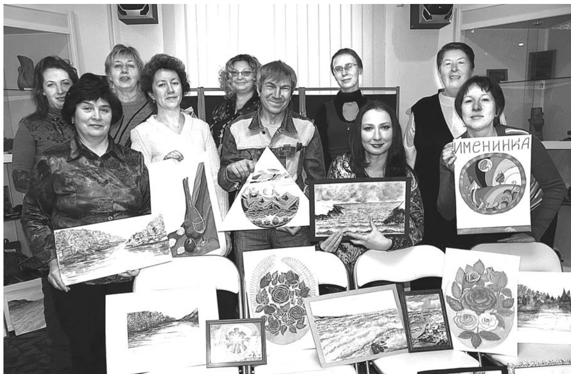
Творческий итог 3-месячных курсов: более 60-ти эскизов, графических и живописных произведений.