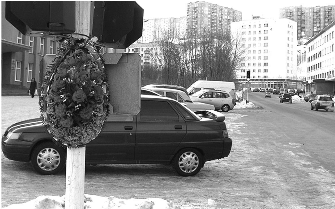
Венки вдоль дорог: новая традиция или сигнал «SOS»?

К сожалению, проблема не обошла стороной и флотскую столицу. Уже все привыкли к заупокойному виду дороги Североморск-Мурманск, появились знаки скорби и на улицах города. Однако помимо этической стороны вопроса есть и практическая. Дорога - это обычное сооружение, такое же, как мост или здание, значит, есть и нормы эксплуатации объекта. За содержание дорог в городе отвечает ООО «Автодорсервис» (АДС), а автоподъезд от Мурманска к Северо-