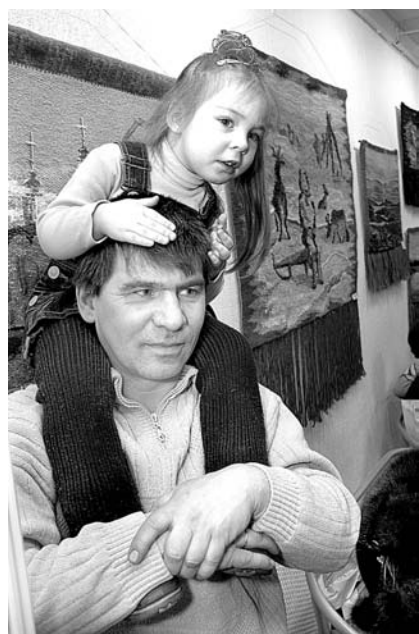
Юному зрителю интересны работы умельцев-школьников.