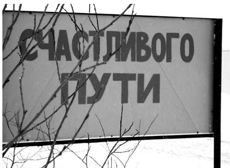
Привычные плакаты напутствия среди венков смотрятся нелепо.