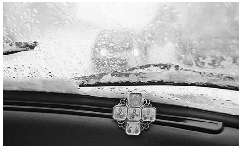
Говорят, что ангел-хранитель летает со скоростью 60 км в час. Поедете быстрее — он может не успеть...

Можно до бесконечности упрекать таксистов: и пахнут не так, и слушают не то, и недостаточно вежливы, и нарушают. Самое главное: никто из таксистов не знает руководящего документа, который по сути регламентирует их деятельность. Это Постановление Правительства РФ от 14 февраля 2009 года №112 «Об утверждении Правил перевозок пассажиров и багажа автомобильным транспортом и городским наземным электри-