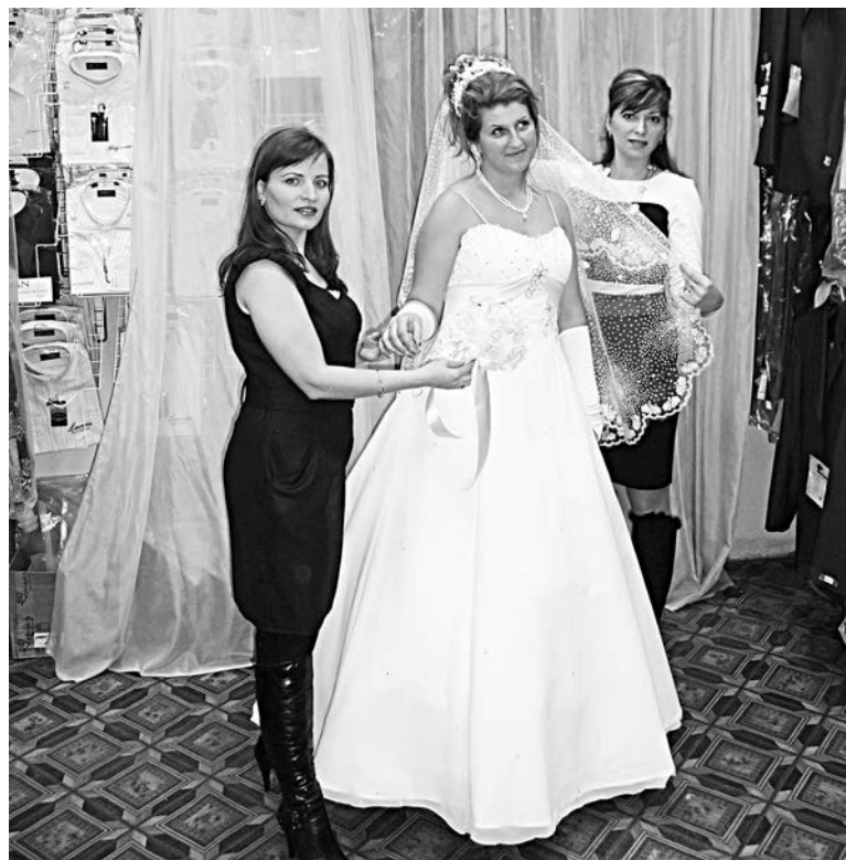
Подруги в жизни и партнеры в бизнесе Наталия Николаева и Оксана Шутюк превратят вас в королеву праздника.

Анастасия ЧЕРНИКОВА.