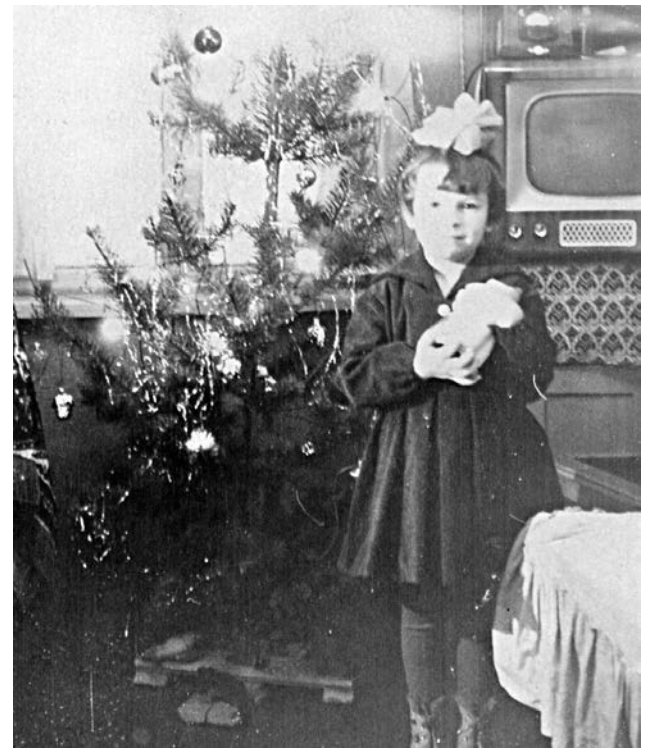
Героиня рассказа в нежном возрасте. Фото сделано в 1962 году.

А однажды на этот праздник в город привезли живых цыплят и продавали их по цене обычного яйца. Тогда и мы, и наши соседи по коммунальной квартире закупили этих желтеньких маленьких цыпляток. Но никто не знал, куда их девать, где их держать, поэтому они бегали у нас на кухне. Потом мы сделали им небольшой загончик возле печки (в то время на Кирова было еще печное отопление). Но, видимо, правильных условий для них мы так и не смогли создать, потому что я не помню, чтобы хотя бы один из них вырос. Все они погибли. Наверное, это единственное грустное воспоминание, связанное