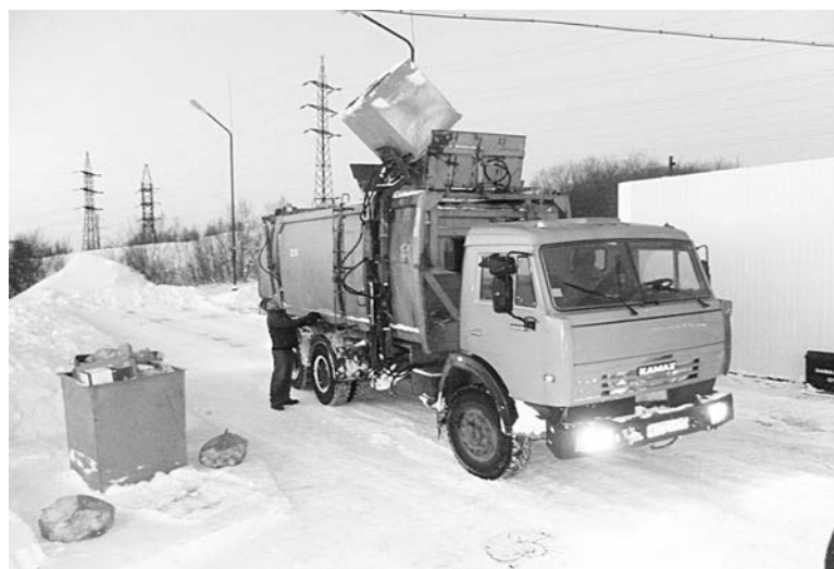
ООО «Севстрой» имеет лицензию на сбор, использование, обезвреживание, транспортировку и размещение отходов I-IV классов опасности.