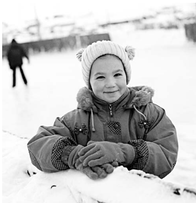
На выходных в хорошую погоду каток на ул.Чабаненко не пустует.