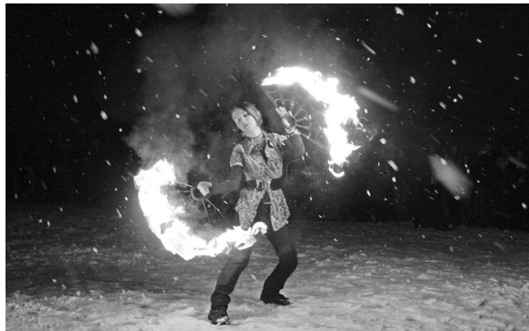
В этом году даже непогода не смогла сорвать фестиваль огня.

Каждое выступление с поями не похоже на предыдущее. Крутят ленты, флаги и, самое зрелищное, диоды и огонь. Диодные пои дают неповторимый визуальный эффект. Встроенные лампы различных цветов и мощности во время вращения оставляют в воздухе хитросплетение рисунков. С такими пои можно смело выступать в помещениях. Особой техники безопасности требуют выходы с огнем. Как в России, так и за рубежом ведется печальная статисти-