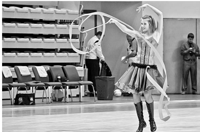
Ленты можно увидеть и в руках гимнасток.