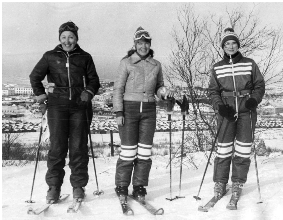
1984 год. В программе 13-го городского Праздника Севера - горные лыжи. Место сбора - Маячная сопка.