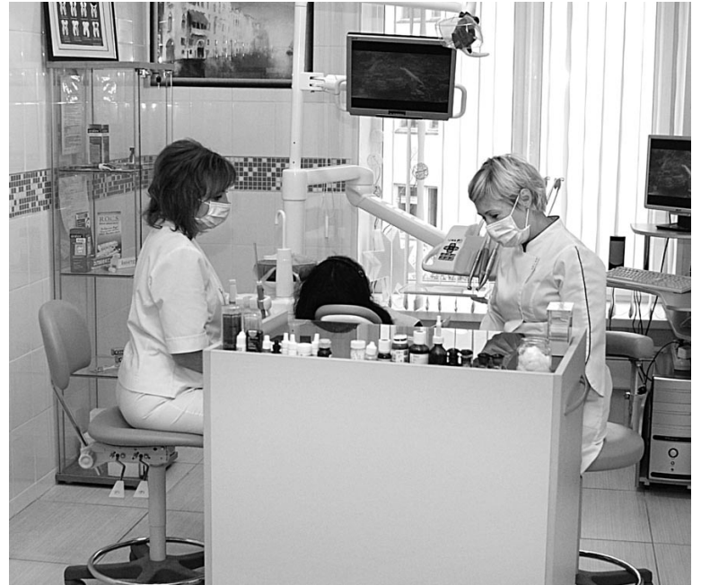
Стоматологическое отделение Центра «Аврора» зарекомендовало себя как одно из лучших в области.

Восстановительная медицина, или клиническая реабилитация, возвращает человека к привычному ритму жизни после продолжительной болезни или хирургического вмешательства. Наши пациенты – это в первую очередь перенесшие инсульт, а также люди с хроническими болями в спине, головными болями, патологией нервной системы и кардиобольные. В последнее время это заболевание заметно помолодело. Ему подвержены люди 30-40, а то и 20 лет. В их случае клиническая реабилитация просто необходима для восстановле-