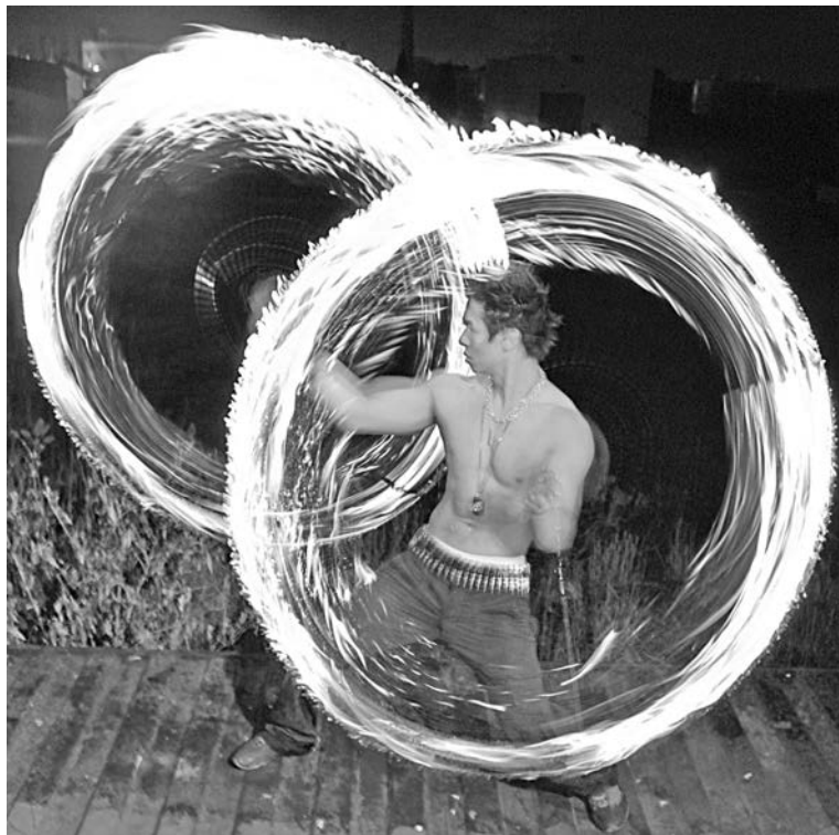
Не знаешь, куда смотреть: на огонь или его властителя.

ка тех, кто пострадал от огня во время выступлений и тренировок.