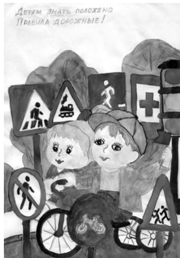
Рисунок Алексея Буганова.