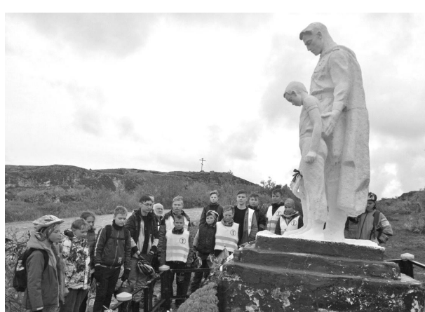
Участники велопохода возложили цветы к памятникам защитникам Заполярья.

Детского морского центра им. В.Пикуля 60 велосипедистов в возрасте от 3 до 83 лет проехали по маршруту Североморск - Муста-Тунтури - Североморск.