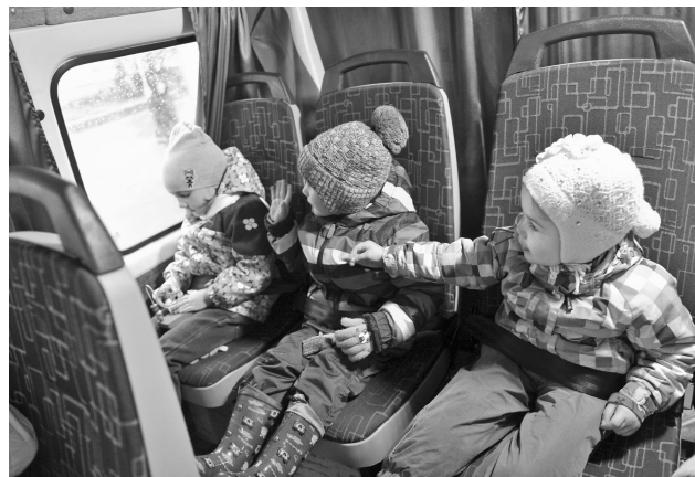
По дороге в детский сад: общение, развивающие игры и знакомство с окружающим миром за окном.