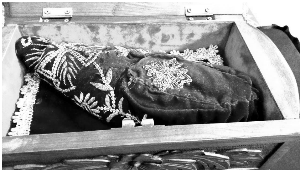
Башмачок святого Спиридона.

Ящик Пандоры открыт. Как привлечь народ в церковь? Учить Слово Божие? Мартышкин труд. А вот что! Штампем больше святынь. Шапочка преподобного Иова Почаевского, стоптанные тапочки святителя Спиридона Тримифунтского, частица дуба Мамврийского, камень первоученика Стефана, водичка и су-