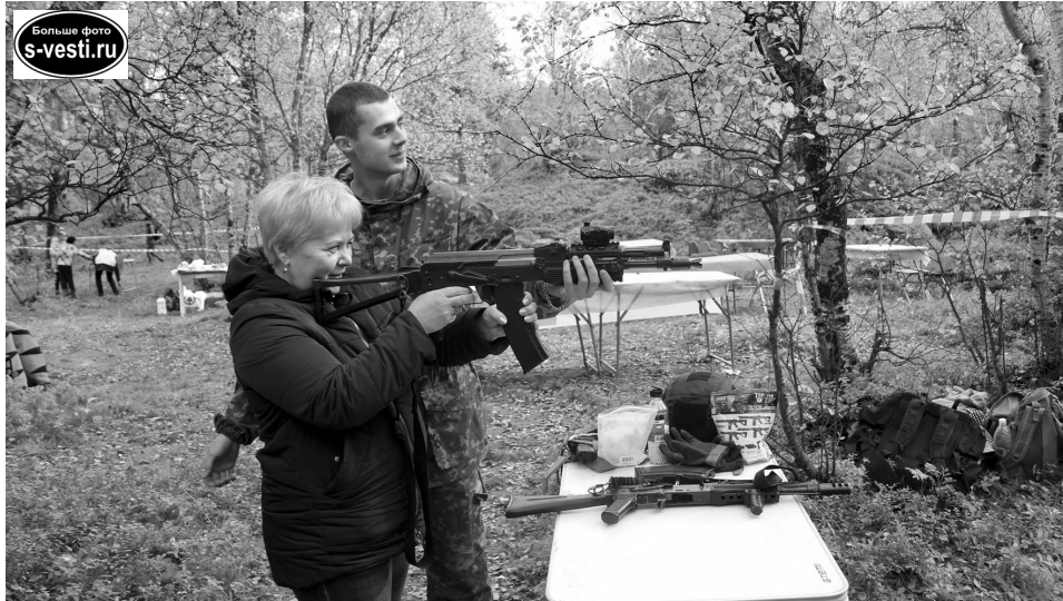
Площадка для стрельбы из пневматической винтовки на паралимпийских играх пользуется особой популярностью: если не пострелять, то сделать фото на память сюда приходят практически все участники слета.

Состав участников паралимпийских игр - члены североморских общества слепых и общества инвалидов, участники проекта «Люди на колясках» и «Особым детям — особую заботу», незаменимые помощники - ребята из городской