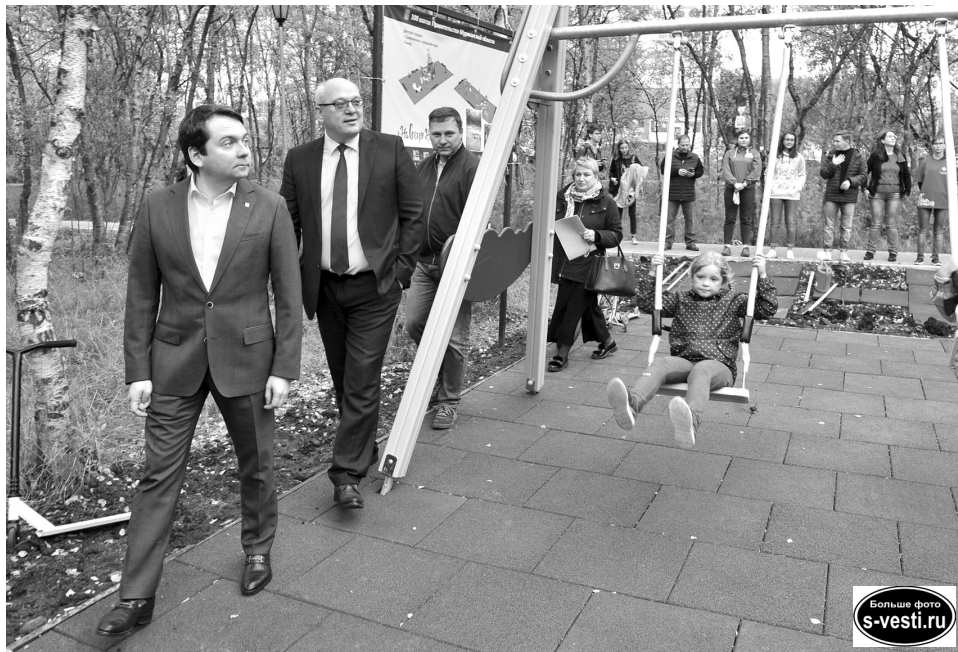
Андрей Чибис и глава ЗАТО Североморск Владимир Евменьков посетили обновленную детскую площадку в городском парке.

В Мурманской области продолжается реализация Плана «100 шагов» – комплекса дополнительных мер, инициированных главой региона Андреем Чибисом и призванных повысить качество жизни в регионе.