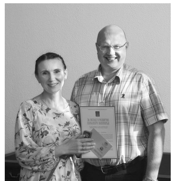
Вклад североморских предпринимателей в развитие Кольского Заполярья оценен по достоинству.