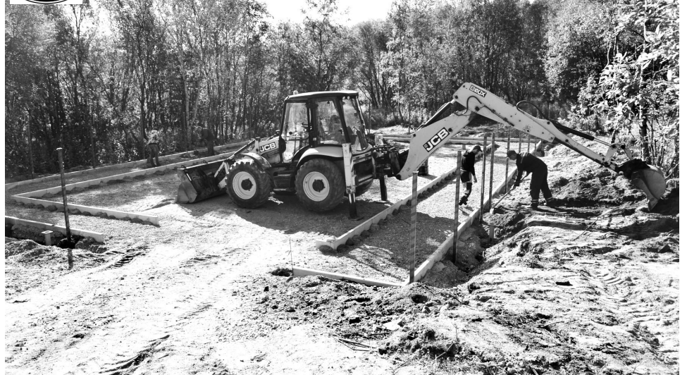
Помимо тренажеров для четвероногих питомцев, площадка будет оборудована информационным стендом о правилах поведения - это уже для хозяев.

ной и отсыпанной территории. Жители уже могут подавать свои предложения на участие в программе «Формирование комфортной городской среды», данный участок сухой, коммуникаций подземных нет, так что подойдет любой вариант: сквер, парковка, игровая площадка.