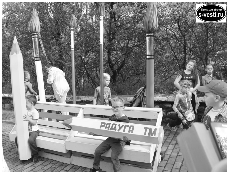
Наиболее популярной среди ребят была тематическая фотозона.

- Действительно, к словам Кота почти нечего добавить, - сказал с улыбкой градоначальник. - Этот проект – плод усилий многих.