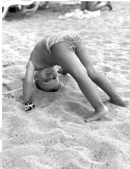
Тимур Гусейнов, 2,9 года.