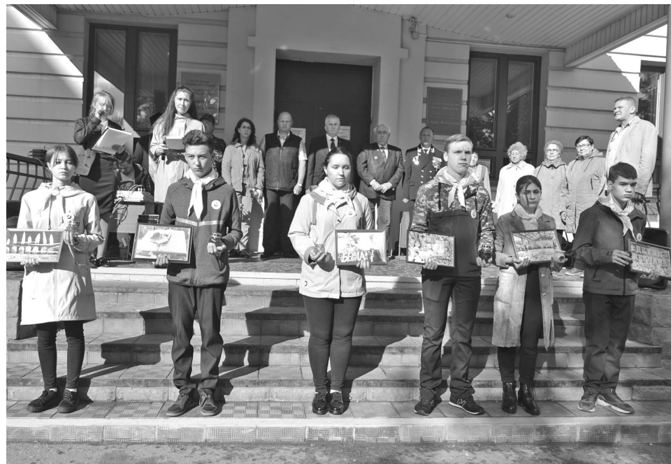
Митинг с минутой молчания, в котором принимают участие ученики североморских школ, проходит ежегодно.