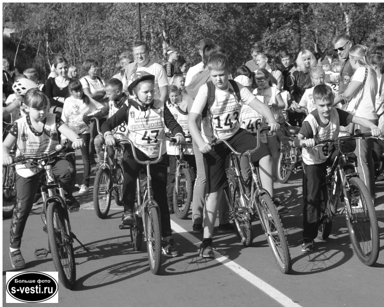
Первые осенние велостарты показали, что за летние каникулы юные североморцы набрались сил и здоровья.