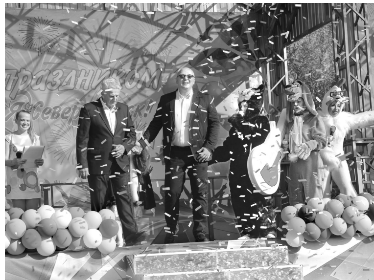
Вместе с новой сценой открылся и очередной сезон творческих коллективов ЗАТО Североморск.

ко работали интерактивные площадки, проводились мастер-классы для детей, шла запись в творческие коллективы, выставлялись картины местных художников, открылась торговая ярмарка.