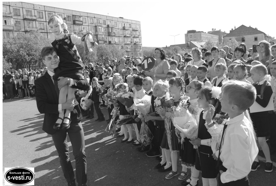
С погодой школьникам повезло: не каждая линейка проходит под открытым небом!